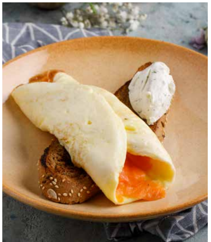
Омлет с лососем / ветчиной и грибами 450/350 ₺ Omelette with salmon / ham and mushrooms