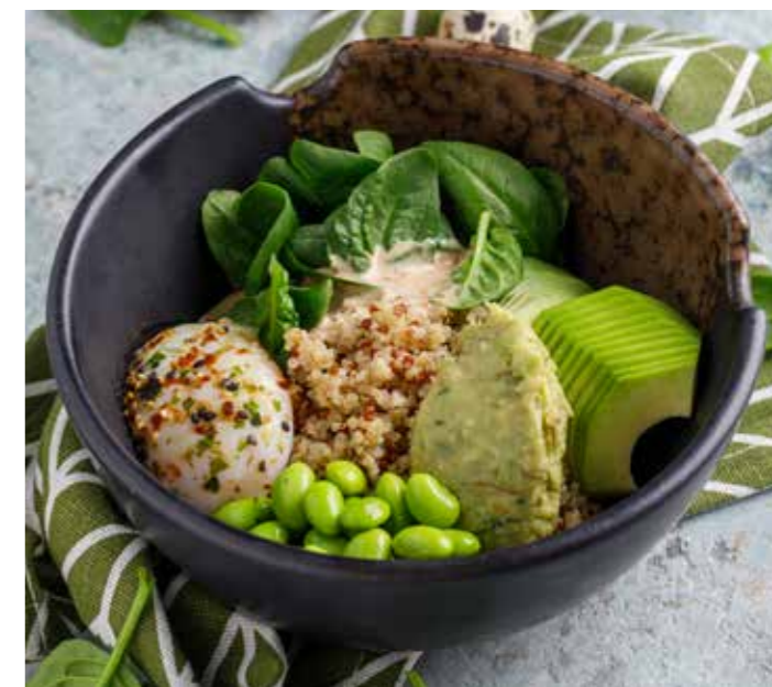
Киноа с авокадо, гуакамоле, шпинатом и эдамамэ 410 ₺ Quinoa with avocado, guacamole, spinach and edamame

КАША НА ВОДЕ / МОЛОКЕ PORRIDGE ON WATER / ON MILK