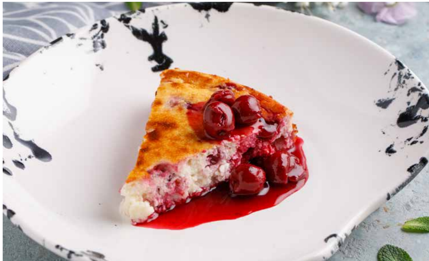
Запеканка с вишней Cottage cheese pudding with cherry