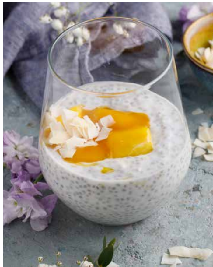
Чиа-пудинг на кокосовом молоке Chia seed pudding with coconut milk