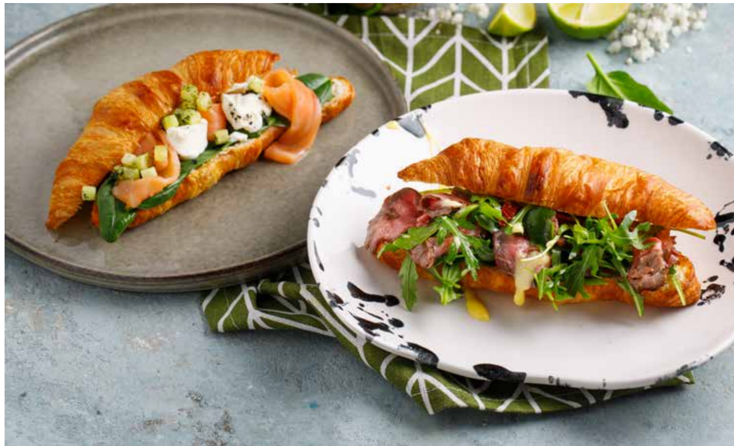
Круассан с лососем / с ростбифом Croissant with salmon / roast beef