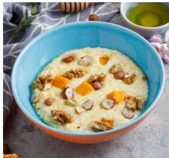
Пшениная каша с тыквой и орехами 250 ₺ Millet porridge with pumpkin and nuts