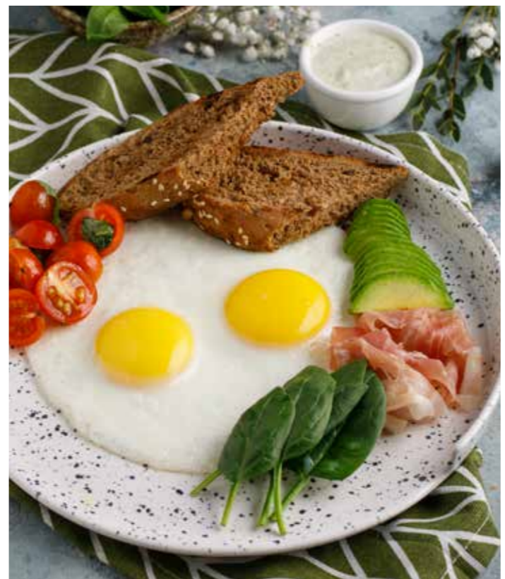
Яичница с авокадо, пармой, черри и шпинатом 390 ₺ Fried eggs with avocado, Parma, cherry tomatoes and spinach