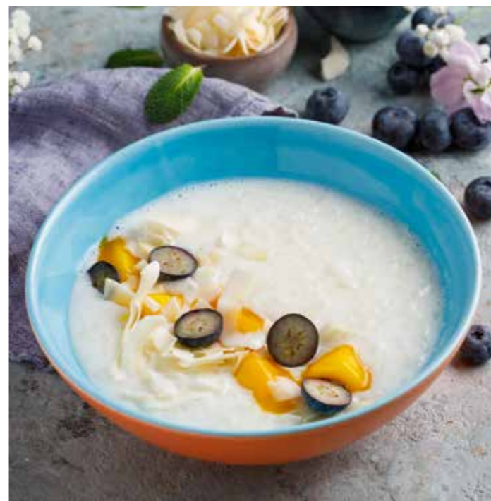
Рисовая каша с манго, мёдом и кокосовыми чипсами 290 ₺ Rice porridge with mango, honey, and coconut chips

СМУЗИ ЯБЛОКО-ШПИНАТ APPLE SPINACH SMOOTHIE 250 ₺