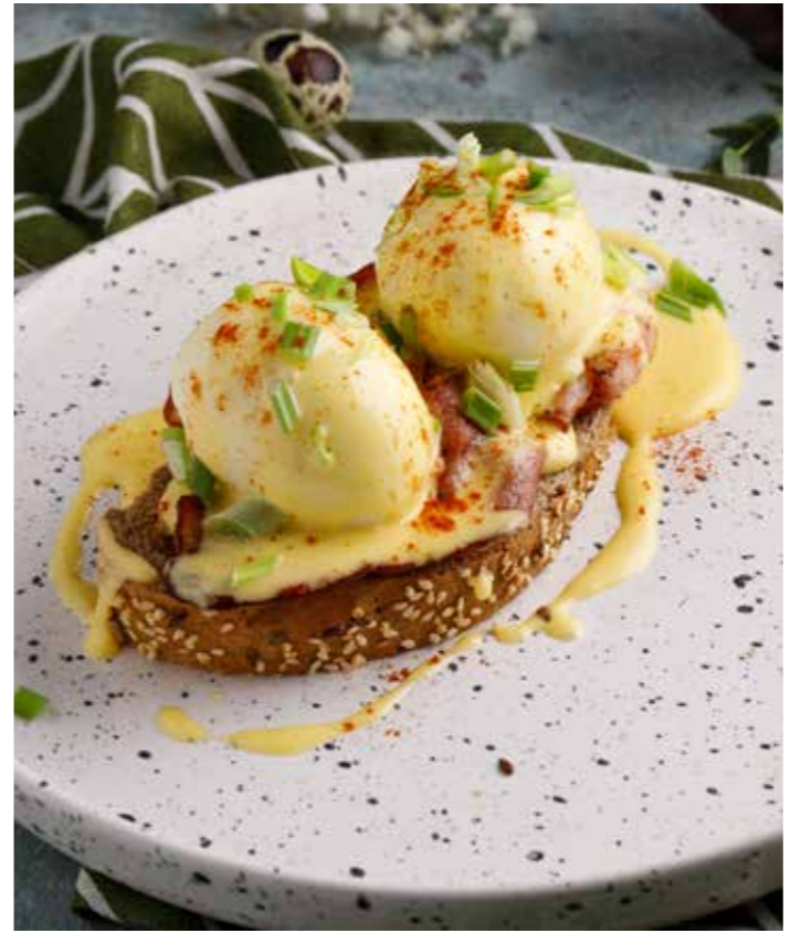
Бенедикт с беконом / лососем 300/440 ₺ Egg Benedict with bacon / salmon