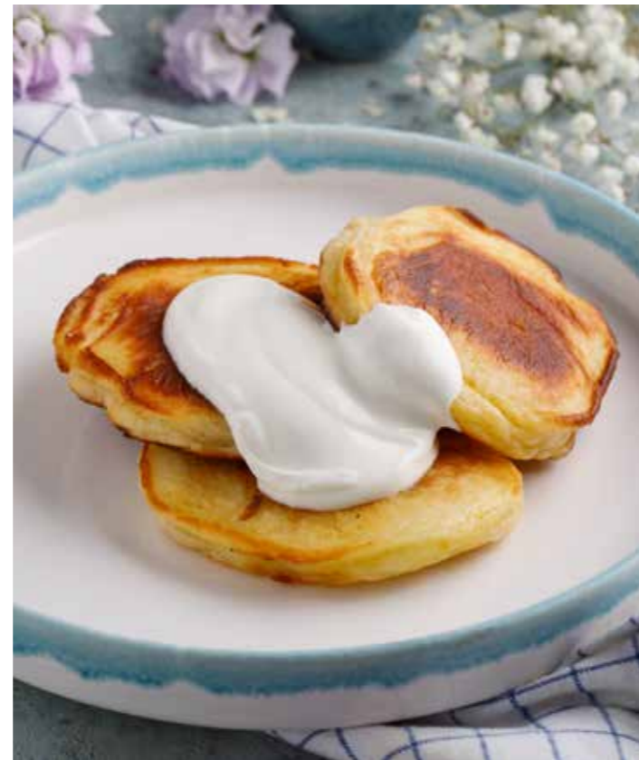
Оладьи по бабушкиному рецепту со сметаной

Homemade pancakes with jam and sour cream