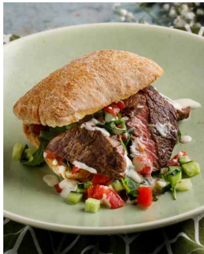
Панини с говяжьей вырезкой Panini with beef tenderloin