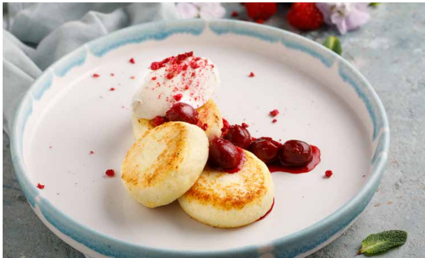
Сырники с вишневым вареньем и сметаной Cottage cheese pancakes with cherry jam and sour cream