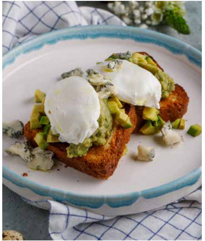
Бриошь с авокадо, яйцом и сыром горгонзола 390 ₺ Brioche with avocado, egg and gorgonzola cheese