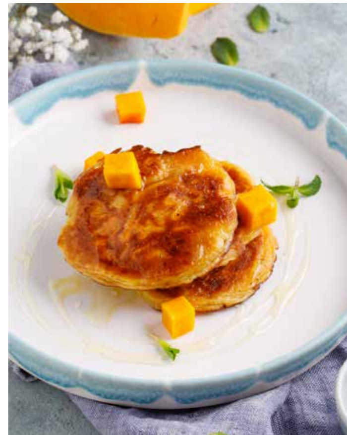
Оладьи из тыквы Pumpkin pancakes