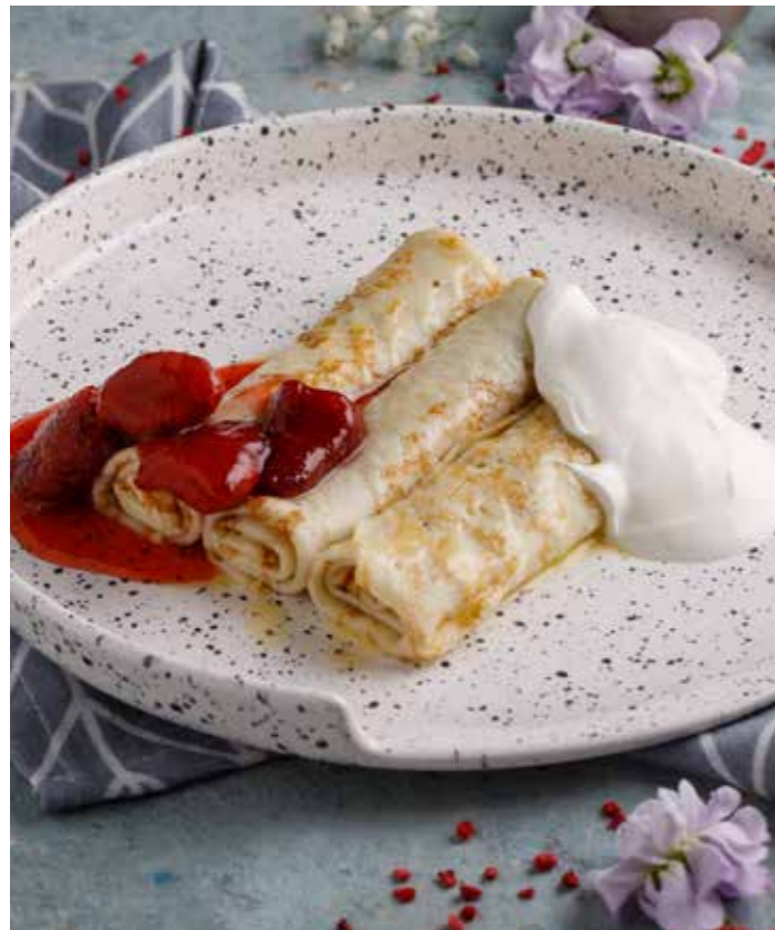
Домашние блины с вареньем и сметаной