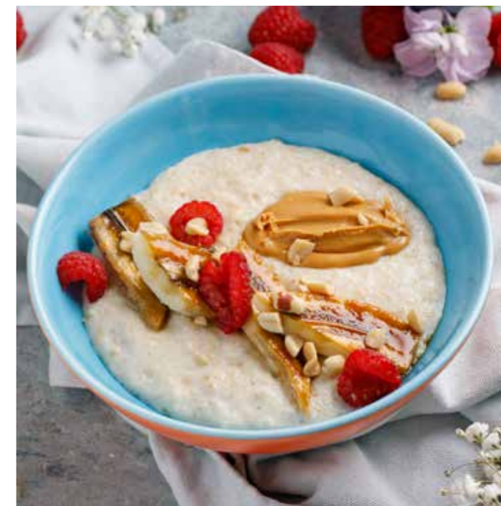
Овсяная каша с бананом и арахисовой пастой 290 ₺ Oatmeal porridge with banana and peanut butter