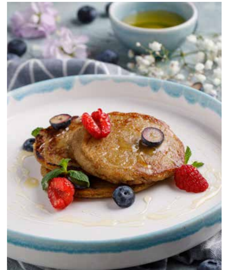
Овсяные оладьи с мёдом и ягодами Oatmeal pancakes with honey and berries