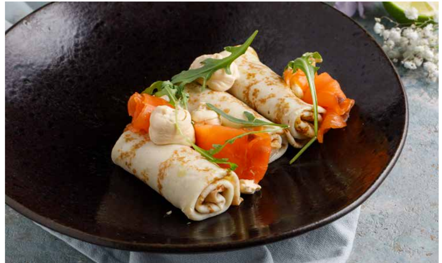
Блины с лососем и крем-чизом

Granny's recipe pancakes with sour cream