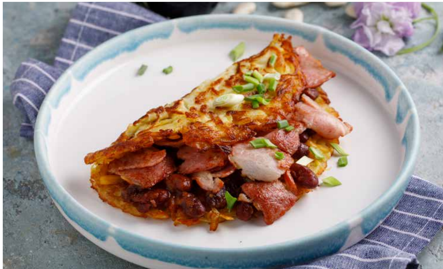
Драник с фасолью и сыром чеддер Potato pancakes with cheddar cheese and beans