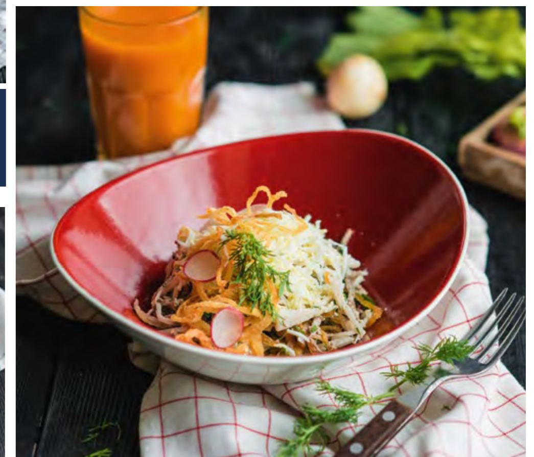
САЛАТ ТАШКЕНТ | 390 TASHKENT SALAD Нежная отварная говядина с колечками лука фри, редькой и отварным яйцом Tender boiled beef with onion rings, roasted in deep fat, radish and boiled egg