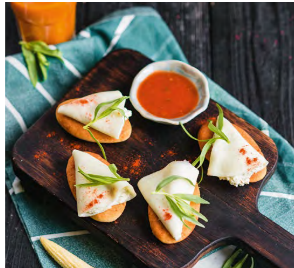
ЗОЛОТИСТЫЕ МЧАДИ С СЫРОМ СУЛУГУНИ