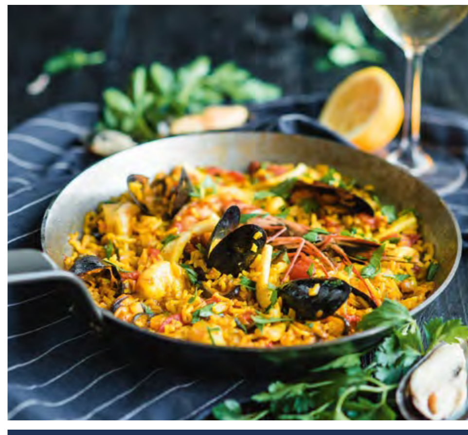
ПАЭЛЬЯ С МОРЕПРОДУКТАМИ SEAFOOD PAELLA