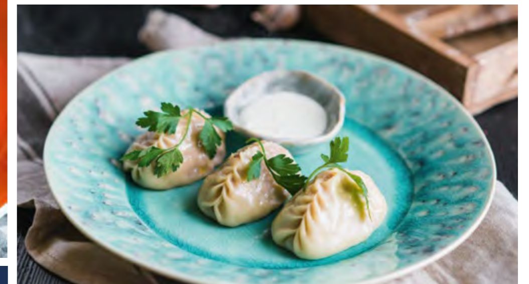
МАНТЫ С МЯСОМ ЯГНЕНКА