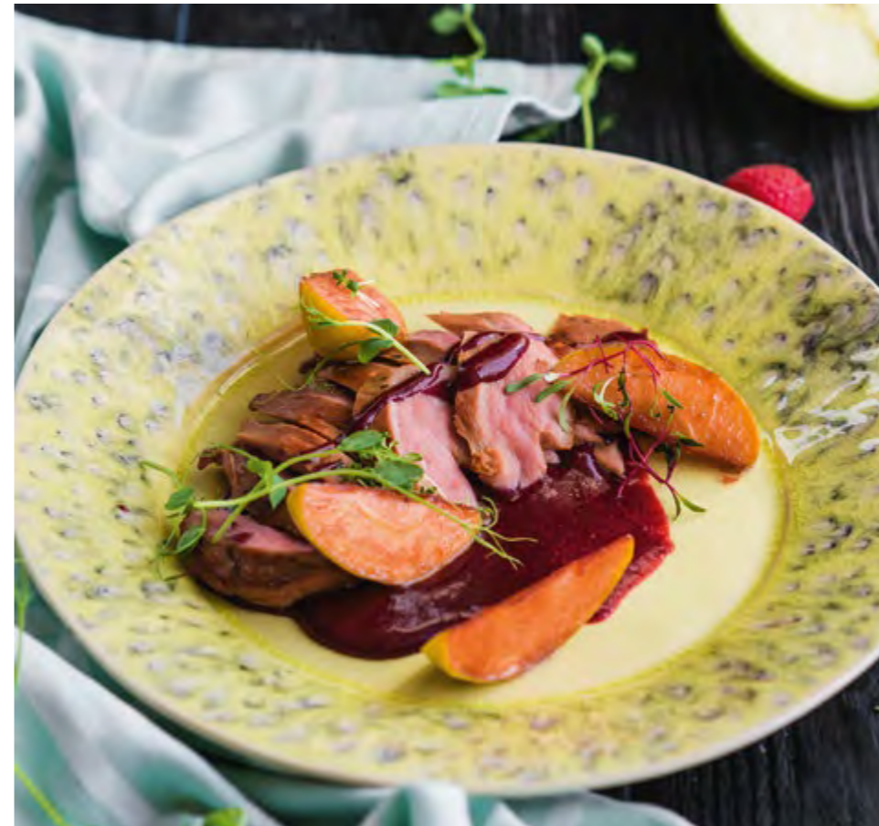
РОСТОВСКАЯ УТИНАЯ ГРУДКА С ЯБЛОКАМИ И ЯГОДНЫМ БАРБЕКЮ ROSTOV DUCK BREAST WITH APPLES AND BERRY BARBECUE