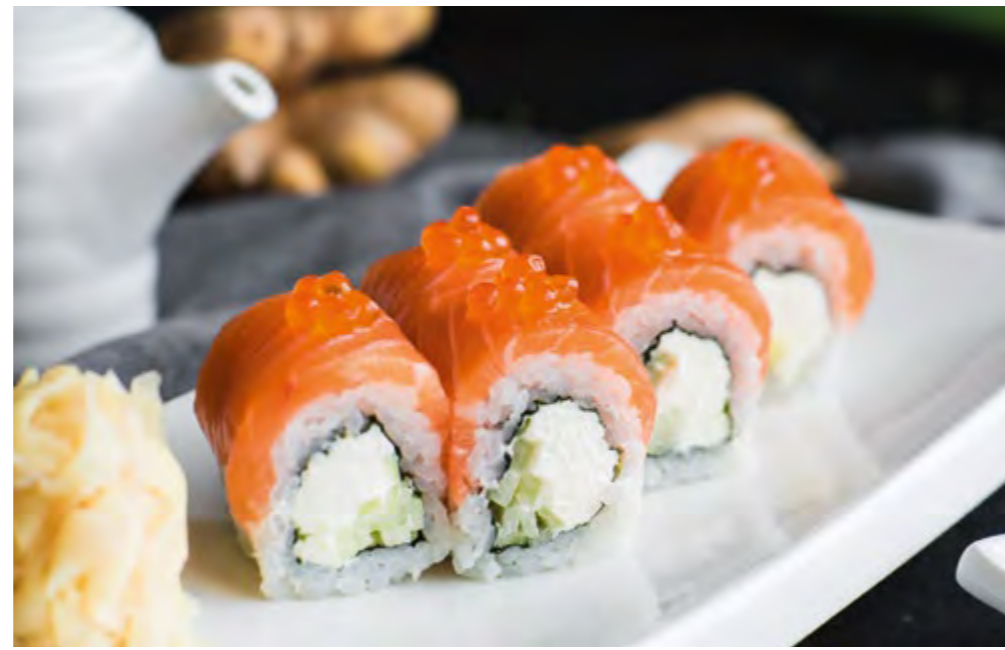
ФИЛАДЕЛЬФИЯ ЛЮКС PHILADELPHIA LUXE