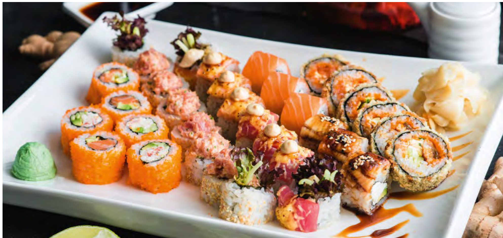
МЕГА СЕТ MEGA SET