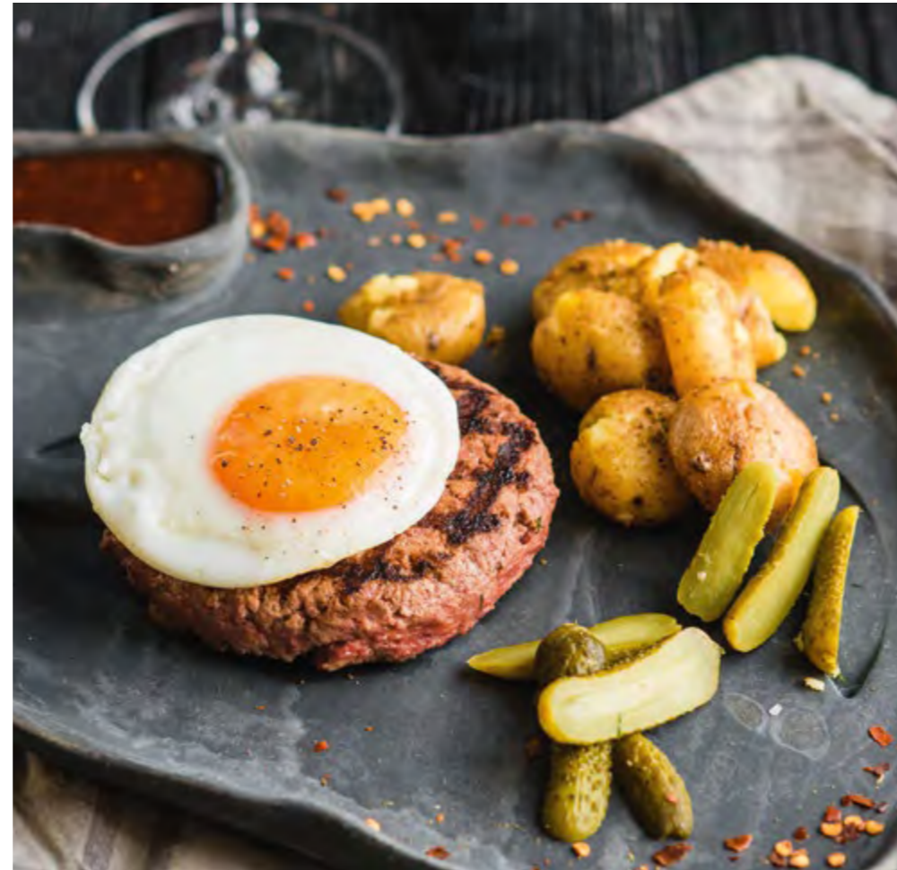
РУБЛЕННЫЙ БИШТЕКС ИЗ ГОВЯДИНЫ И ЯГНЕНКА С МОЛОДЫМ КАРТОФЕЛЕМ | 790 CHOPPED BEEF-AND-LAMB STEAK WITH YOUNG POTATOES |