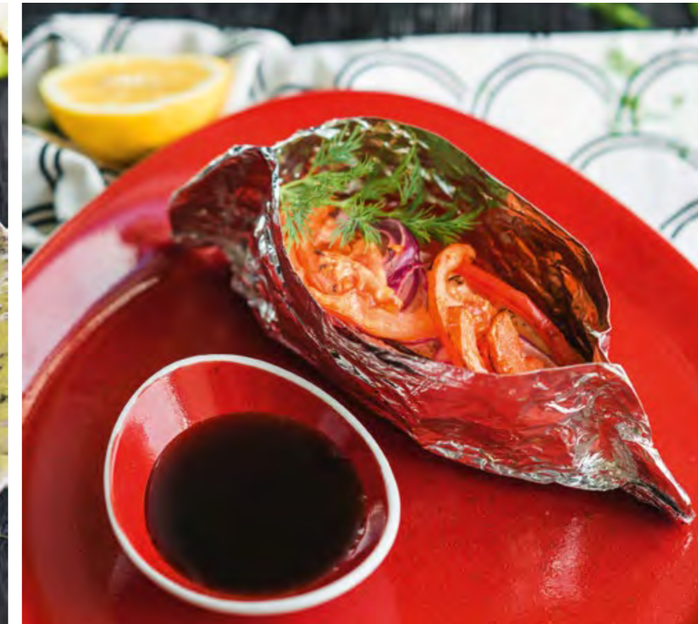
ФИЛЕ ОСТРОВНОГО ЛОСОСЯ, ЗАПЕЧЕННОГО В ФОЛЬГЕ С ОВОЩАМИ FOIL-BAKED FILLET OF ISLAND SALMON WITH VEGETABLES