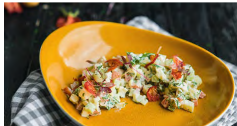
САЛАТ ПО-ГАЛЬСКИ | 380 SALAD IN GALI STYLE Классический салат из нежного куриного филе и овощей Classic salad with tender chicken fillet and vegetables