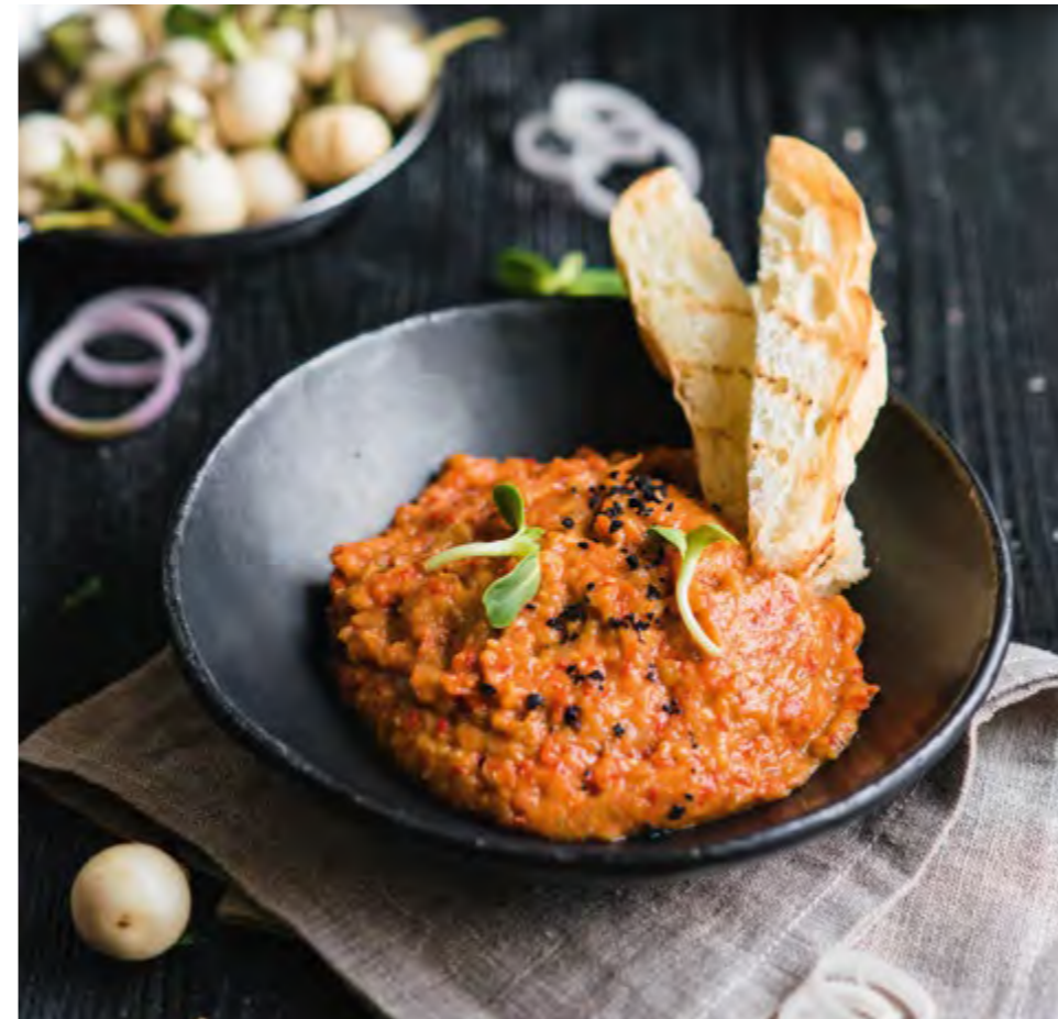
ИКРА ИЗ ГРУНТОВЫХ БАКЛАЖАНОВ SPREAD MADE OF OUTDOOR EGGPLANTS