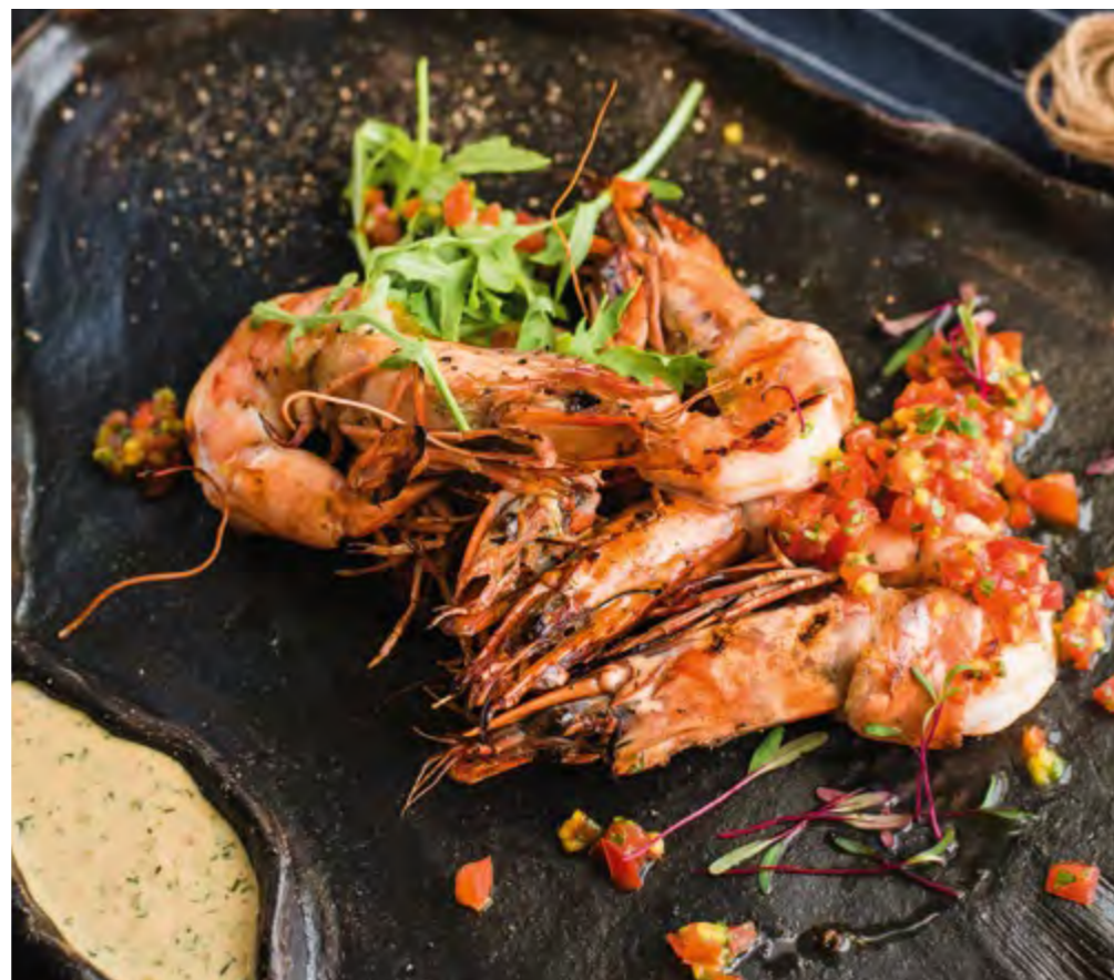
КОРОЛЕВСКИЕ КРЕВЕТКИ С ОВОЩНОЙ САЛЬСОЙ ROYAL SHRIMPS WITH VEGETABLE SALSA