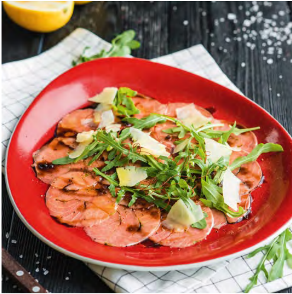
КАРПАЧО ИЗ ЛОСОЯ SALMON CARPACCIO