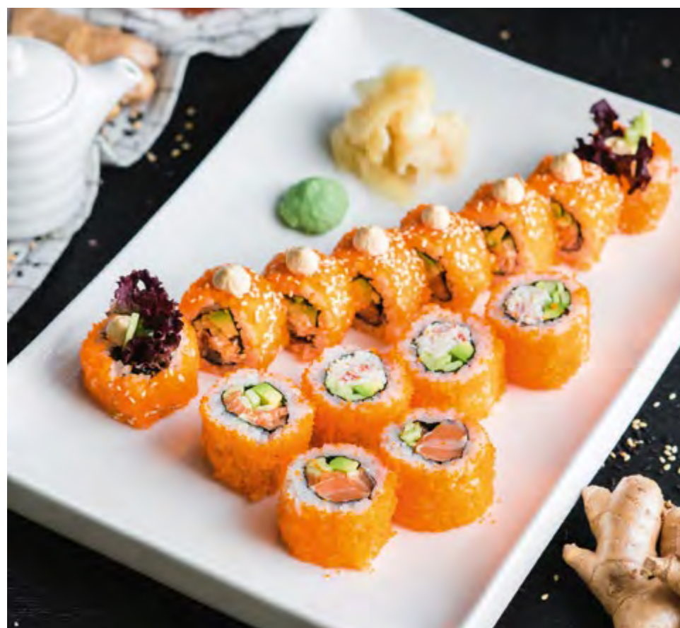
РОЛЛ СЕТ КАЛИФОРНИЯ CALIFORNIA ROLL SET

КЛАССИЧЕСКИЙ 260 С МОРЕПРОДУКТАМИ 420 С ЛОСОСЕМ 370 CLASSIC WITH SEAFOOD WITH SALMON