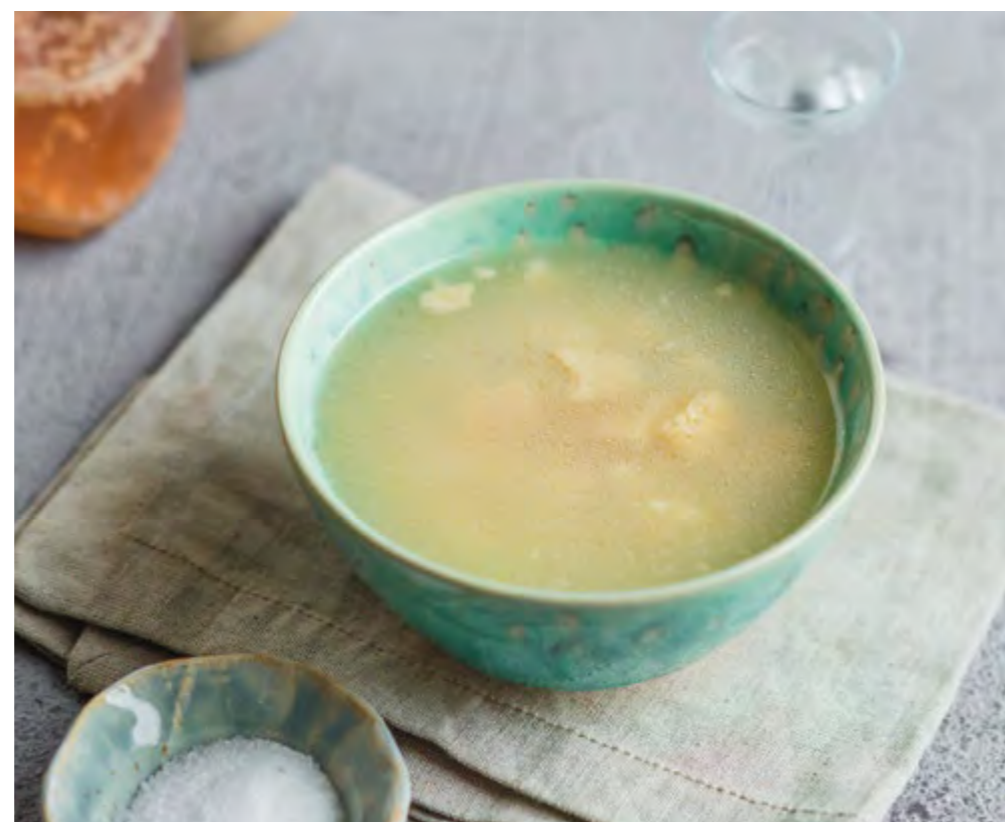
ХАШ СО СТОПКОЙ ЧАЧИ KHASH WITH A SHOT OF CHACHA

Насыщенный бульон из говяжьих ножек и рубца, который готовится в течение 8 часов на медленном огне