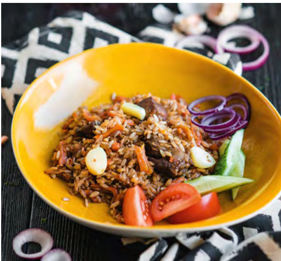
ПЛОВ ЧАЙХАНА CHAIKHANA PILAF