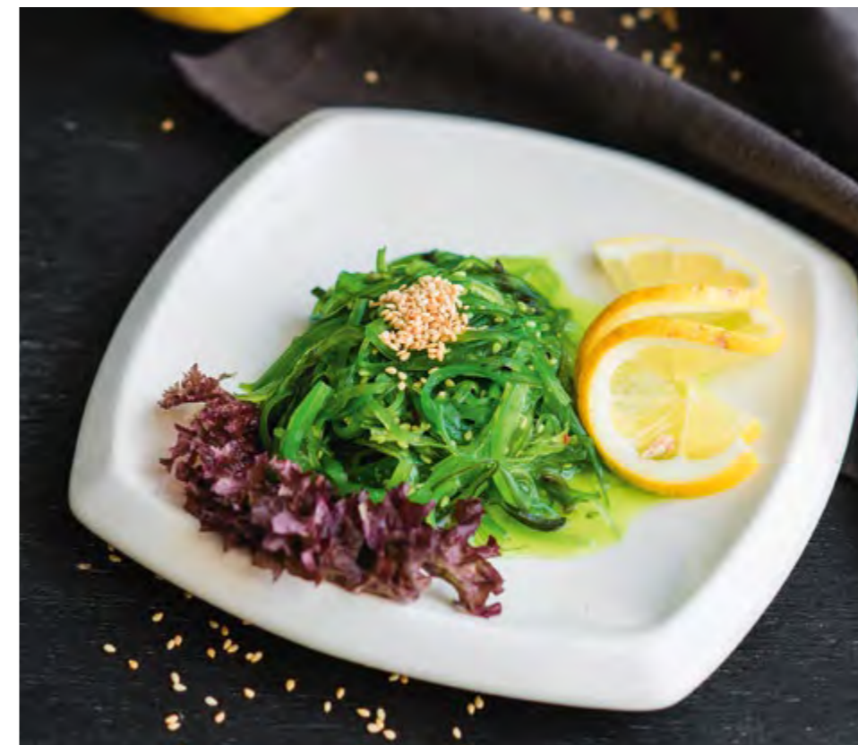
САЛАТ КАЙСО | KAISO SALAD

КЛАССИЧЕСКИЙ 330 С КРАБОМ 440 CLASSIC WITH CRAB