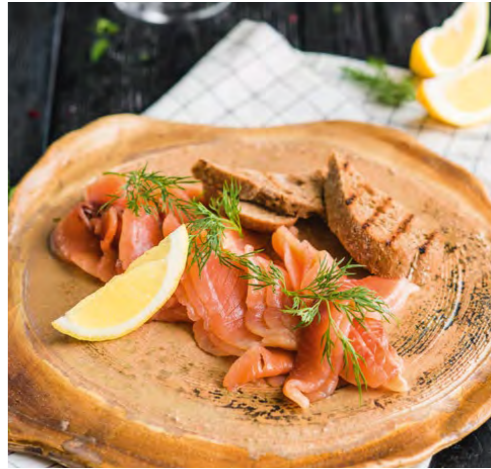
ЛОСОСЬ СЛАБОЙ СОЛИ С РЖАНЫМИ ГРЕНКАМИ LIGHTLY SALTED SALMON WITH RYE TOASTS