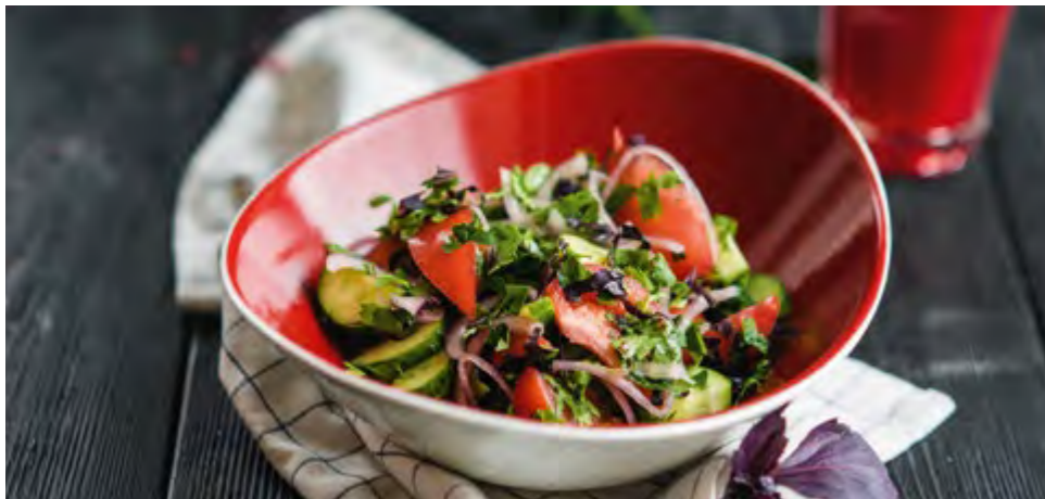
САЛАТ ПО-ГРУЗИНСКИ СО СПЕЦИЯМИ | 410 GEORGIAN STYLE SALAD WITH SPICES