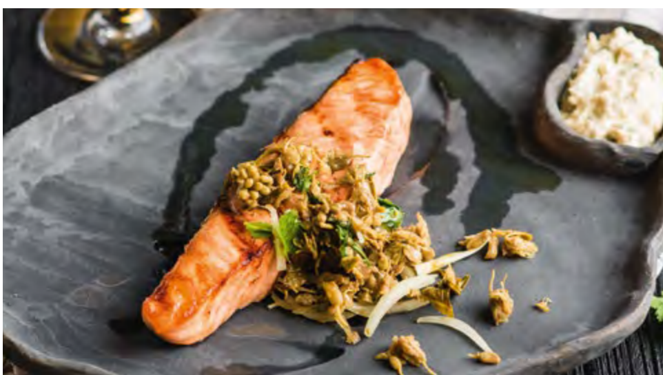
СТЕЙК ИЗ ОСТРОВНОГО ЛОСОСЯ ISLAND SALMON STEAK