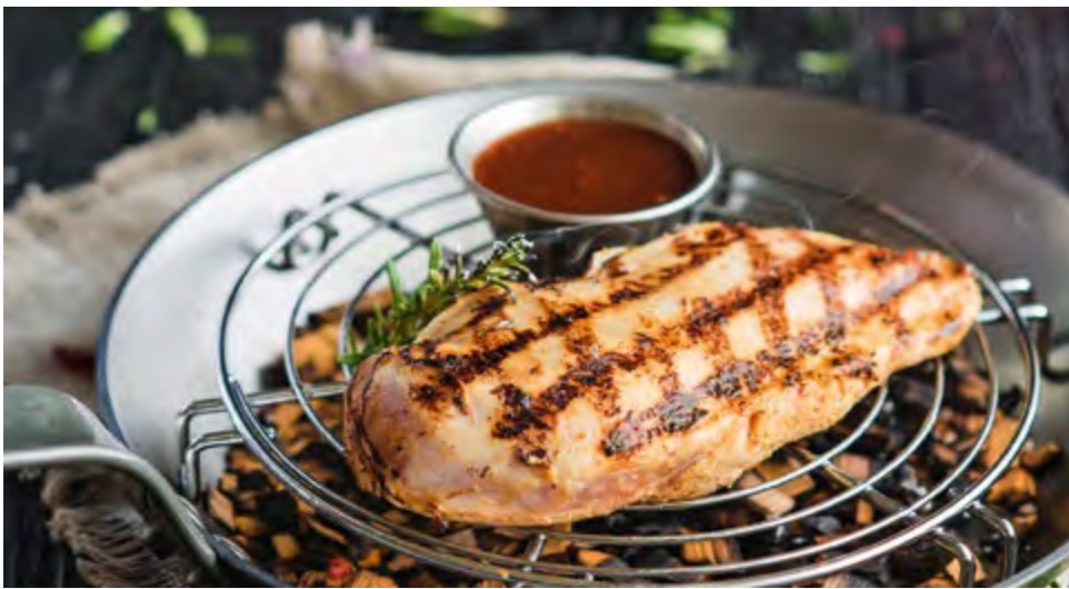
КУРИНАЯ ГРУДКА НА ГРИЛЕ GRILLED CHICKEN BREAST