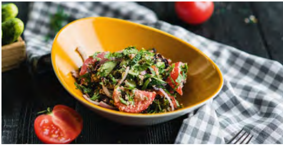
САЛАТ ПО-ГРУЗИНСКИ С ГРЕЦКИМ ОРЕХОМ | 410 GEORGIAN STYLE SALAD WITH WALNUTS