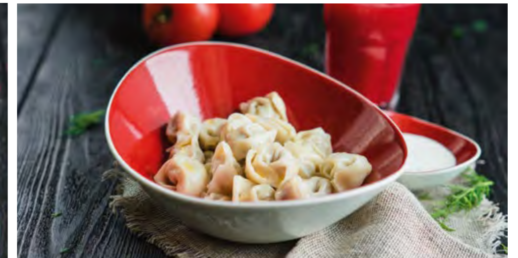
ЧУЧВАРА СО СМЕТАНОЙ