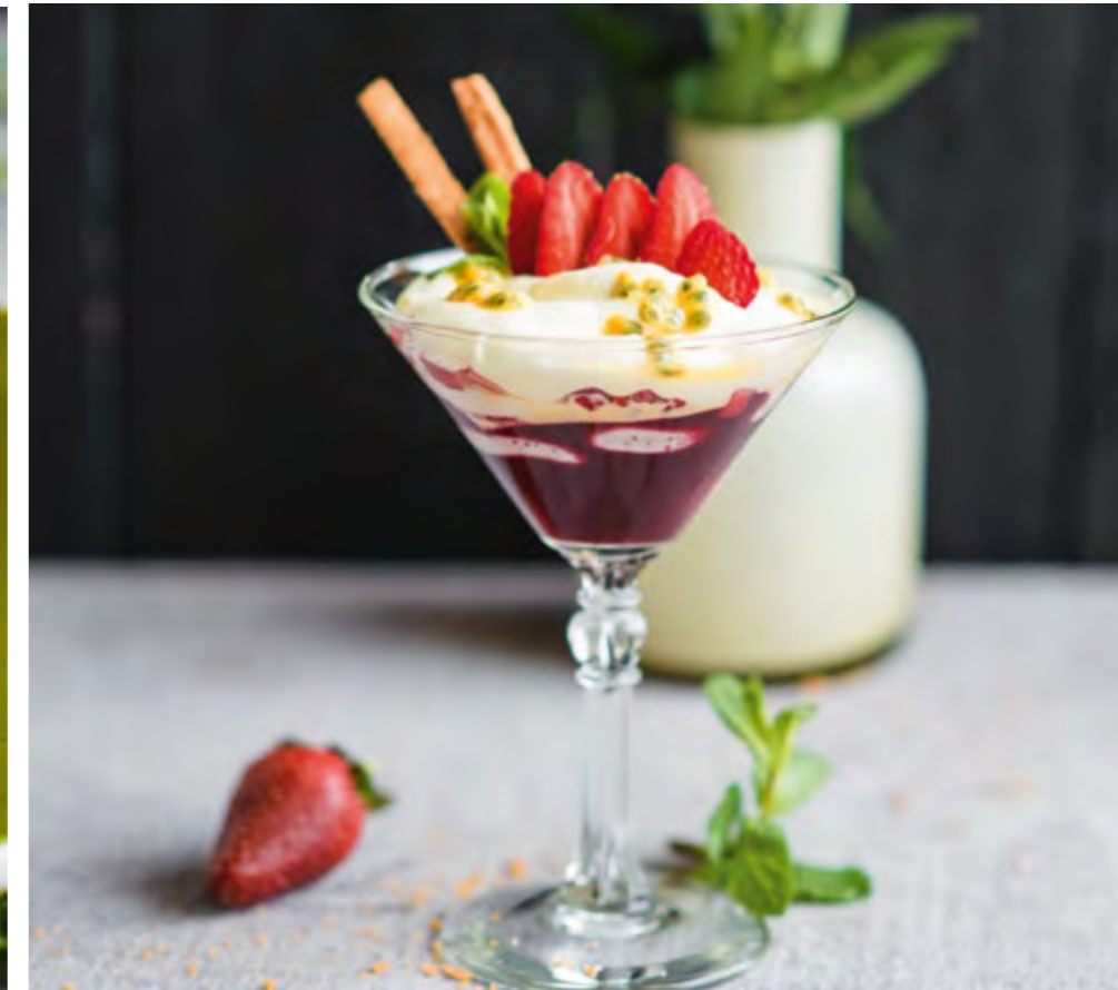
МАСКАРПОНЕ С САДОВОЙ КЛУБНИКОЙ MASCARPONE WITH GARDEN STRAWBERRY