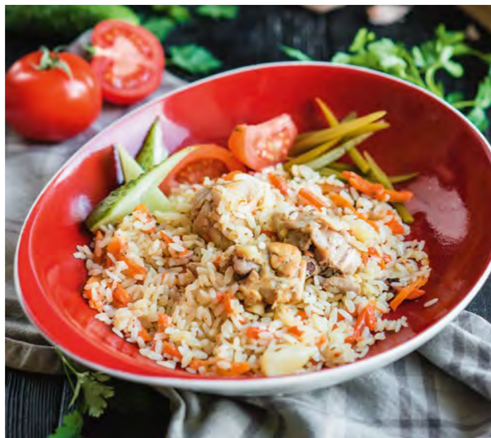
ПЛОВ ПО-БУХАРСКИ С КУРИЦЕЙ PILAF IN BUKHARA WITH CHICKEN