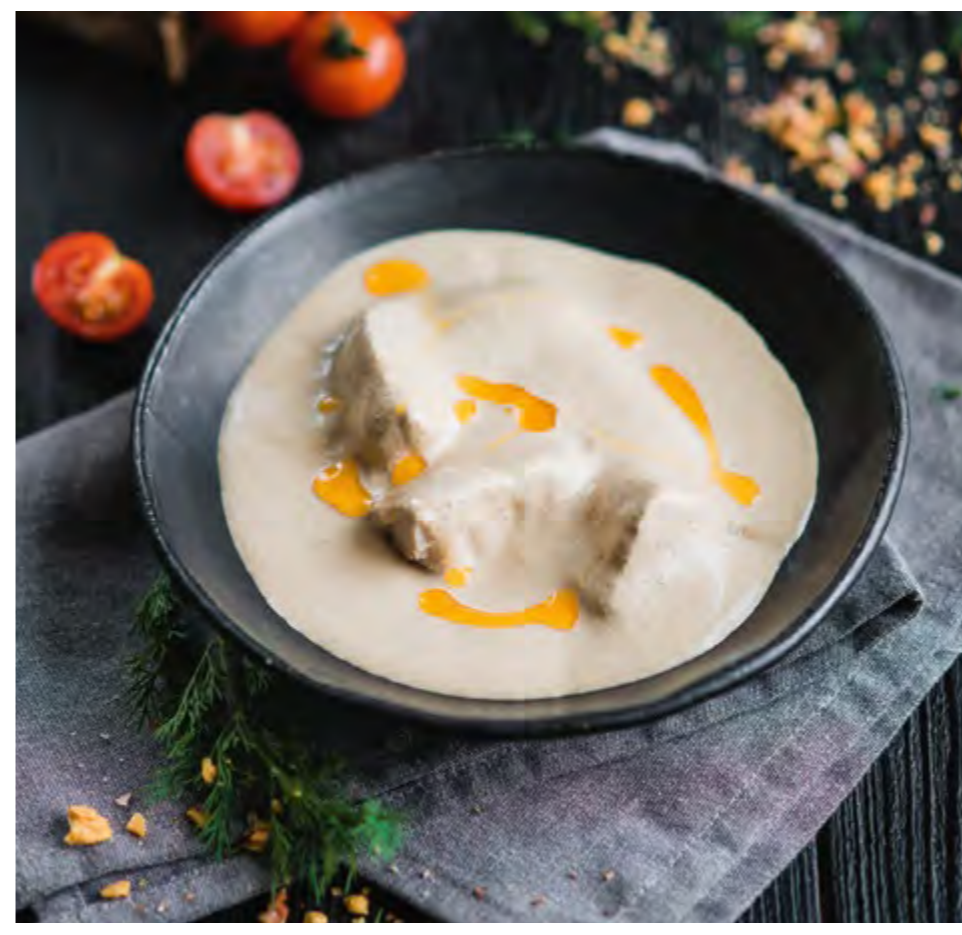
САЦИВИ ПО-МЕГРЕЛЬСКИ SATSIVI IN MINGRELIAN STYLE