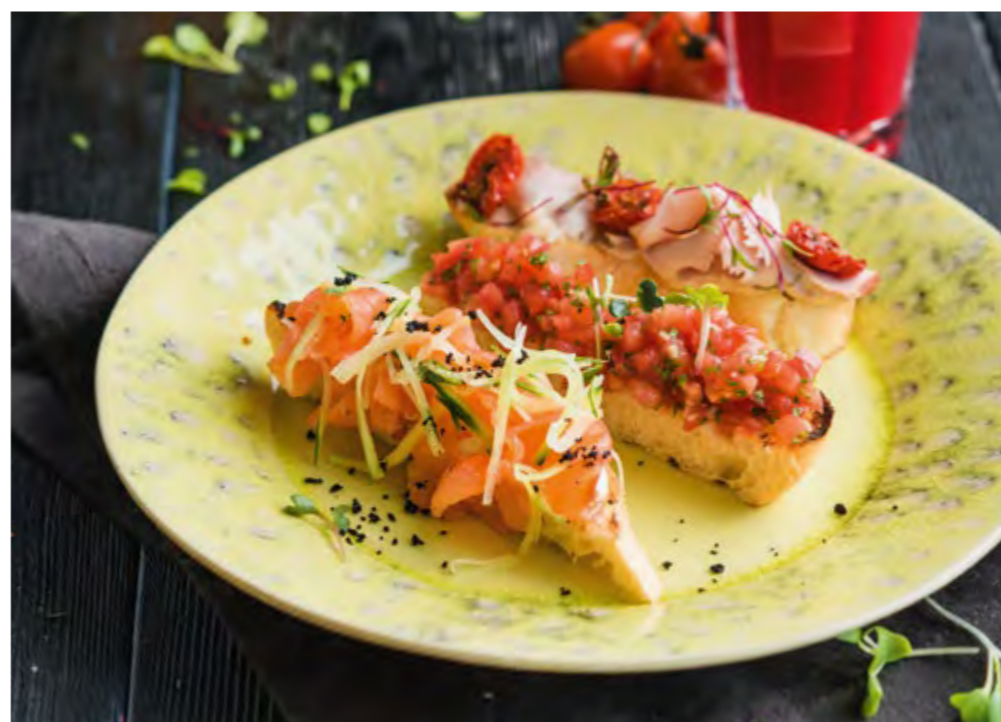
БРУСКЕТТА | BRUSCHETTA

С ЛОСОСЕМ И СОУСОМ КРЕМ-ЧИЗ WITH SALMON AND CREAM CHEESE SAUCE