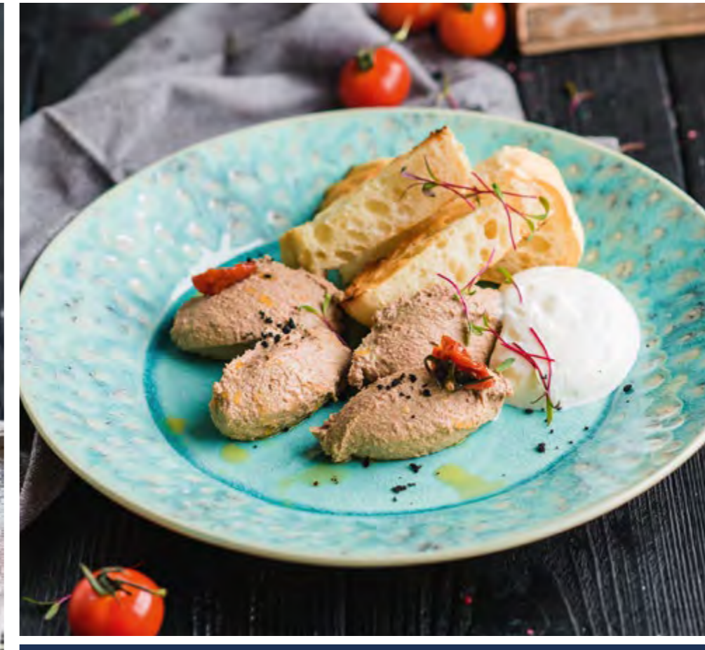
ПАШТЕТ ИЗ КУРИНОЙ ПЕЧЕНИ СО СЛИВОЧНЫМ МУССОМ CHICKEN LIVER PATE WITH CREAM MOUSSE