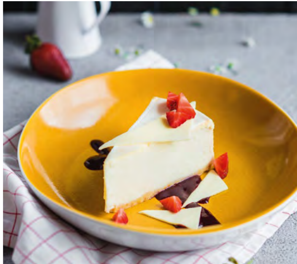
ЧИЗКЕЙК С ЯГОДНЫМ СОУСОМ И БЕЛЫМ ШОКОЛАДОМ CHEESE CAKE WITH BERRY SAUCE AND WHITE CHOCOLATE