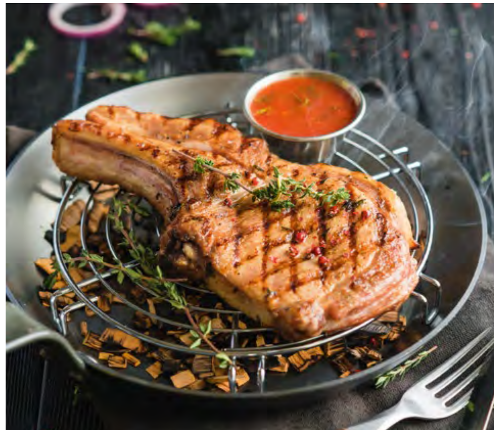
ДЕРЕВЕНСКАЯ СВИНИНА НА КОСТИ | 580 COUNTRY PORK ON THE BONE |