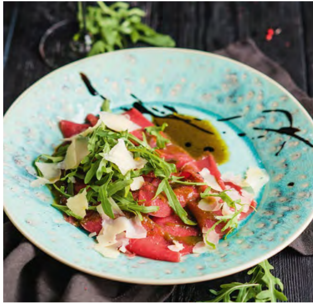
КАРПАЧО ИЗ ГОВЯДИНЫ BEEF CARPACCIO