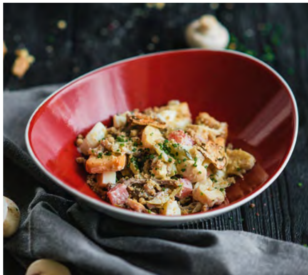
ДЕРВИШ | 440 DERVISH Нежный говяжий язык, маринованные огурцы, шампиньоны, томаты с белыми гренками, заправляется домашним майонезом Tender beef tongue, marinated cucumbers, field mushrooms, tomatoes with wheat croutons, dressed with homemade mayonnaise