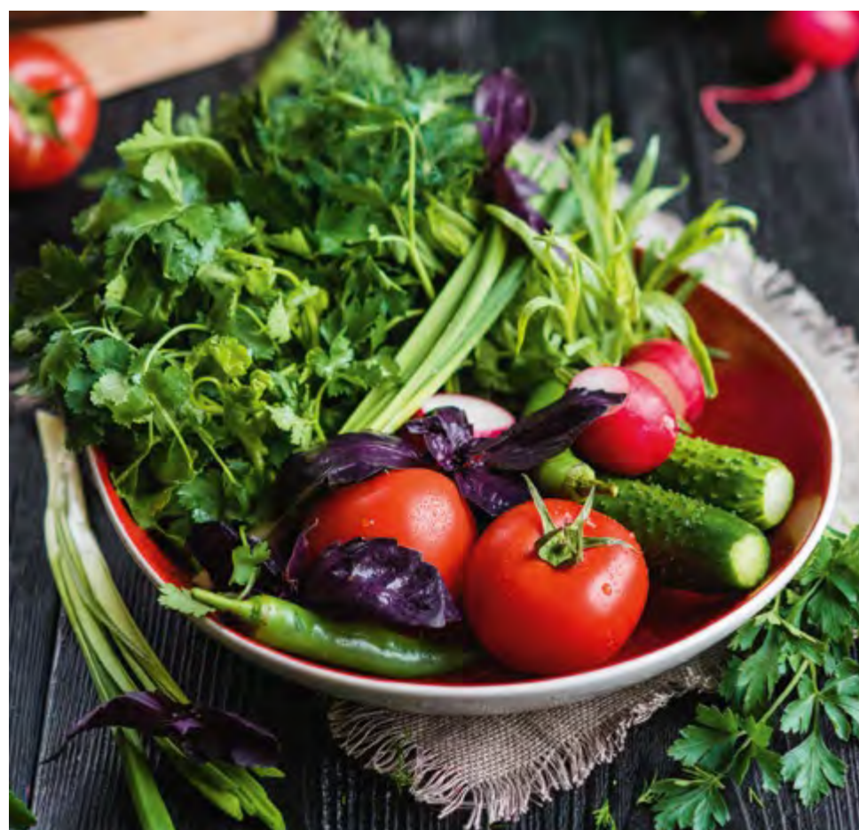
СЕЗОННЫЕ ОВОЩИ И ЗЕЛЕНЬ SEASONAL VEGETABLES AND GREENS