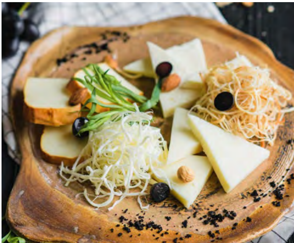
АССОРТИ ГРУЗИНСКИХ СЫРОВ ASSORTED GEORGIAN CHEESE

Сулугуни, сулугуни копченый, домашний сыр, «косичка» чечил молочная и копченая