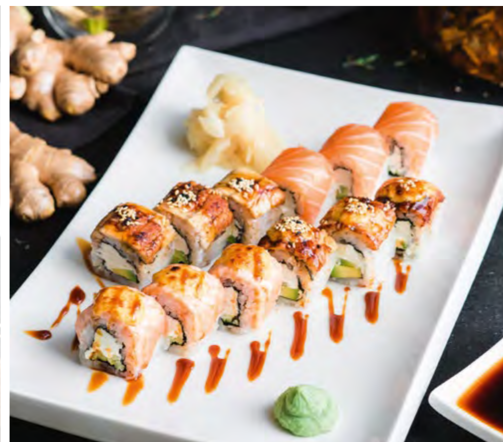
РОЛЛ СЕТ ФИЛАДЕЛЬФИЯ PHILADELPHIA ROLL SET