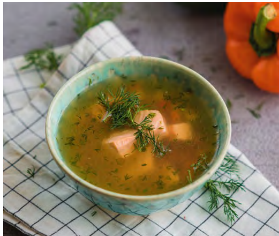
БАЛЫК ШУРПА BALYK SHURPA

Легкий суп с лососем, судаком и овощами Light soup with salmon, pike perch and vegetables