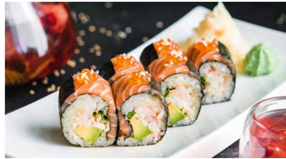
РОЛЛ ДЖУСТО JUSTO ROLL