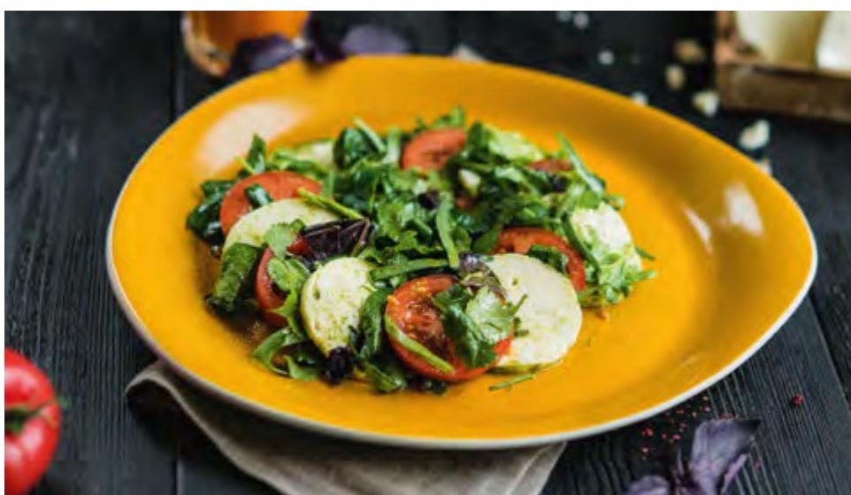
КВЕЛИ С ТОМАТАМИ | 490 KWELI WITH TOMATOES