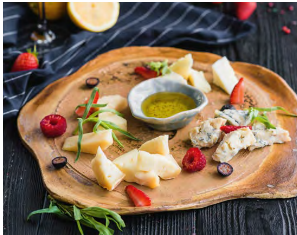
АССОРТИ ЕВРОПЕЙСКИХ СЫРОВ С МЁДОМ ASSORTED EUROPEAN CHEESE WITH HONEY

Пекорино, таледжио, горгонзола, грана падано