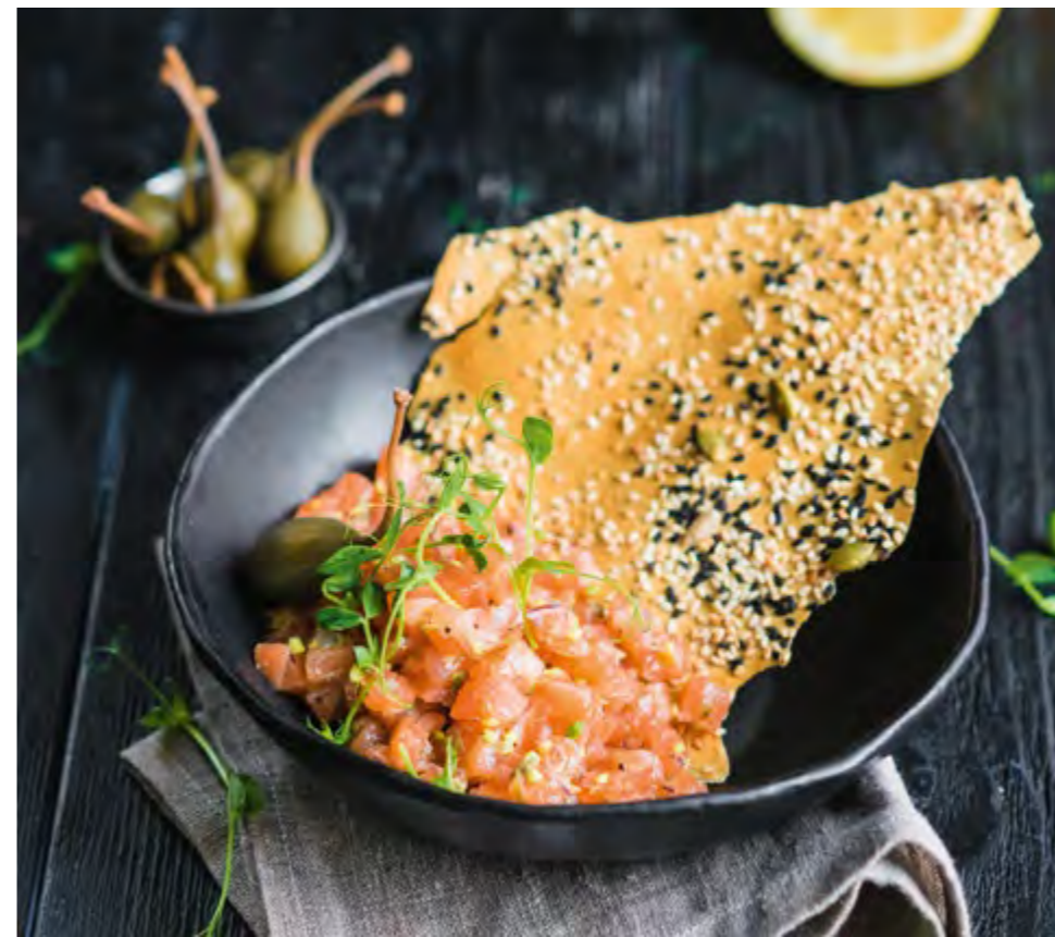
ТАРТАР ИЗ ЛОСОЯ С ПШЕНИЧНЫМИ ЧИПСАМИ SALMON TARTARE WITH WHEAT CHIPS