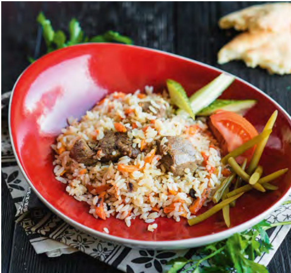
ПЛОВ УЗБЕКСКИЙ UZBEK PILAF