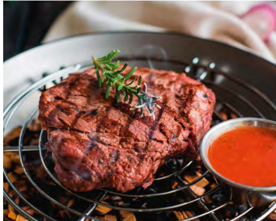
ВЫРЕЗКА ИЗ ФЕРМЕРСКОЙ ГОВЯДИНЫ | 860 FARM-RAISED BEEF TENDERLOIN |