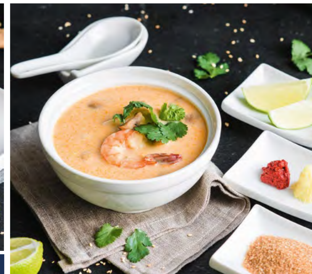
ТОМ ЯМ С РИСОМ TOM YUM WITH RICE

КЛАССИЧЕСКИЕ 440 С КРАБОМ 590 CLASSIC WITH CRAB