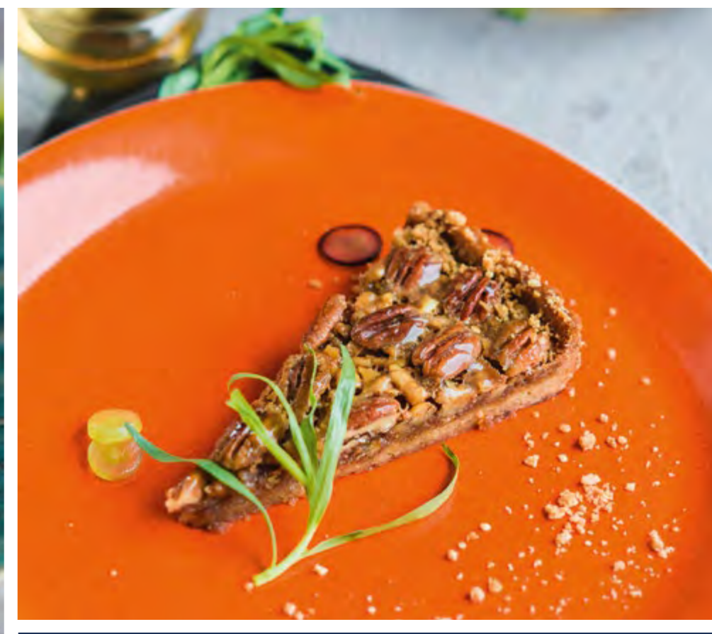
ПАЙ ПЕКАН PECAN PIE Песочное тесто, пропитанное кленовым сиропом, с карамелизированным грецким орехом и орехом пекан

Short pastry, impregnated with maple syrup, with caramelized walnuts and pecan