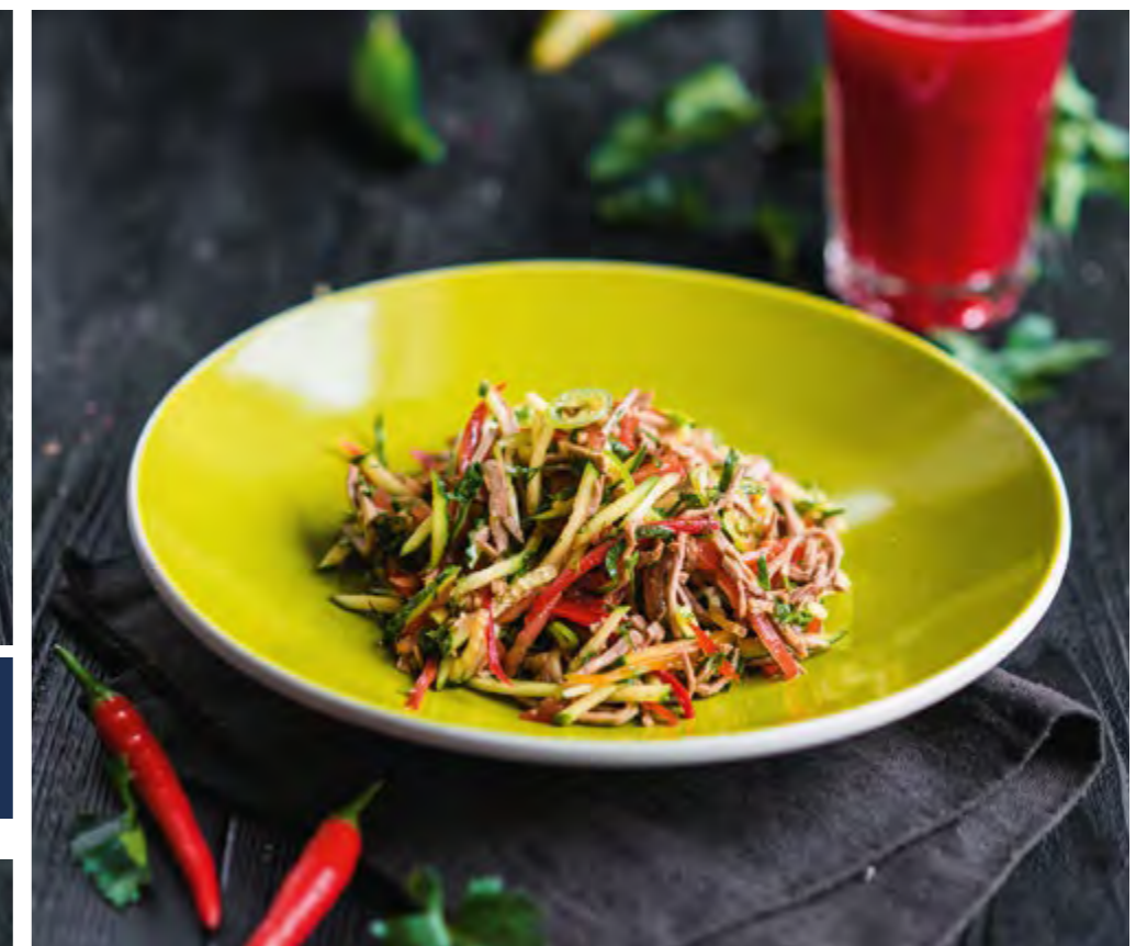
САЛАТ ЯНГИЛИК | 410 YANGILIK SALAD Телятина, болгарский перец, томаты и огурцы, заправляется легким соевым соусом и оливковым маслом Veal, bell pepper, tomatoes and cucumbers, dressed with light soy sauce and olive oil