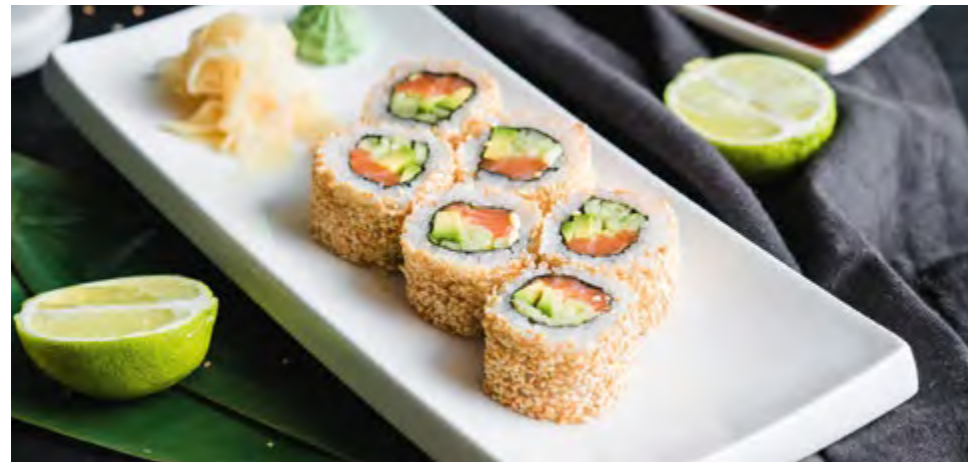
РОЛЛ АЛЯСКА ALASKA ROLL