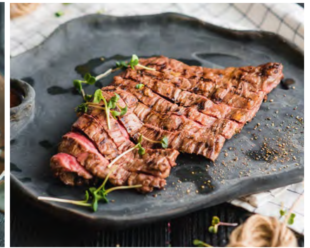
МАЧЕТЕ | 950 SKIRT STEAK |