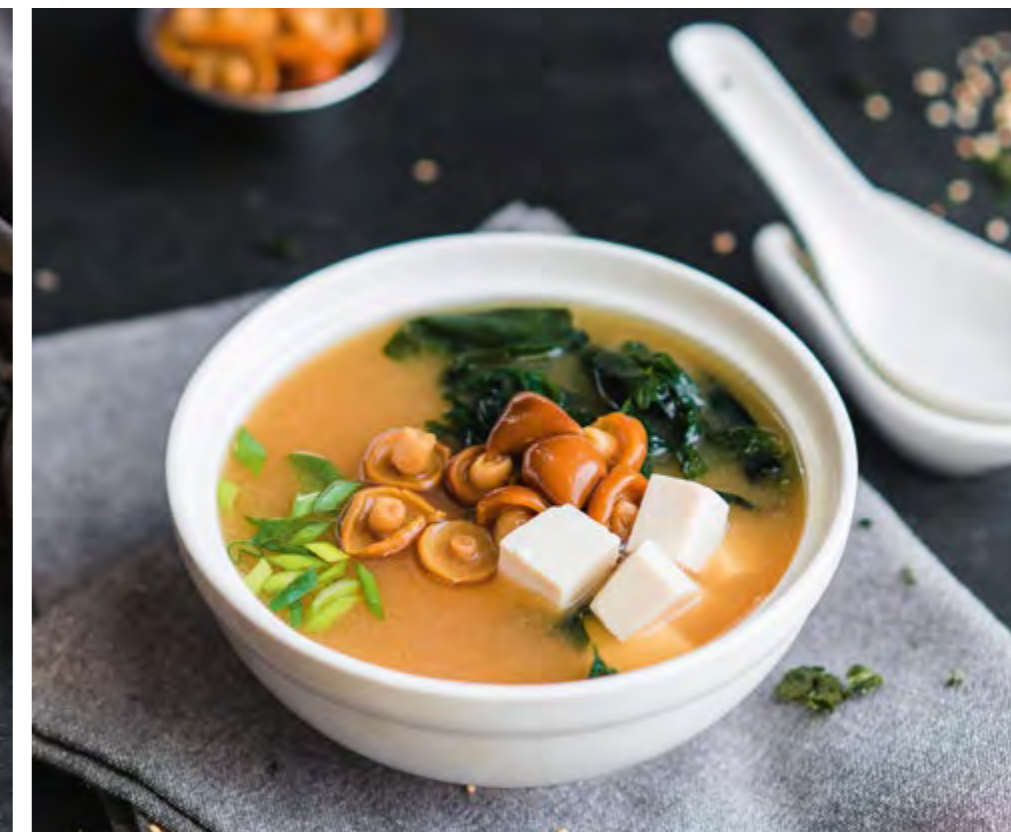
МИСО СУП | MISO SOUP

КЛАССИЧЕСКИЙ 330 С КРАБОМ 440 CLASSIC WITH CRAB