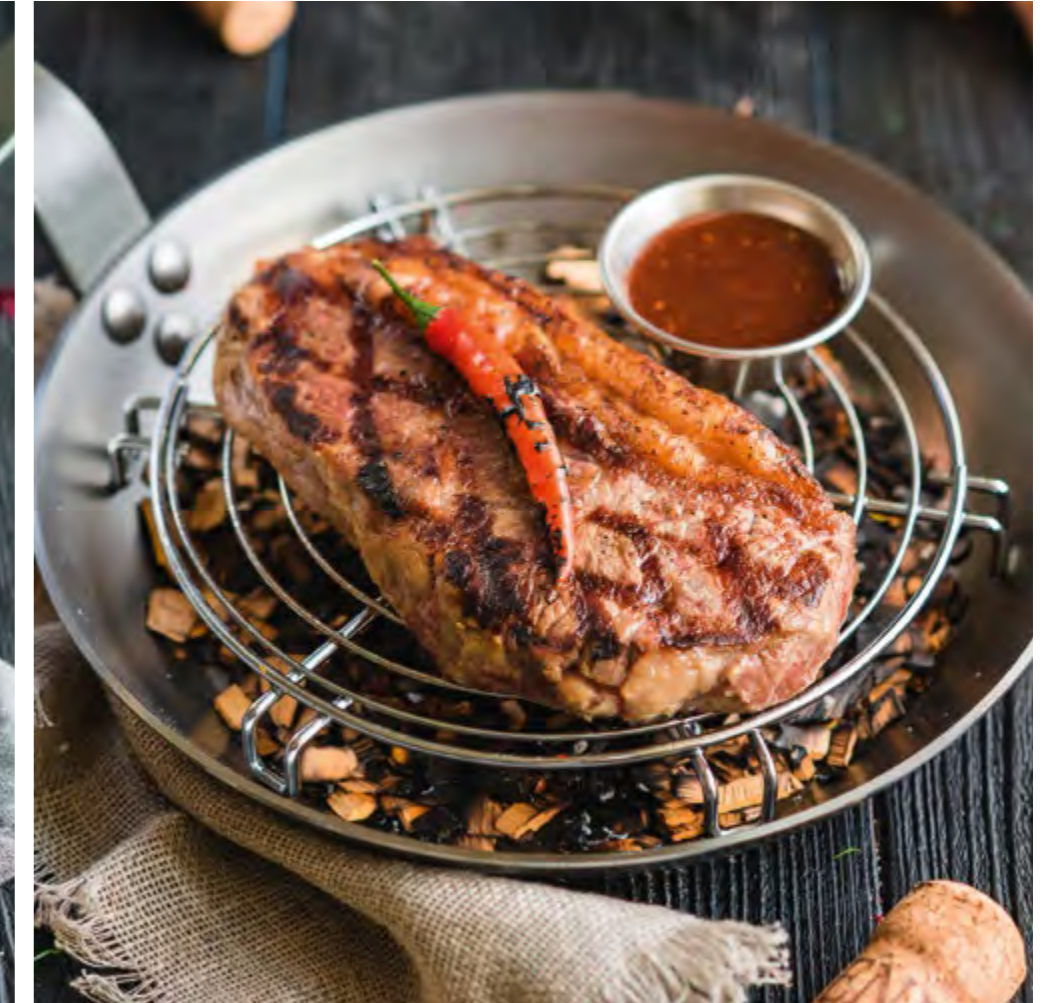
СТРИПЛОЙН | 1650 STRIPLOIN |