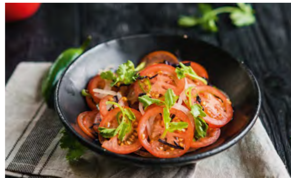
САЛАТ АЧИК-ЧУК | 370 ACHIK-CHUK SALAD