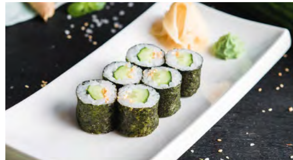
РОЛЛ ОГУРЕЦ / АВОКАДО CUCUMBER / AVOCADO ROLL