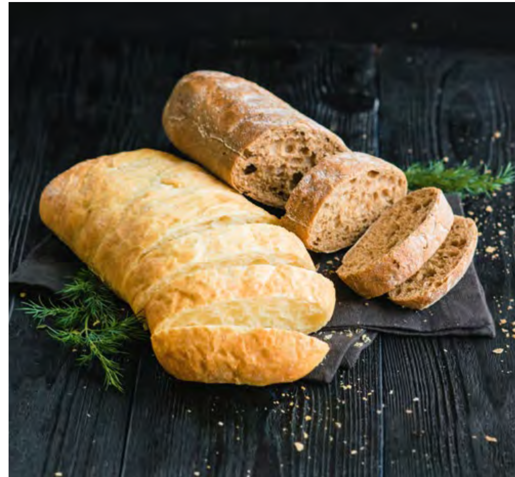
ХЛЕБНАЯ КОРЗИНА С ЧАККИ BREAD BASKET WITH CHAKKI