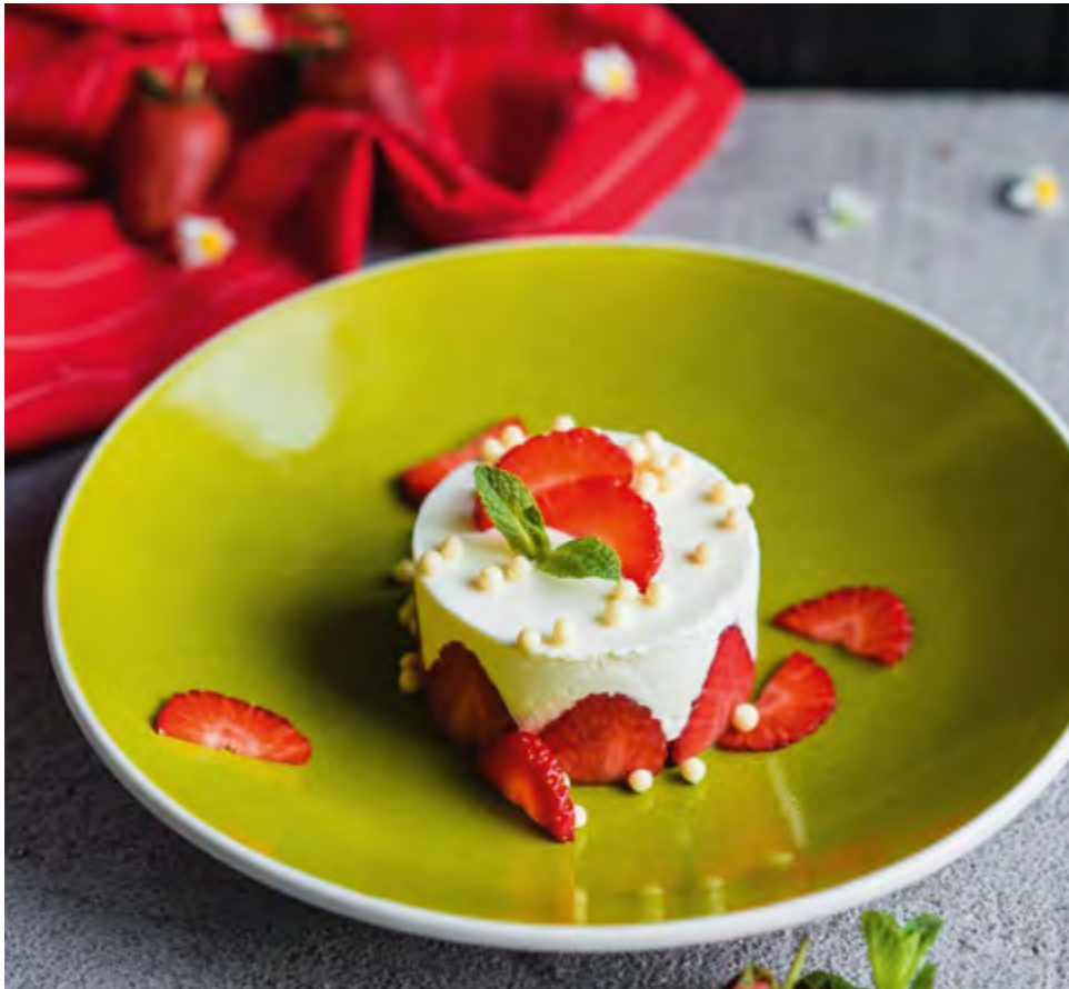
ДОМАШНИЙ СМЕТАННИК С КЛУБНИКОЙ HOMEMADE SOUR CREAM CAKE WITH STRAWBERRY