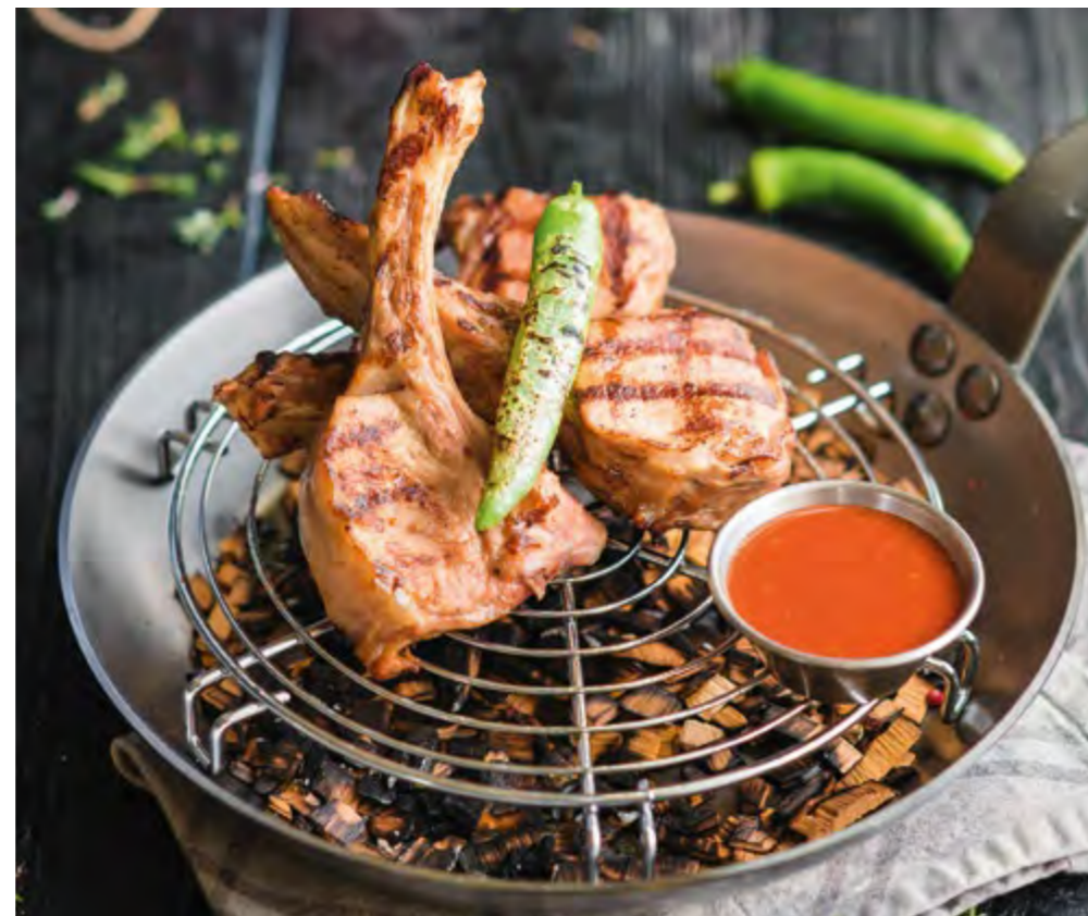
КОРЕЙКА МОЛОДОГО БЫЧКА | 870 YOUNG BULL LOIN |