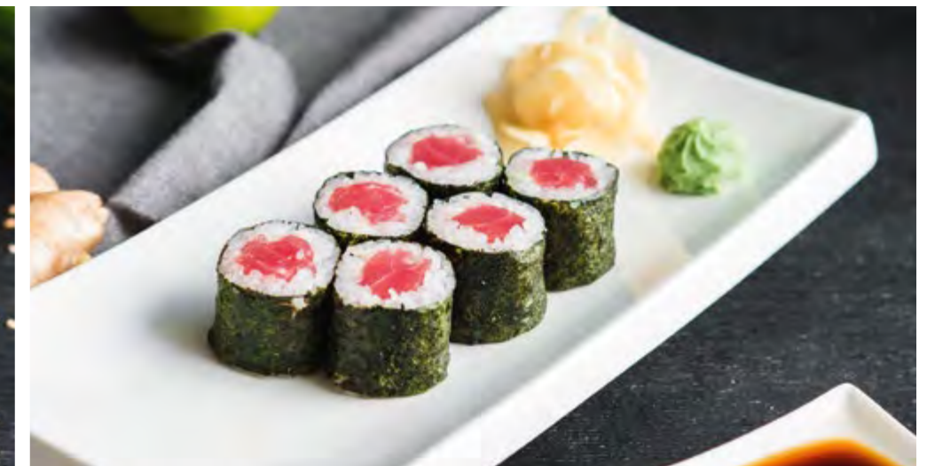
РОЛЛ ТУНЕЦ / УГОРЬ / ЛОСОСЬ TUNA / EEL / SALMON ROLL