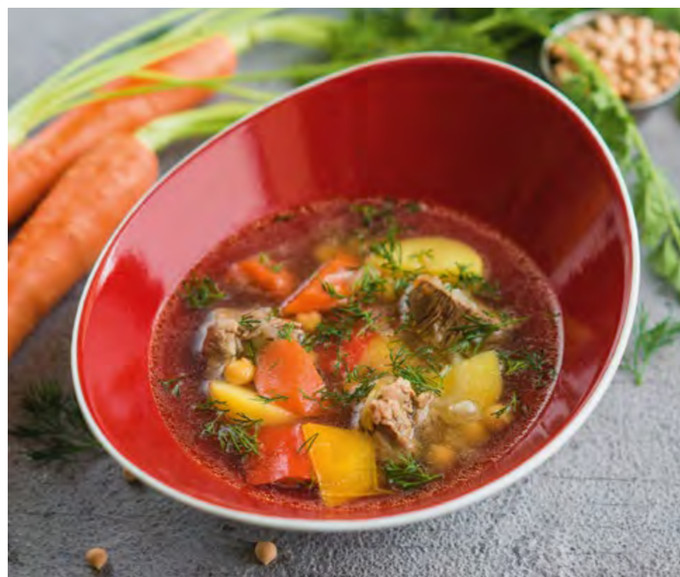
КАЙНАТМА ШУРПА KAYNATMA SHURPA

Бульон с бараниной, овощами, горохом нут и узбекскими специями