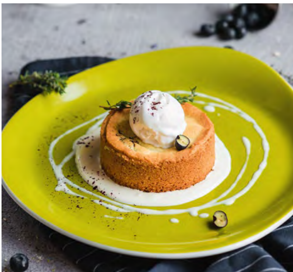
ЧЕРНИЧНЫЙ ПИРОГ С КОКОСОВЫМ СОРБЕТОМ BLUEBERRY PIE WITH COCONUT SORBET