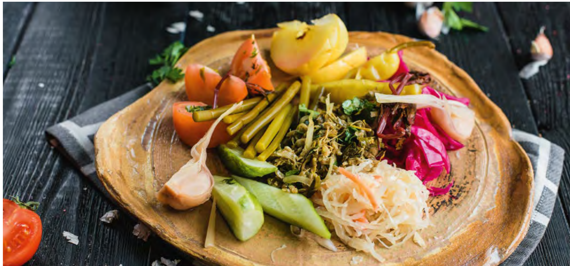
ДОМАШНИЕ СОЛЕНЬЯ HOMEMADE PICKLES

Квашеная капуста, яблоко моченое, красная капуста, огурцы малосольные, джонджоли, маринованные перец, чеснок, черемша, малосольные помидоры