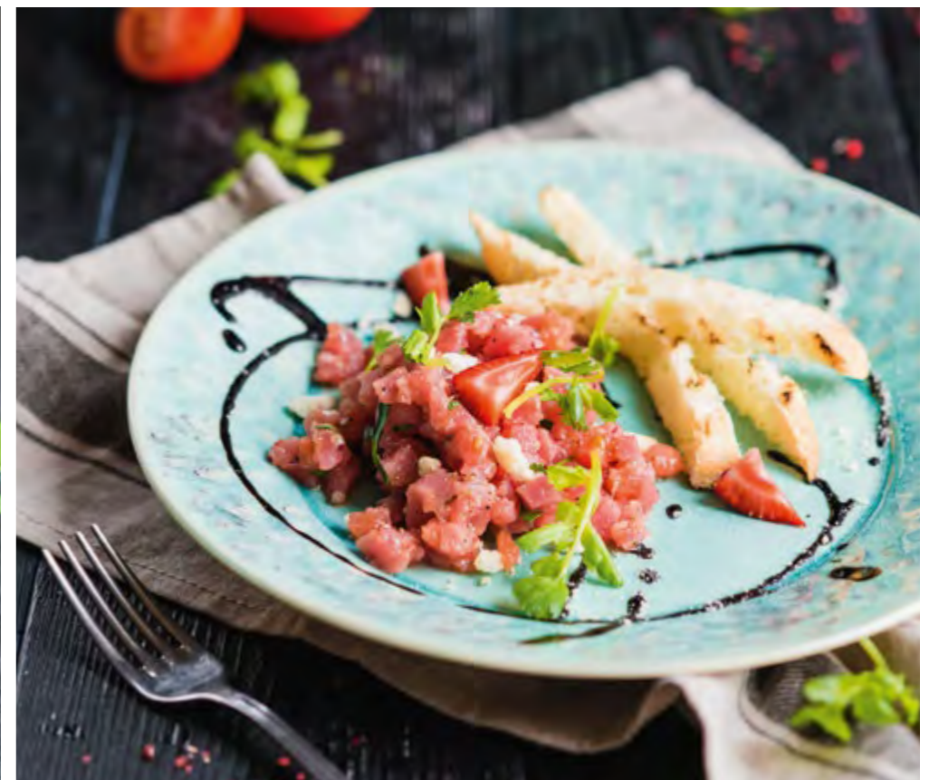
ТАРТАР ИЗ ТУНЦА С КЛУБНИКОЙ TUNA TARTARE WITH STRAWBERRY