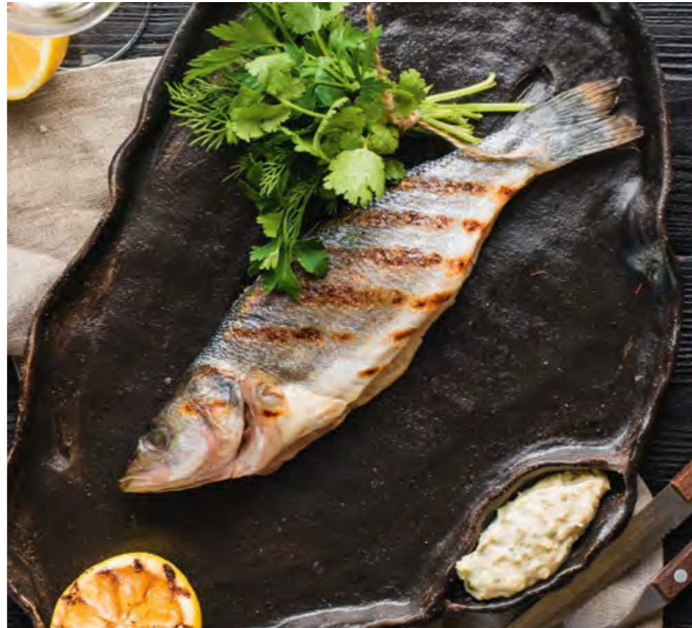
СИБАС / СРЕДИЗЕМНОМОРСКАЯ ДОРАДО НА ГРИЛЕ GRILLED SEA BASS / MEDITERRANEAN DORADO