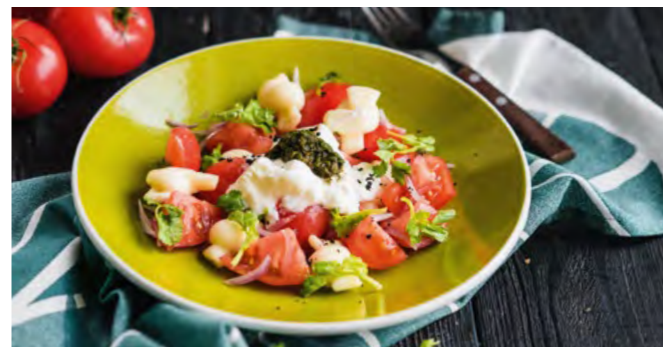
САЛАТ ИЗ СВЕЖИХ ТОМАТОВ С СОУСОМ МАЦОНИ И СЫРОМ СУЛУГУНИ | 490 SALAD MADE OF FRESH TOMATOES WITH FERMENTED MILK SAUCE AND SULUGUNI CHEESE