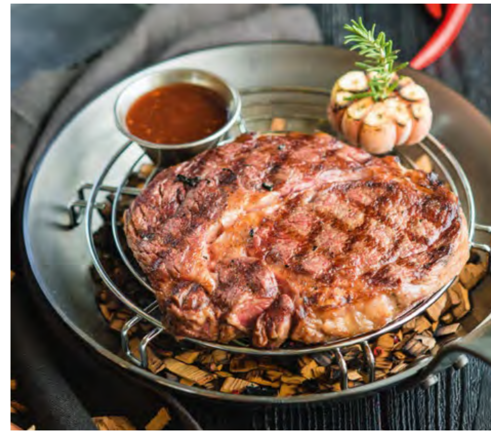
СТЕЙК РИБАЙ | 1720 RIBEYE STEAK |