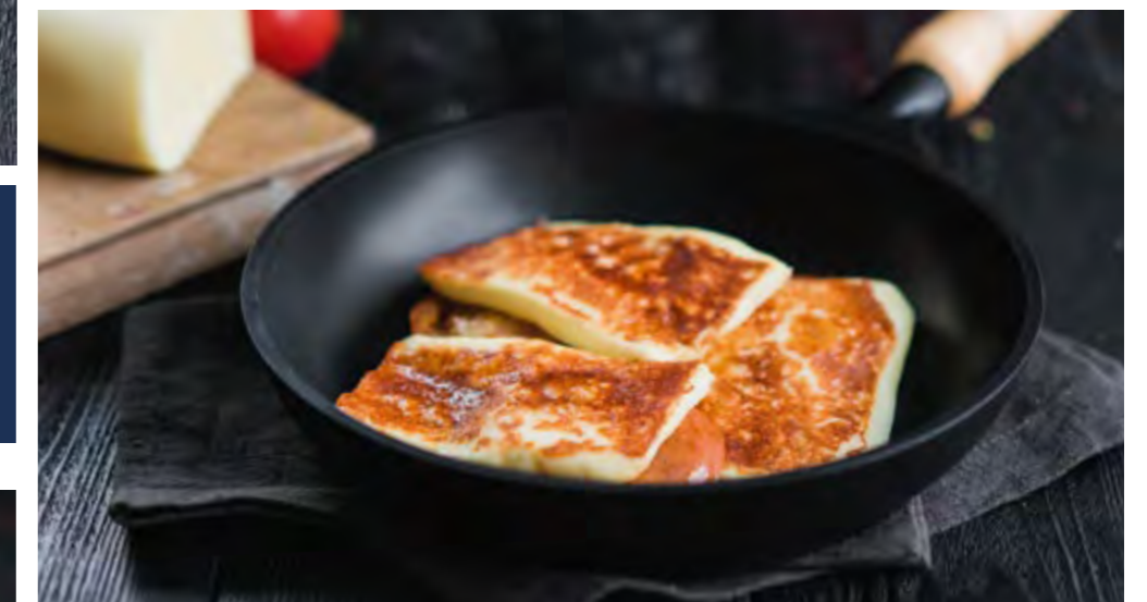
ЖАРЕННЫЙ СУЛУГУНИ С ТОМАТАМИ