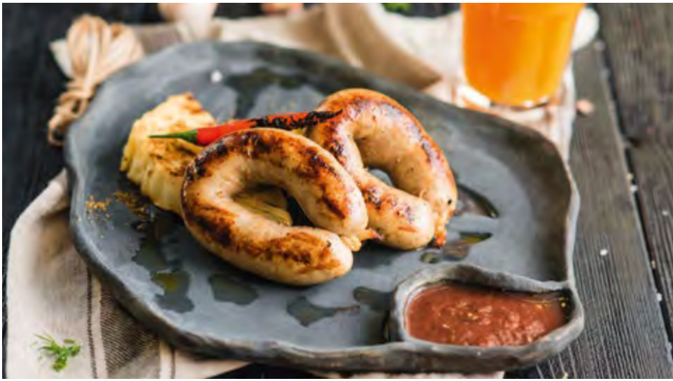
ДОМАШНИЕ КОЛБАСКИ ИЗ РУБЛЕНОГО ЦЫПЛЕНКА HOMEMADE SAUSAGES MADE OF CHOPPED CHICKEN