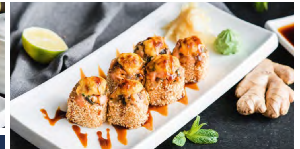
ЗАПЕЧЕННЫЙ МІХ BAKED MIX