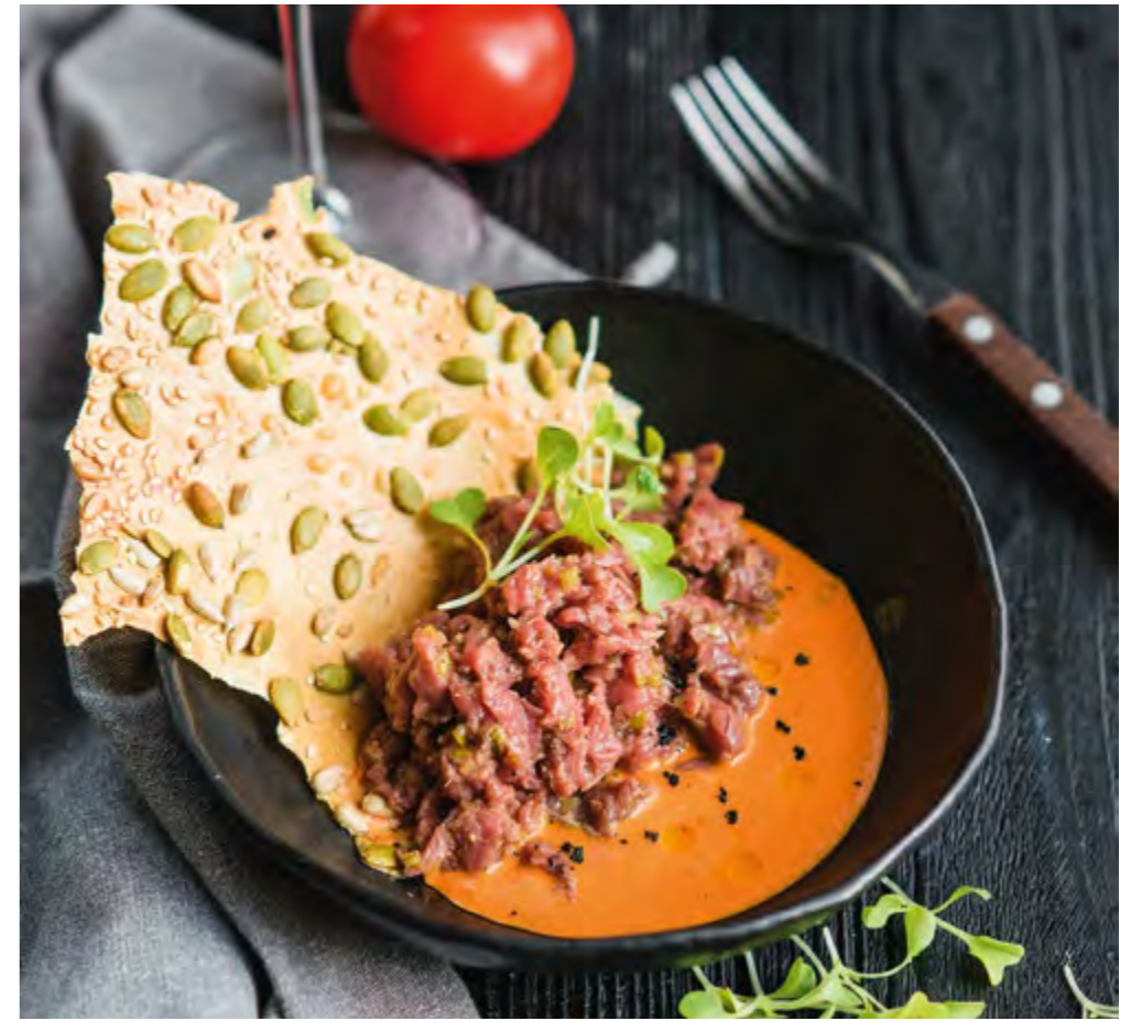
ТАРТАР ИЗ ГОВЯДИНЫ С СОУСОМ РОМЕСКО BEEF TARTARE WITH ROMESCO SAUCE