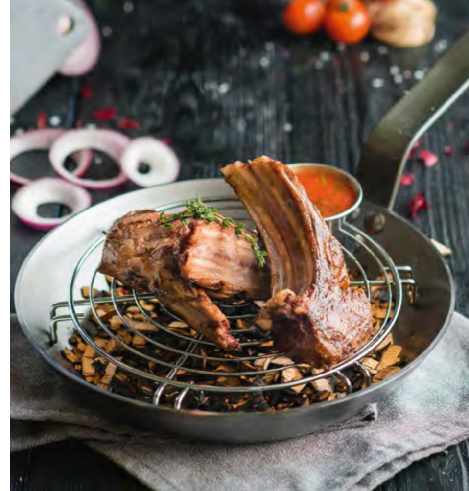
КАРЕ ЯГНЕНКА | 710 RACK OF LAMB |