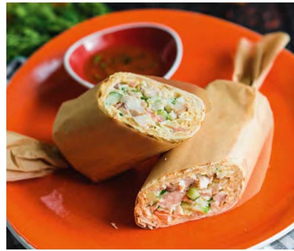
ДОМАШНЯЯ ШАВЕРМА С СОУСОМ САЦЕБЕЛИ

SHAWARMA IN HOME STYLE WITH SATSEBELI SAUCE