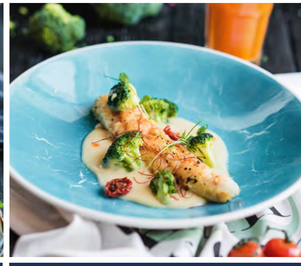
НОВОЗЕЛАНДСКАЯ КОНГРИО С БРОККОЛИ NEW ZEALAND CUSK-EEL WITH BROCCOLI