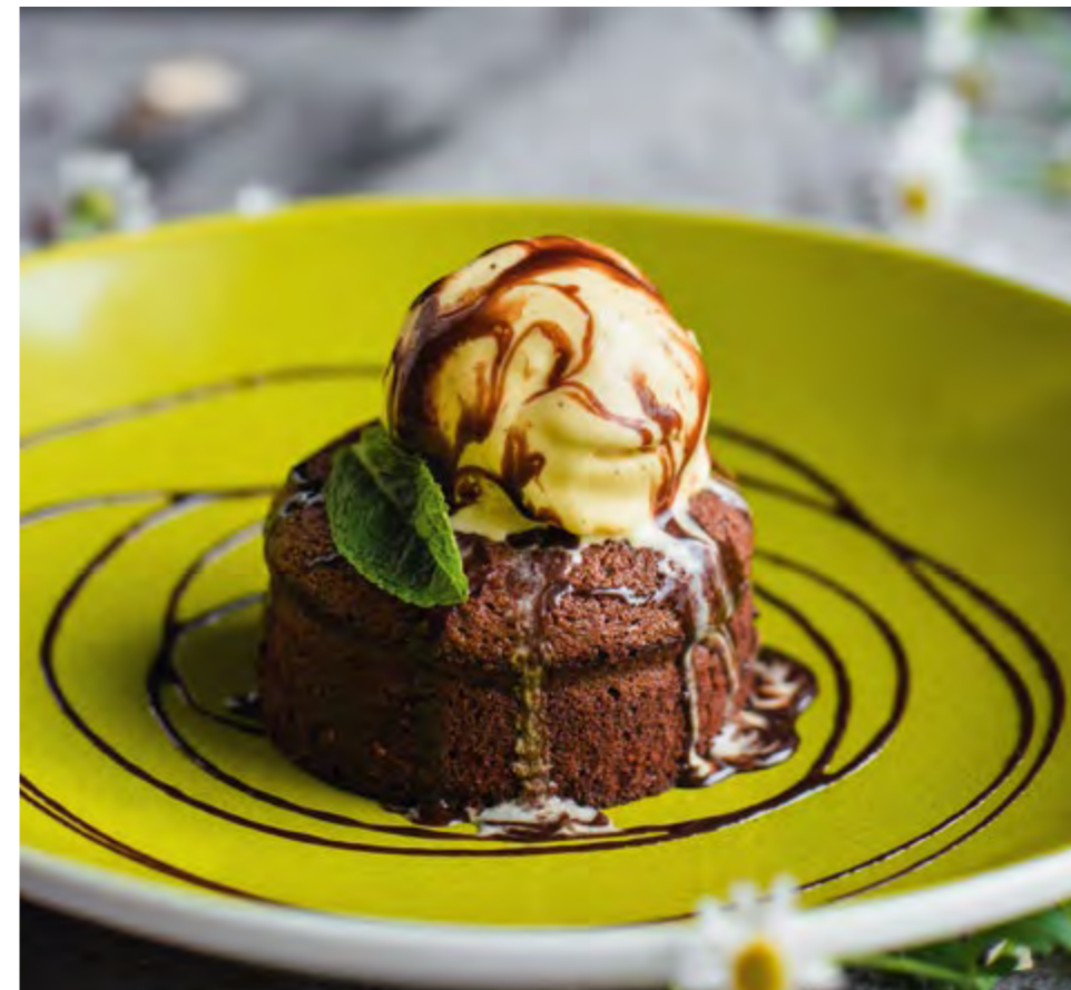
ШОКОЛАДНАЯ ШКАТУЛКА С ВАНИЛЬНЫМ МОРОЖЕНЫМ CHOCOLATE BOX WITH VANILLA ICE-CREAM