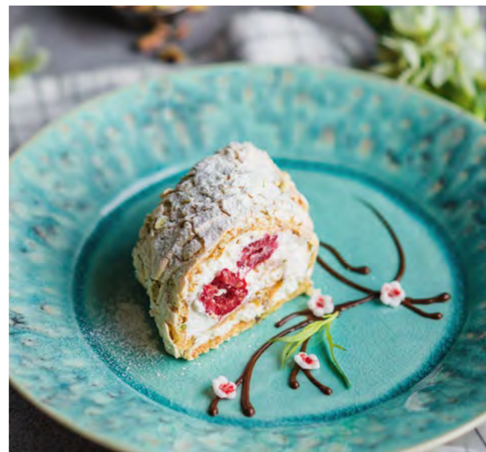
НЕЖНЫЙ ФИСТАШКОВЫЙ РУЛЕТ С МАЛИНОЙ TENDER PISTACHIO ROLL WITH RASPBERRY