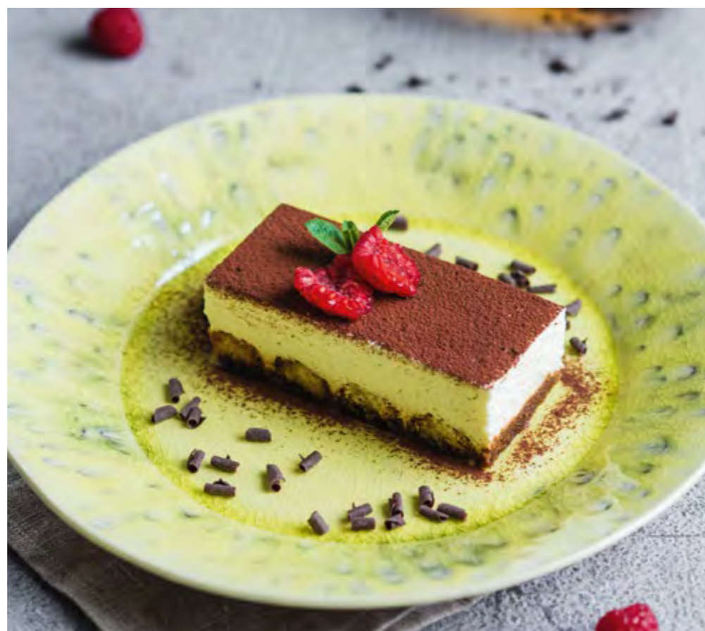
ТИРАМИСУ С СЫРОМ МАСКАРПОНЕ TIRAMISU WITH MASCARPONE CHEESE