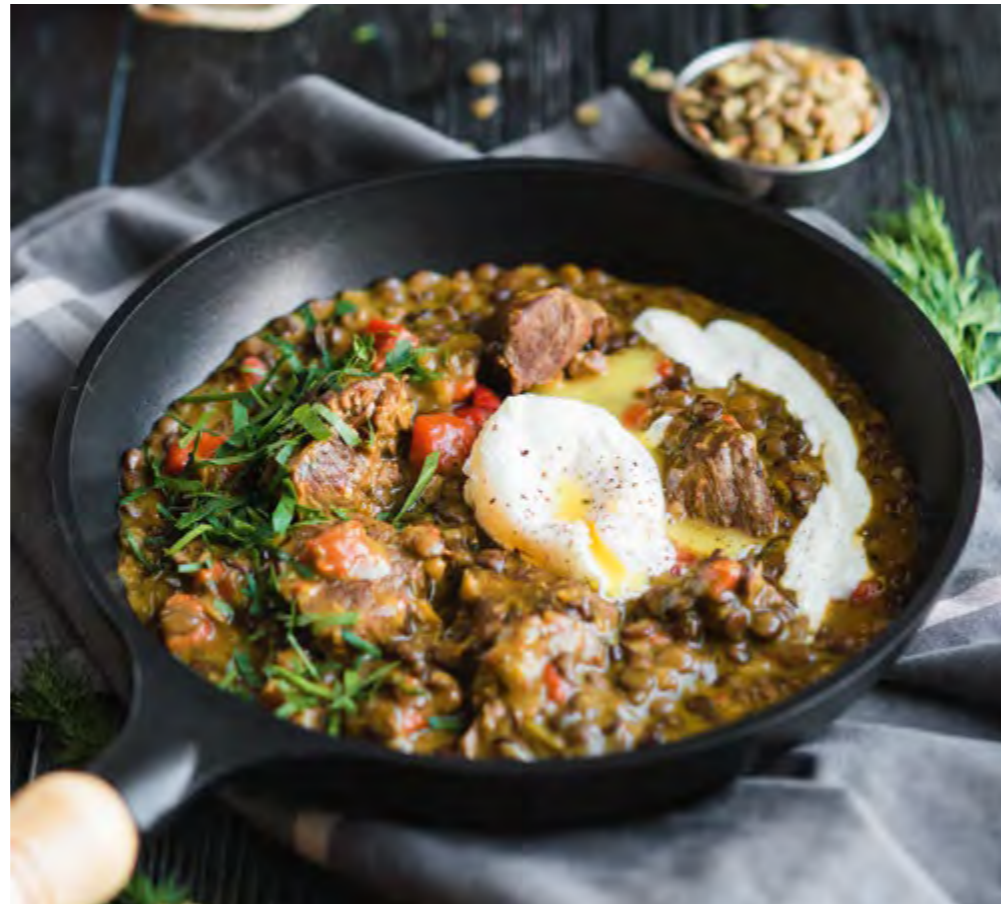
ТУШЕННЫЙ ЯГНЕНОК С ЧЕЧЕВИЦЕЙ И ЯЙЦОМ ПАШОТ STEWED LAMB WITH LENTILS AND POACHED EGG