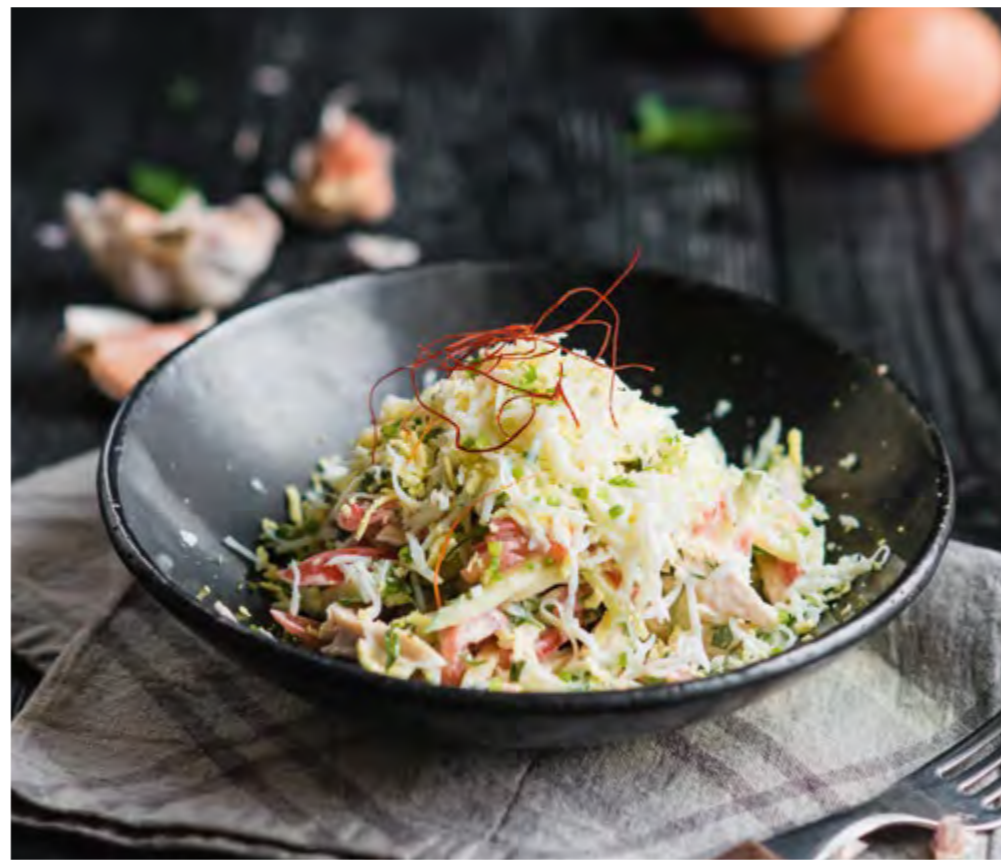
САЛАТ БАХОР | 380 BAKHOR SALAD Куриное филе, томаты, огурцы и отварное яйцо, заправляется домашним майонезом с чесноком и кинзой Chicken fillet, tomatoes, cucumbers and boiled egg, dressed with homemade mayonnaise with garlic and coriander leaves