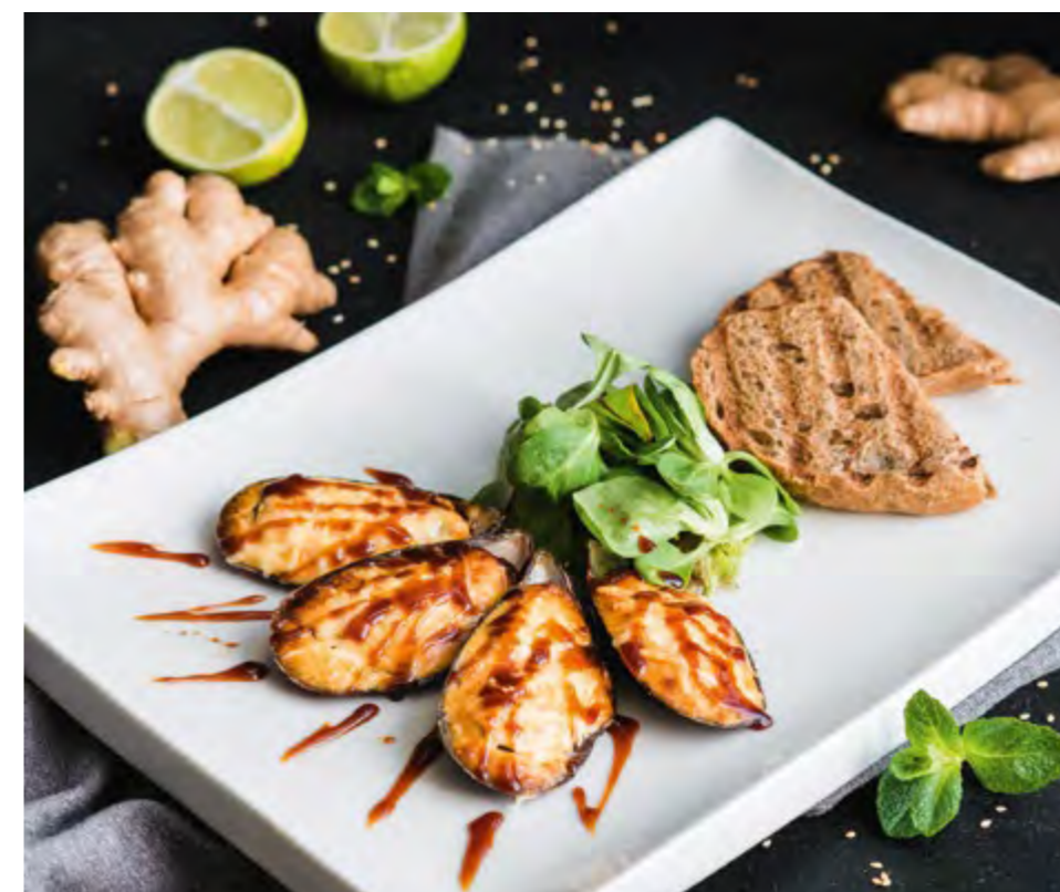
ЗАПЕЧЕННЫЕ МИДИИ | BAKED MUSSELS

КЛАССИЧЕСКИЕ 440 С КРАБОМ 590 CLASSIC WITH CRAB