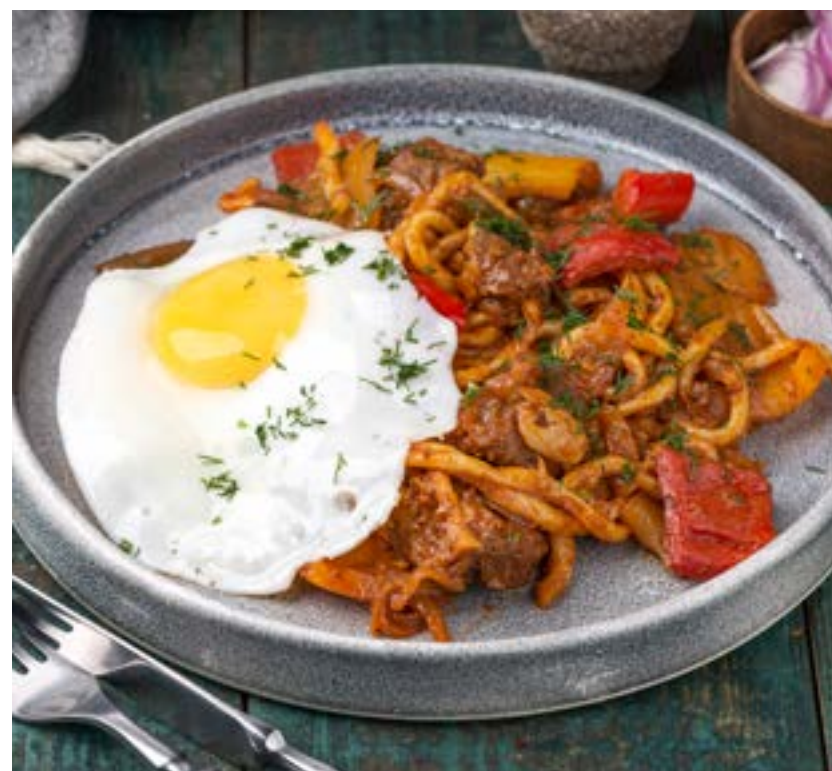
КОВУРМА ЛАГМАН 340/20 г 520 ₺

Домашняя лапша, обжаренная с мясом ягненка, специями и овощами. Подается с яичницей-глазуньей и узбекской аджикой