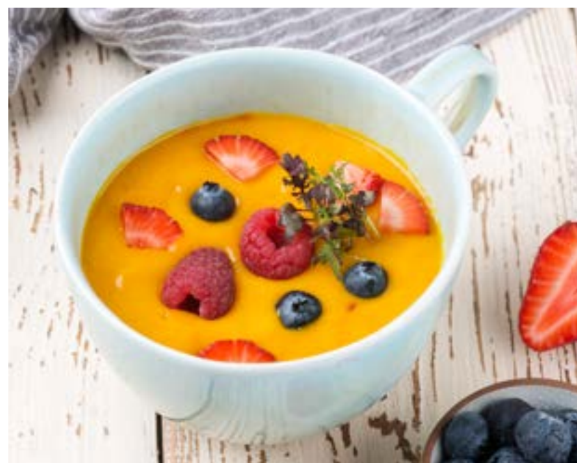
СМУЗИ С СЕМЕНАМИ ЧИА И СЕЗОННЫМИ ФРУКТАМИ 170 г 320 ₺ SMOOTHIE WITH CHIA SEEDS AND FRUITS IN SEASON