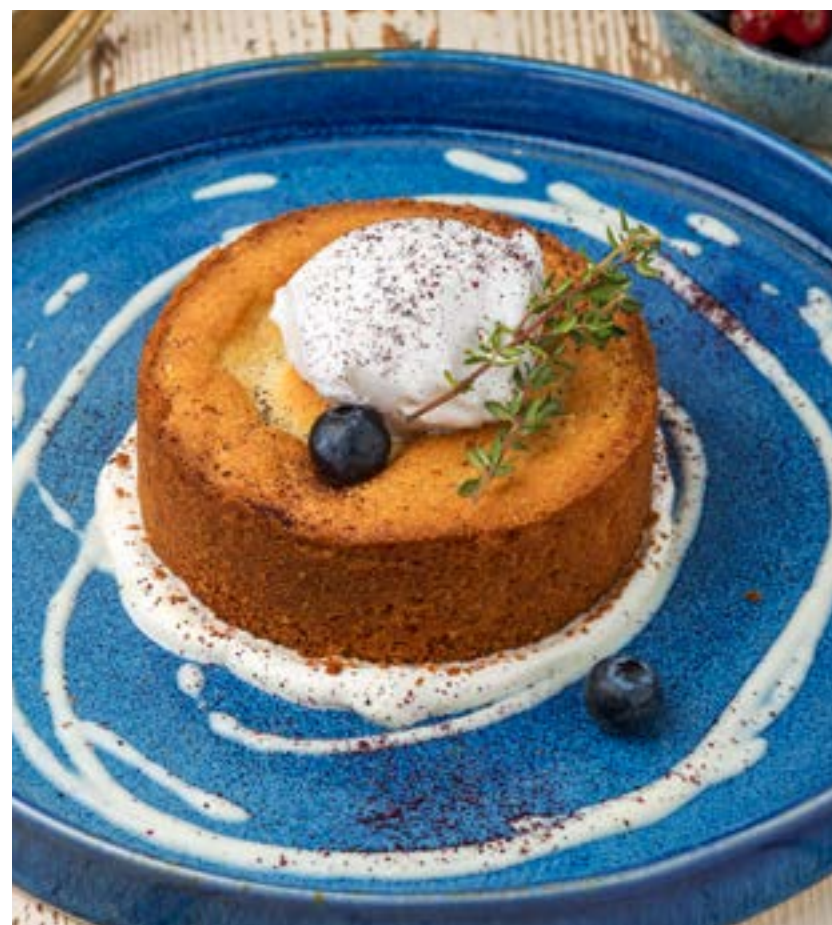
ЧЕРНИЧНЫЙ ПИРОГ С КОКОСОВЫМ СОРБЕТОМ