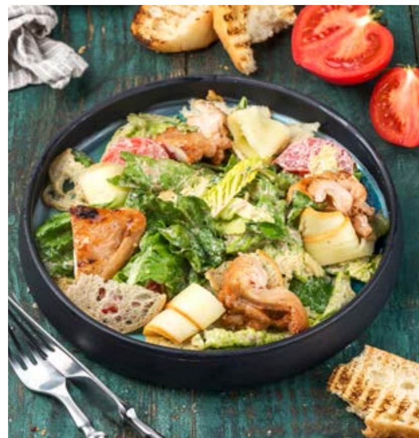
ТЕПЛЫЙ САЛАТ С КУРИЦЕЙ И КОПЧЕНЫМ СЫРОМ СУЛУГУНИ