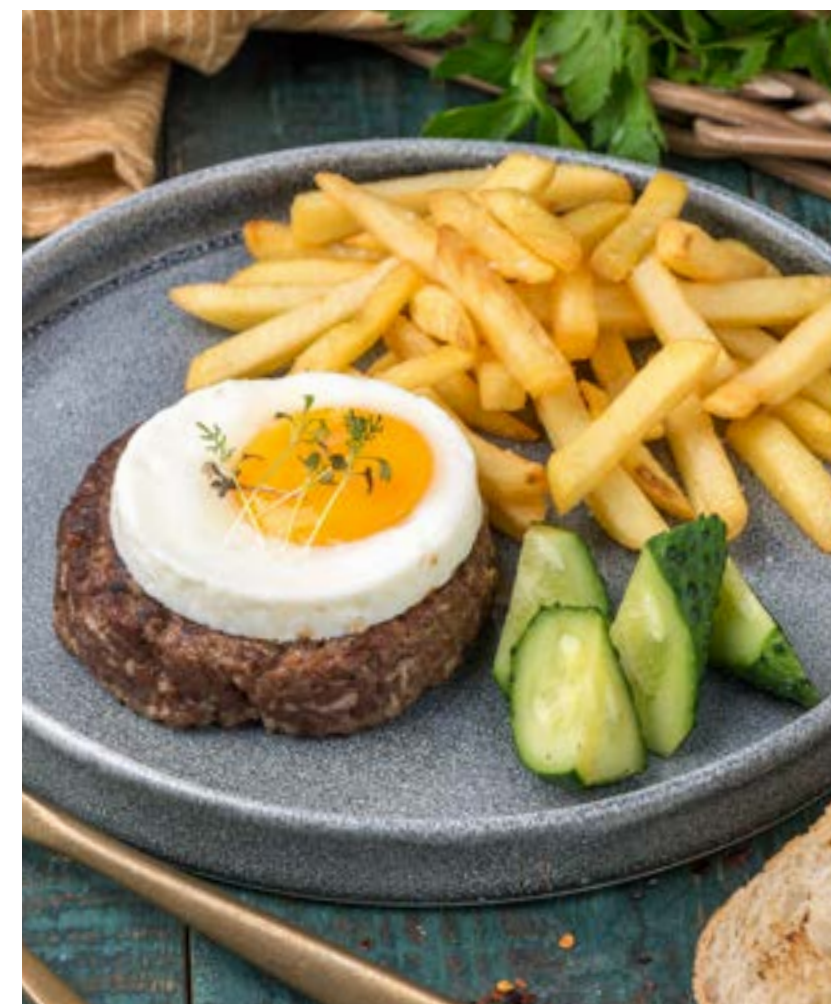
БИФСТЕК ИЗ РУБЛЕННОЙ БАРАНИНЫ 360 г 690 ₺ CHOPPED LAMB STEAK