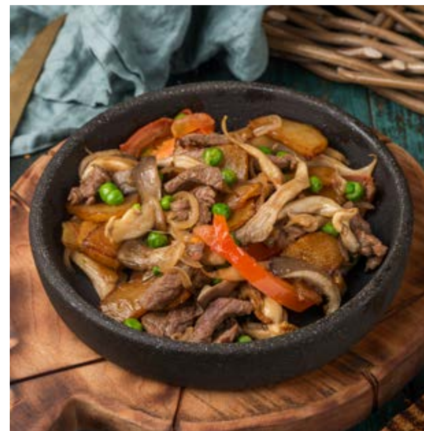
КЕРУСУС С ГОВЯЖЬЕЙ ВЫРЕЗКОЙ 300 г 640 ₺

Говяжья вырезка с золотистым картофелем, лесными грибами и зеленым горошком