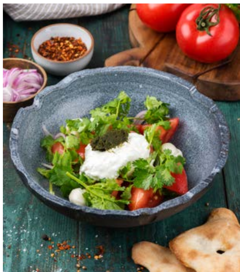
САЛАТ ИЗ РОЗОВЫХ ТОМАТОВ С СОУСОМ МАЦОНИ И АДЖИКОЙ 290 г 360 ₺

SALAD WITH PINK TOMATOES, MATSONI SAUCE AND ADJIKA