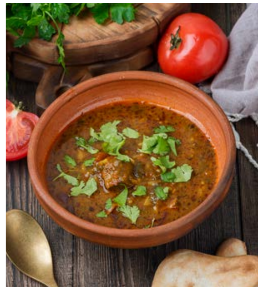
ХАРЧО С БАРАНИНОЙ