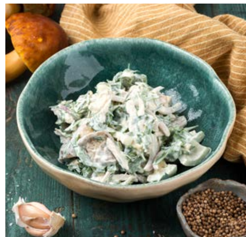
САЛАТ «СОКО» С КУРИЦЕЙ И ГРИБАМИ 170 г 360 ₺

Салат с куриной грудкой, маринованными грибами, рукколой, зеленью и яйцом, заправленный майонезом и сметаной