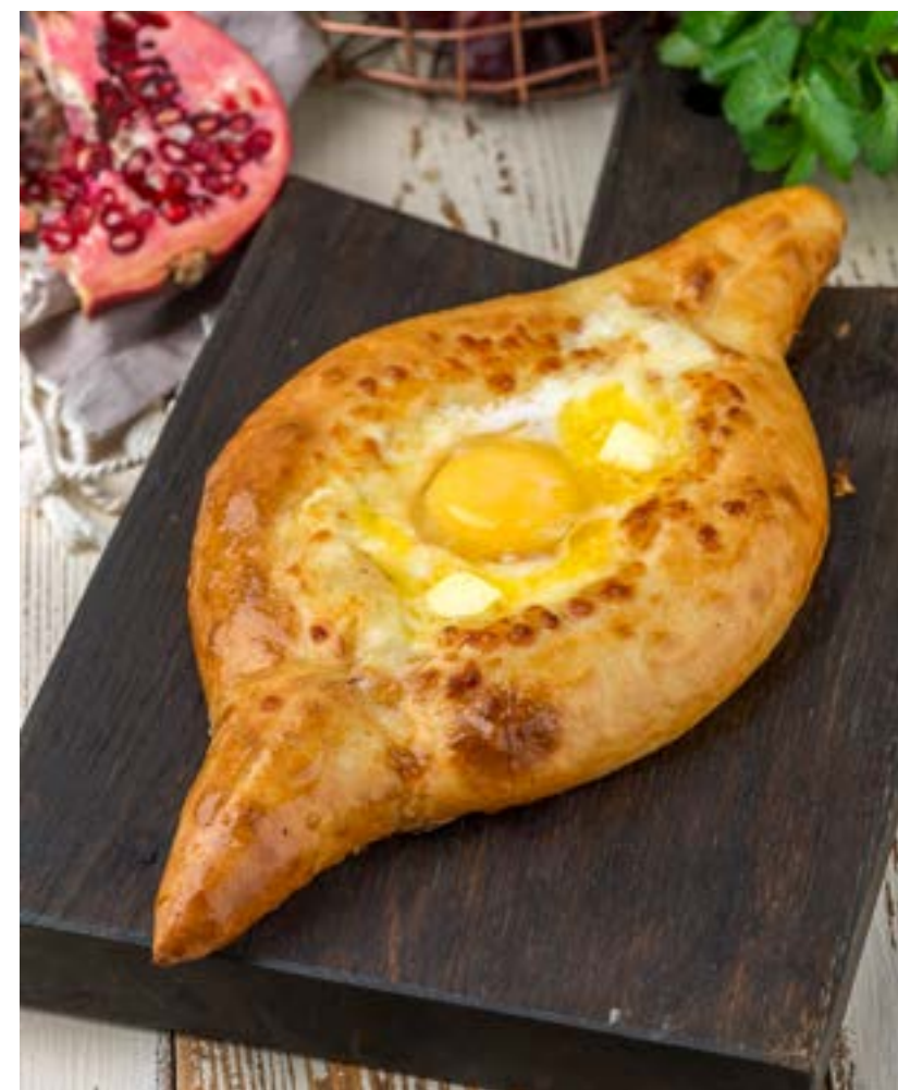
ХАЧАПУРИ ПО-АДЖАРСКИ 410 г 480 ₺ ADJARIAN STYLE KHACHAPURI