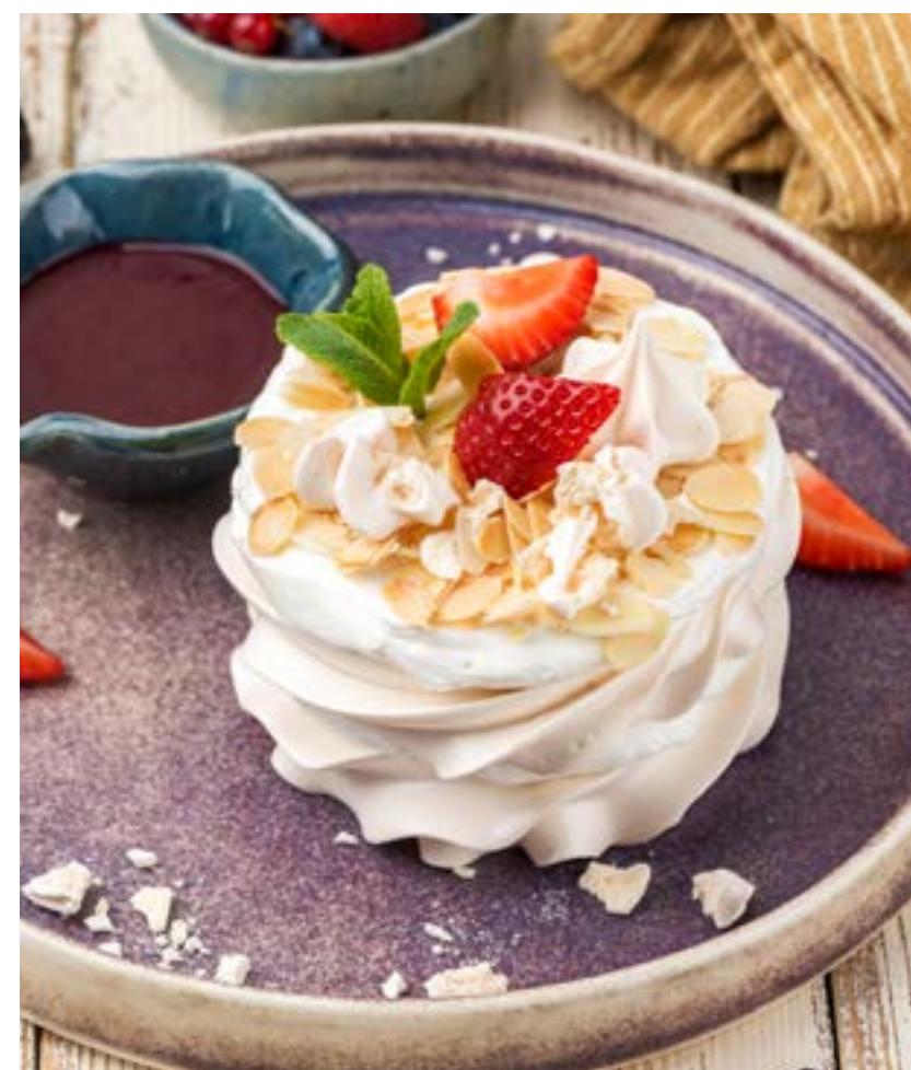
БЕЗЕ С ЯГОДНЫМ СОУСОМ