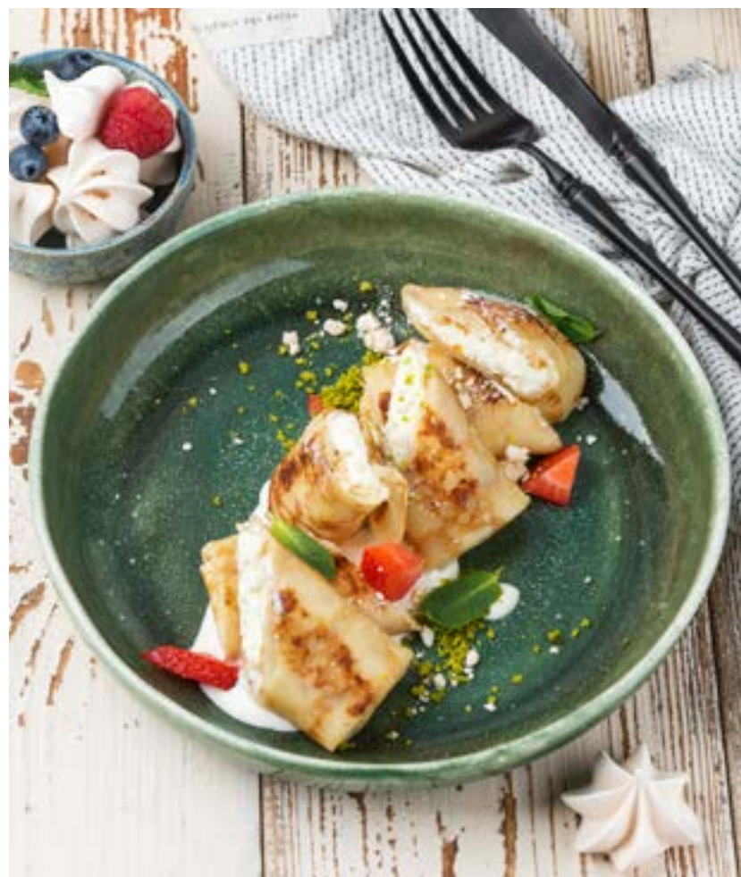
БЛИНЧИКИ С ТВОРОГОМ И ФИСТАШКОВОЙ КРОШКОЙ 160 г 290 ₺ PANCAKES STUFFED WITH COTTAGE CHEESE AND PISTACHIO CRUMBS