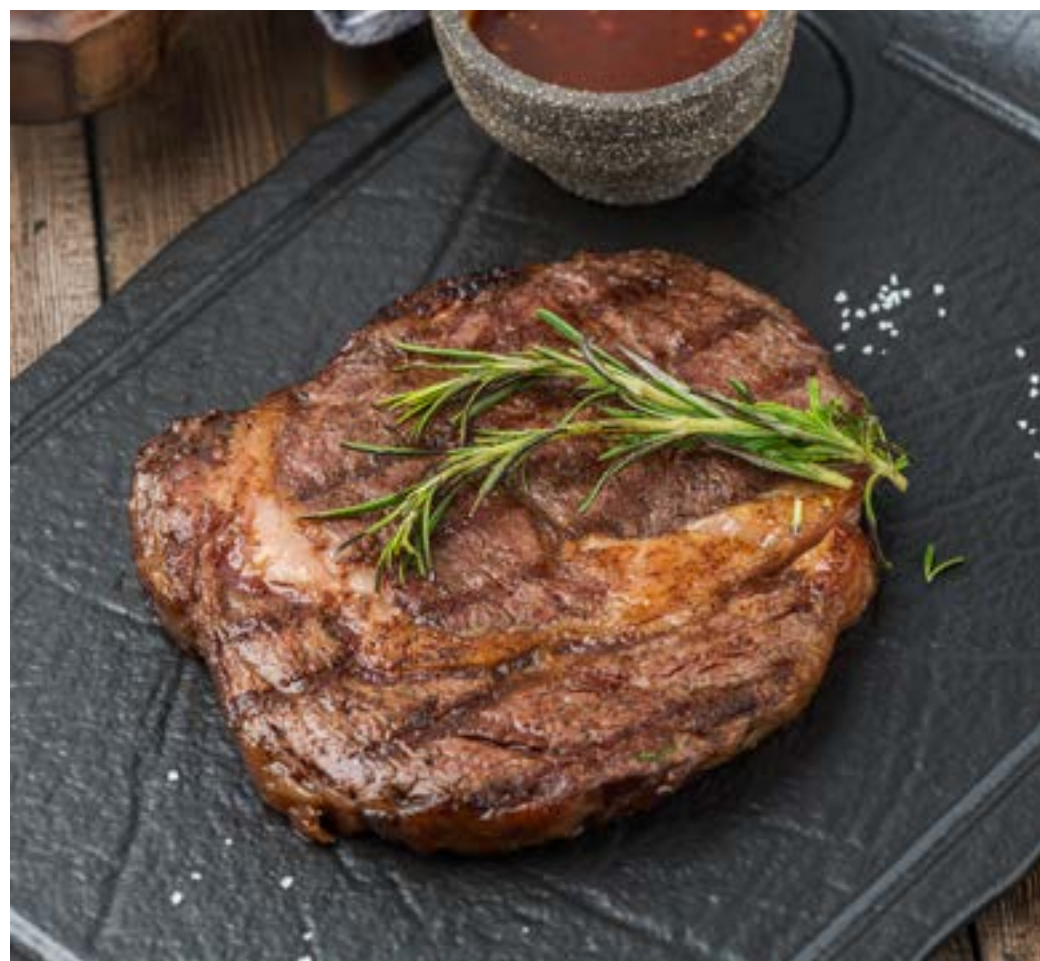
СТЕЙК РИБАЙ RIBEYE STEAK