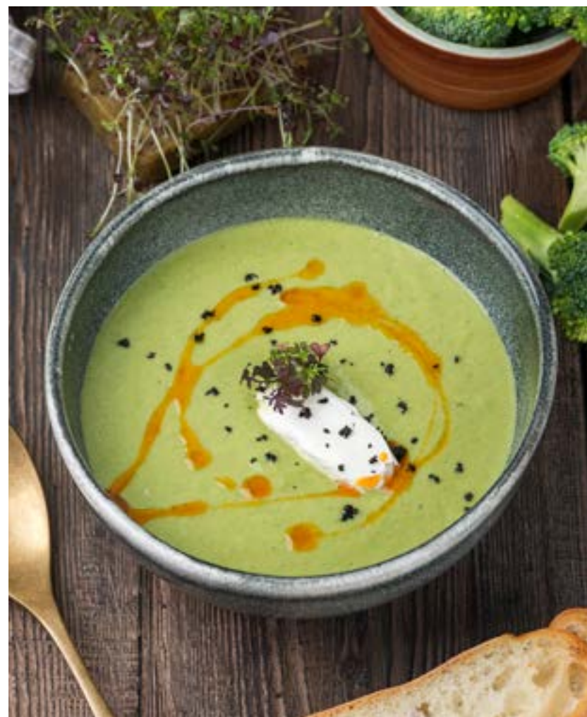
КРЕМ-СУП ИЗ БРОККОЛИ