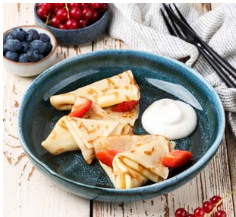
РУМЯНЫЕ БЛИНЧИКИ 120/30 г 160 ₺ GOLDEN PANCAKES