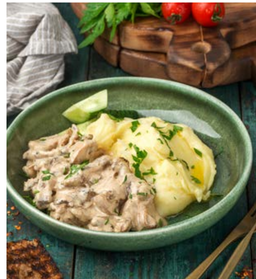
БЕФСТРОГАНОВ С ПЮРЕ И МАЛОСОЛЬНЫМИ ОГУРЧИКАМИ

Large Georgian dumpling with a variety of stuffing: pork and beef / veal / lamb / cheese / mushrooms