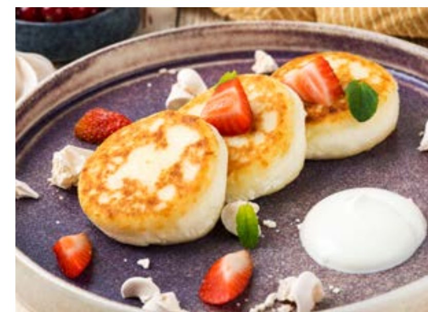
СЫРНИКИ С ВОЗДУШНОЙ МЕРЕНГОЙ И СВЕЖЕЙ КЛУБНИКОЙ 160/30 г 340 ₺ COTTAGE CHEESE PATTIES WITH AIRY MERINGUE AND FRESH STRAWBERRY