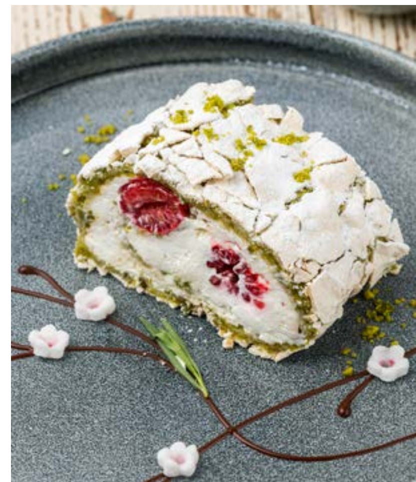
ФИСТАШКОВЫЙ РУЛЕТ С МАЛИНОЙ