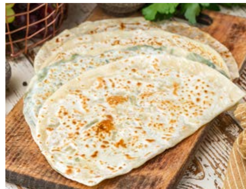
КУТАБЫ С КАРТОФЕЛЕМ 160/30 г 210 ₺