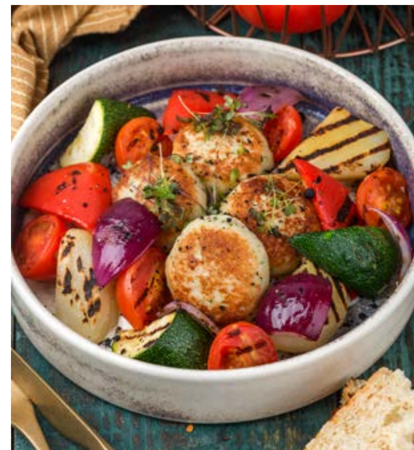
КОТЛЕТЫ ИЗ ИНДЕЙКИ С ОВОЩАМИ НА ГРИЛЕ 340 г 530 ₺ TURKEY PATTIES WITH GRILLED VEGETABLES