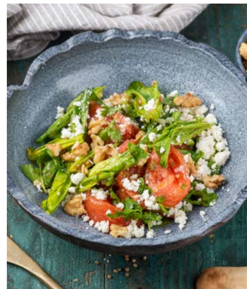
ОВОЩНОЙ САЛАТ С НАДУГИ 210 г 360 ₺

Salad with chicken breast, pickled mushrooms, arugula, herbs and egg, dressed with mayonnaise and sour cream