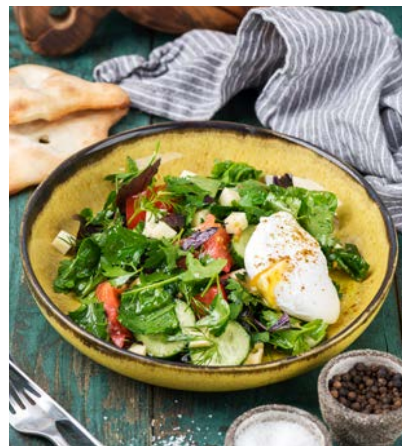
ОВОЩНОЙ САЛАТ С ДУШИСТОЙ ЗЕЛЕНЬЮ И ЯЙЦОМ ПАШОТ 225 г 340 ₺

VEGETABLE SALAD WITH FRAGRANT HERBS AND POACHED EGG