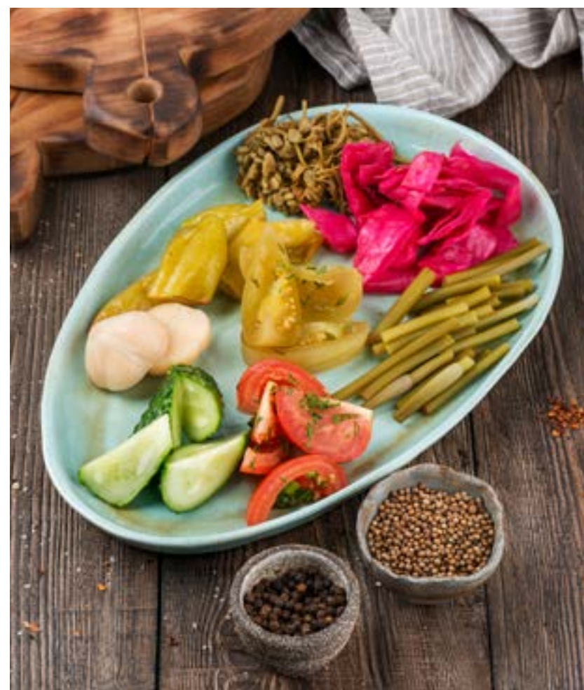
СОЛЕНЬЯ 380 г 380 ₺ PICKLES