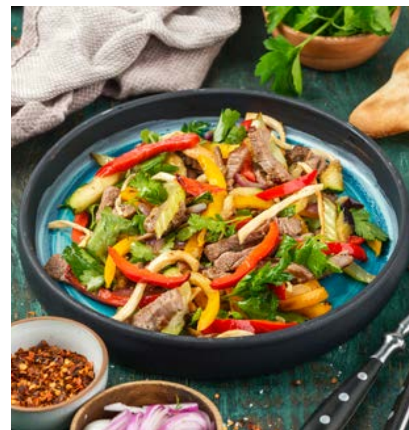
ГРИЛЬ-САЛАТ С ИНДЕЙКОЙ 280 г 430 ₺

VEGETABLE SALAD WITH FRAGRANT HERBS AND POACHED EGG