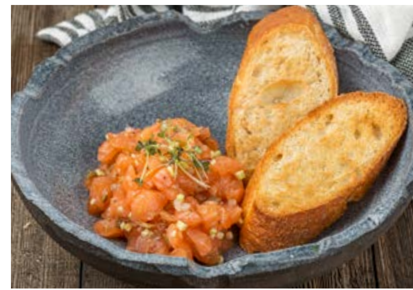
ТАРТАР ИЗ ЛОСОСЯ 150 г 560 ₺ SALMON TARTARE