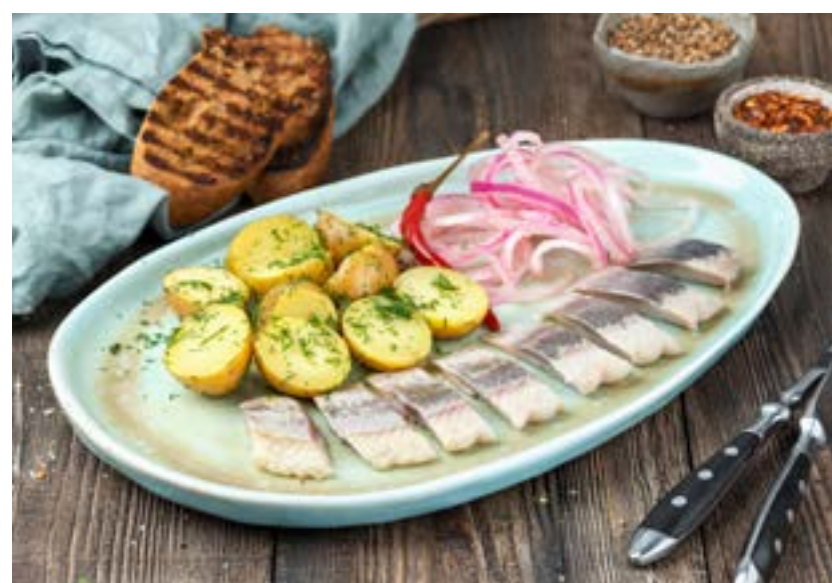
СЕЛЕДОЧКА С КАРТОФЕЛЕМ И КРАСНЫМ ЛУКОМ 300 г 360 ₺ HERRING WITH POTATOES AND RED ONION