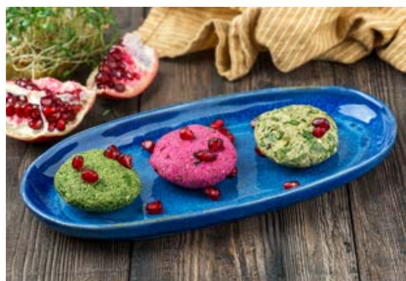
АССОРТИ ИЗ ПХАЛИ 150/5 г 320 ₺ PKHALI SET