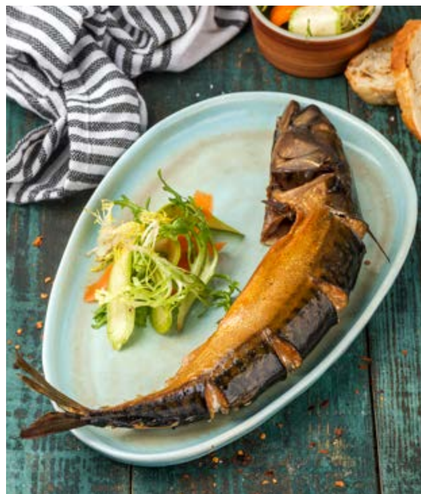
СКУМБРИЯ ИЗ КОПТИЛЬНИ СО СВЕЖИМИ ОВОЩАМИ 230/30 г 590 ₺ MACKEREL FROM THE SMOKER WITH FRESH VEGETABLES