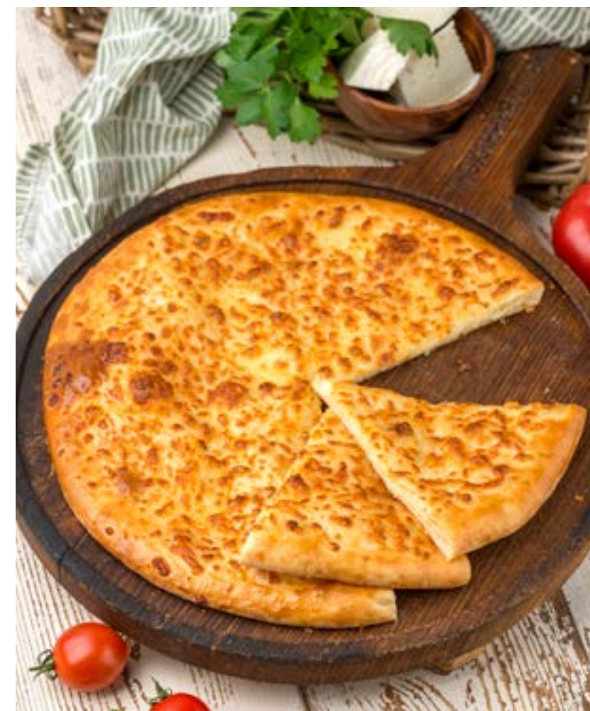
ХАЧАПУРИ ПО-МЕГРЕЛЬСКИ 500 г 480 ₺ MEGRELIAN STYLE KHACHAPURI