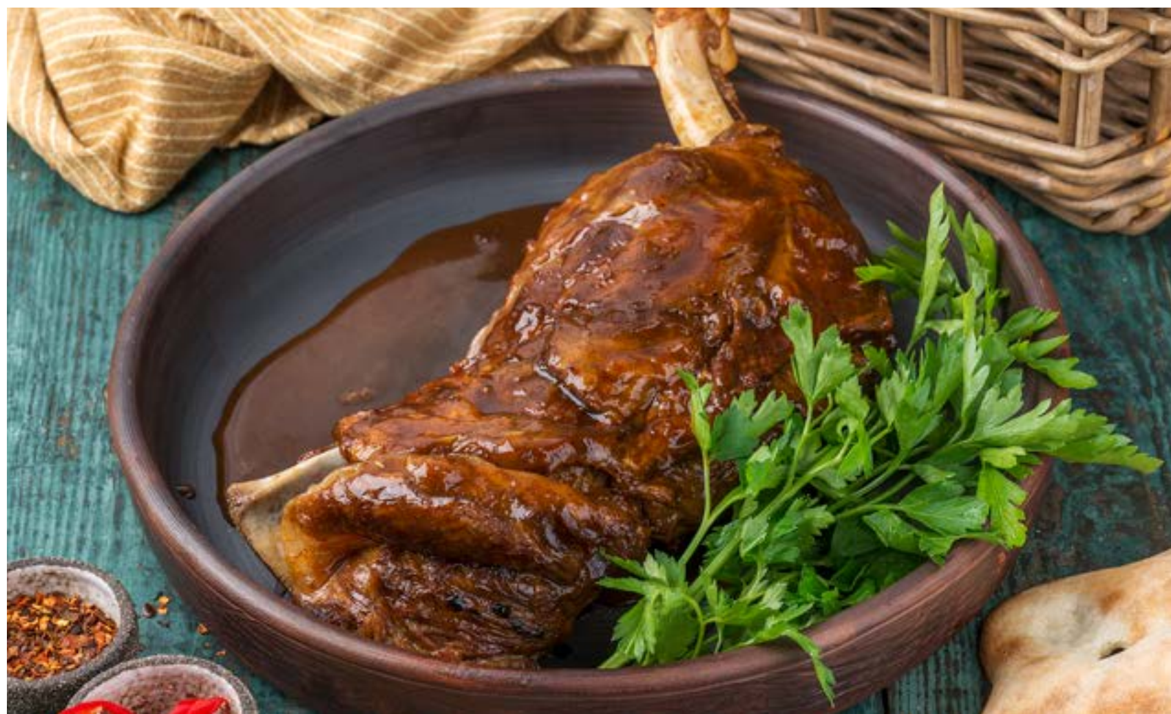
БАРАНЬЯ ЛОПАТКА (БЛЮДО НА КОМПАНИЮ)