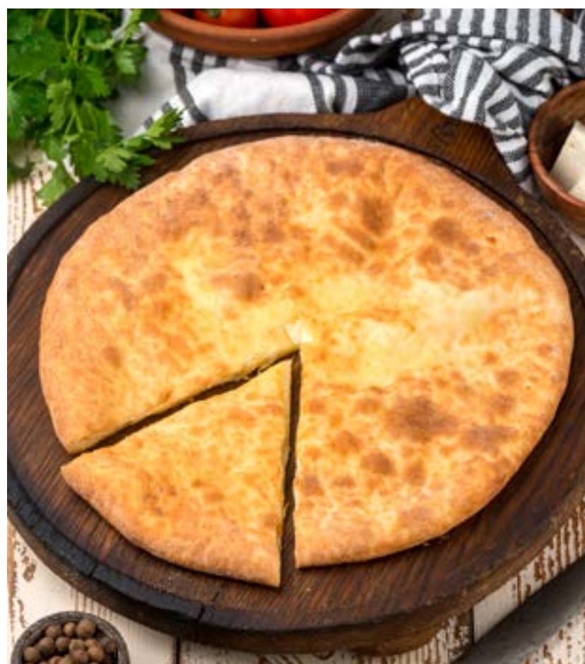
ХАЧАПУРИ ПО-ИМЕРЕТИНСКИ 450 г 430 ₺ IMERETIAN STYLE KHACHAPURI