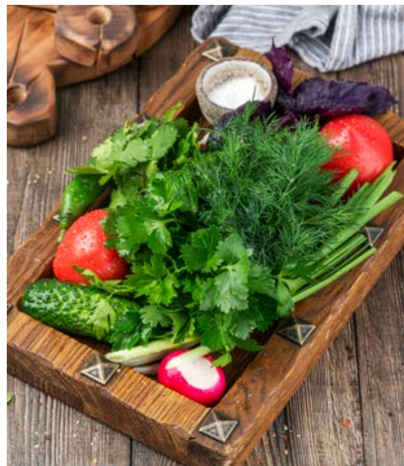
СЕЗОННЫЕ ОВОЩИ 390 г 440 ₺ VEGETABLES IN SEASON