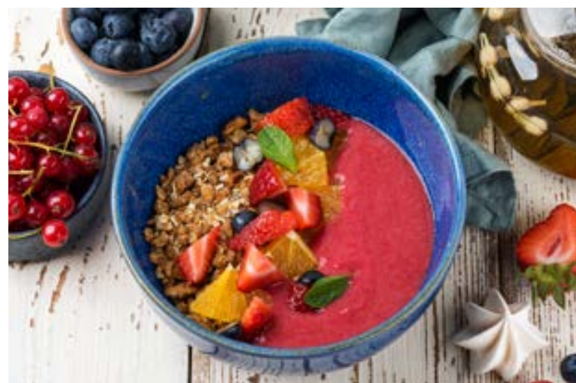
ГРАНОЛА С ЯГОДНЫМ СМУЗИ 180 г 290 ₺ GRANOLA WITH BERRY SMOOTHIE