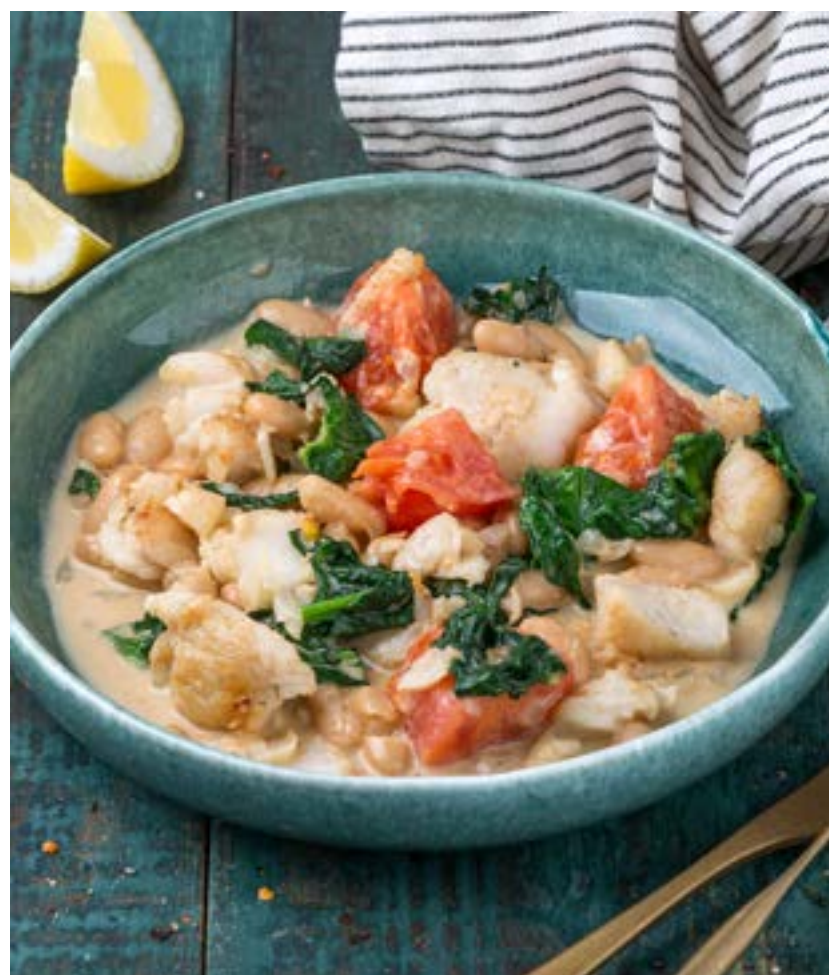
ТОМЛЕННЫЙ СУДАК С ФАСОЛЬЮ И ШПИНАТОМ 200 г 670 ₺ STEWED PERCH WITH BEANS AND SPINACH