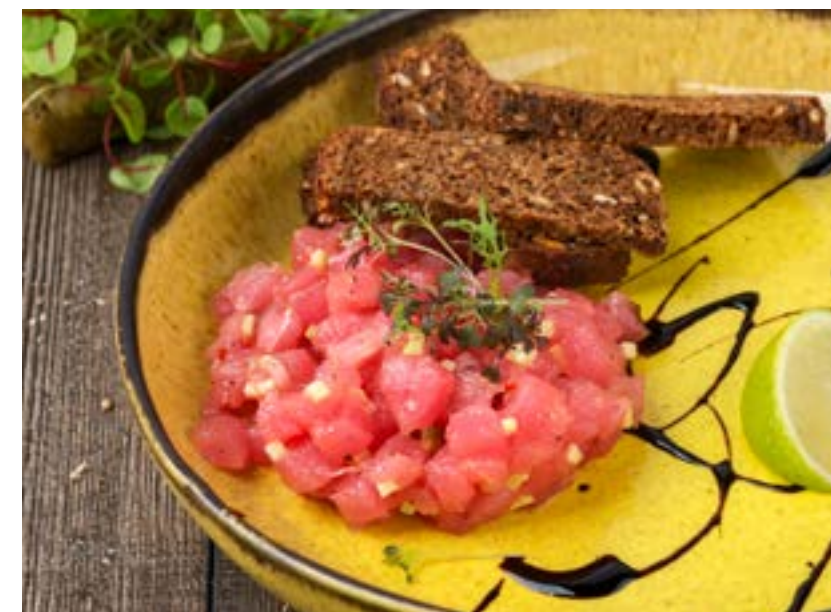
ТАРТАР ИЗ ТУНЦА 150 г 580 ₺ TUNA TARTARE