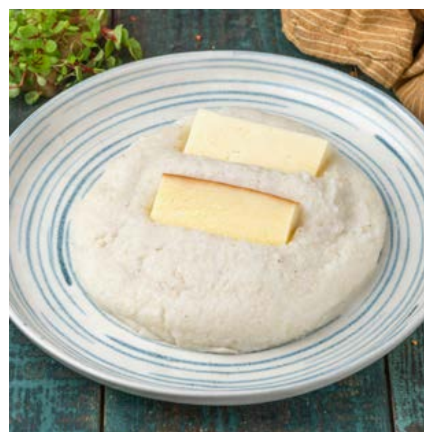
МАМАЛЫГА 380/80 г 380 ₺

Традиционное грузинское блюдо из круто заваренной кукурузной крупы с сыром сулугуни