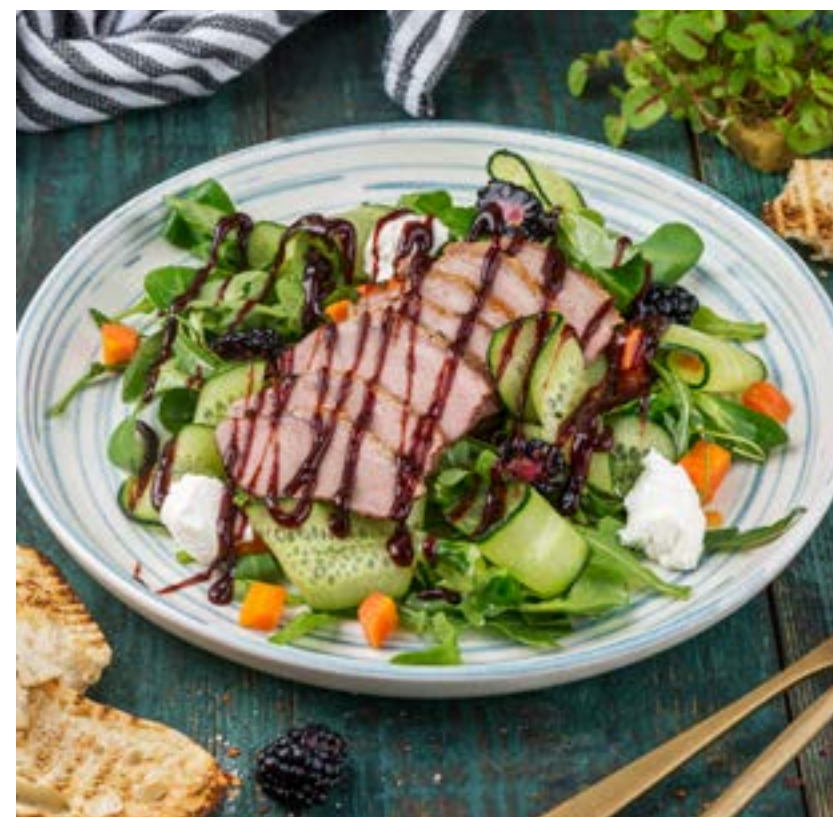
САЛАТ С УТКОЙ И ЕЖЕВИКОЙ