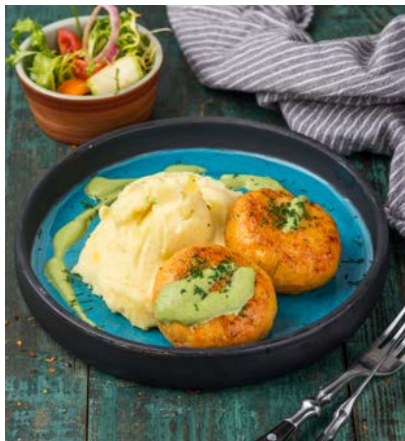
ЩУЧЬИ КОТЛЕТЫ С СОУСОМ ИЗ ЦУККИНИ 180/200/50 г 520 ₺ PIKE PATTIES WITH ZUCCHINI SAUCE