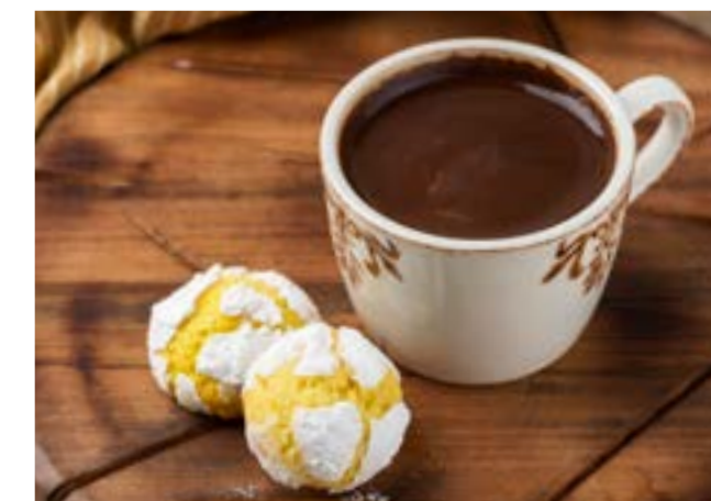
КОФЕ ПО-СУХУМСКИ 60 мл/2 шт. 170 ₺ SUKHUMI STYLE COFFEE