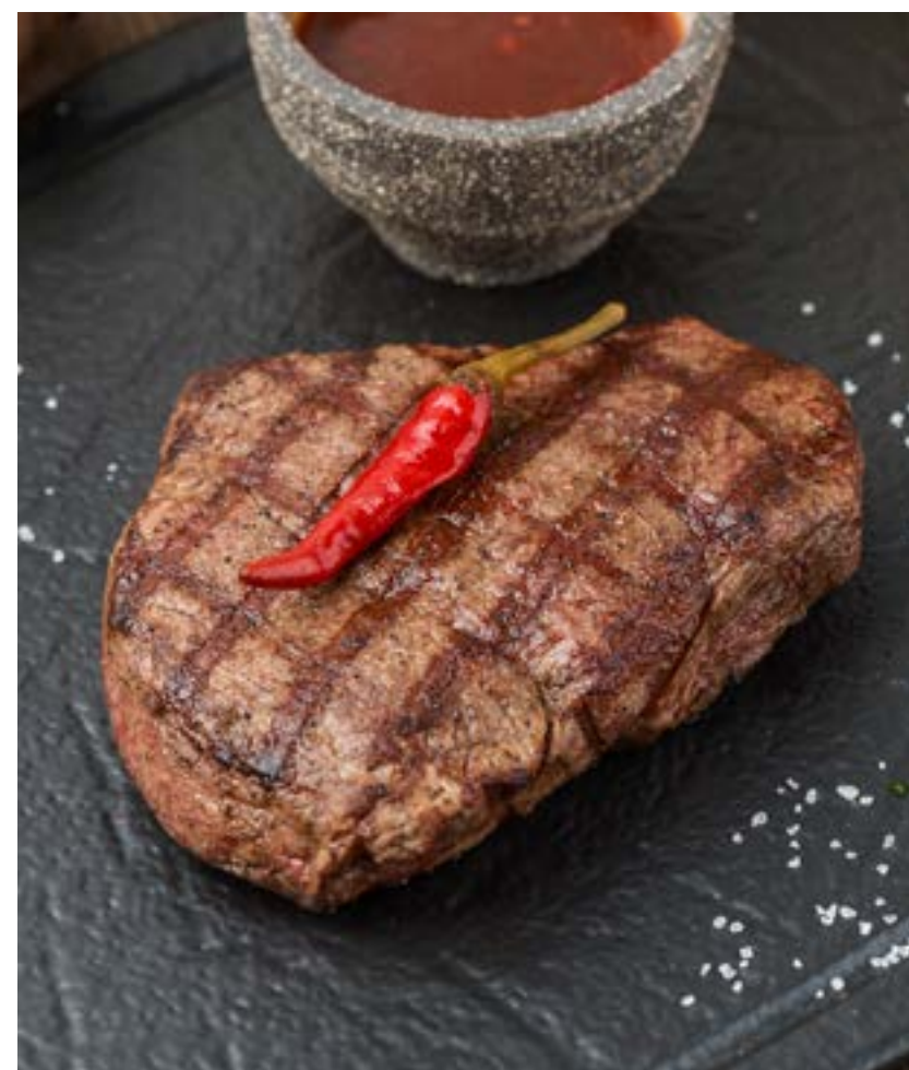
ВЫРЕЗКА ИЗ ГОВЯДИНЫ BEEF TENDERLOIN