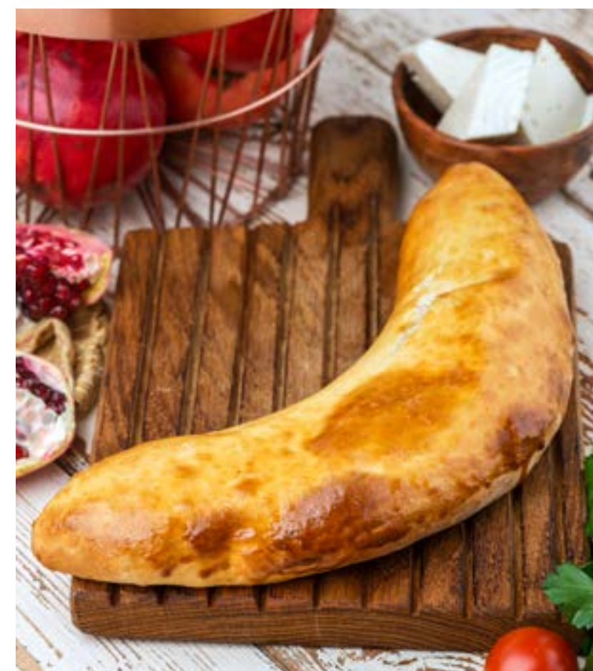
ХАЧАПУРИ ПО-ГУРИЙСКИ 390 г 390 ₺ GURIAN STYLE KHACHAPURI