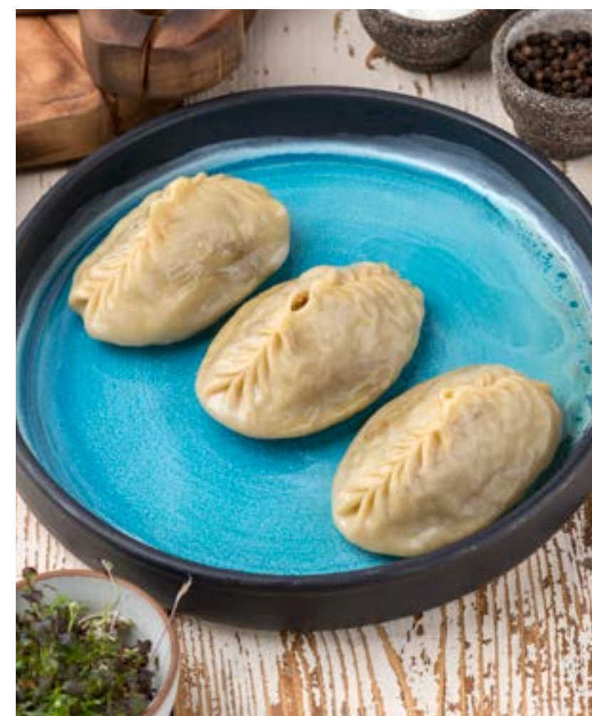
МАНТЫ 210/30 г 390 ₺