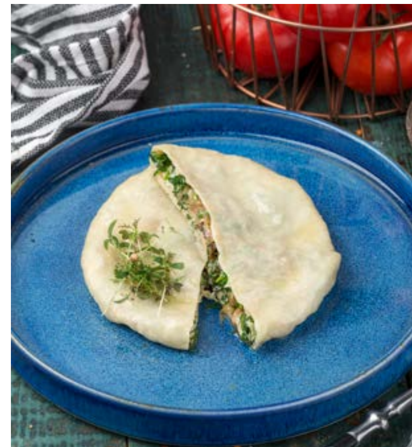
ГРУЗИНСКИЕ КВАРИ С ЗЕЛЕНЬЮ, СЫРОМ И ГРИБАМИ

BEEF STROGANOFF WITH MASHED POTATOES AND QUICK PICKLED CUCUMBERS