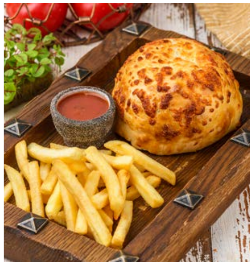
ХАЧАПУРГЕР 270/100/30 г 580 ₺ Закрытый бургер с котлетой из баранины, томатами, маринованными огурцами, зеленью и сыром сулугуни KNACHAPURGER Closed burger with lamb, tomato, pickled cucumber, herbs and suluguni cheese