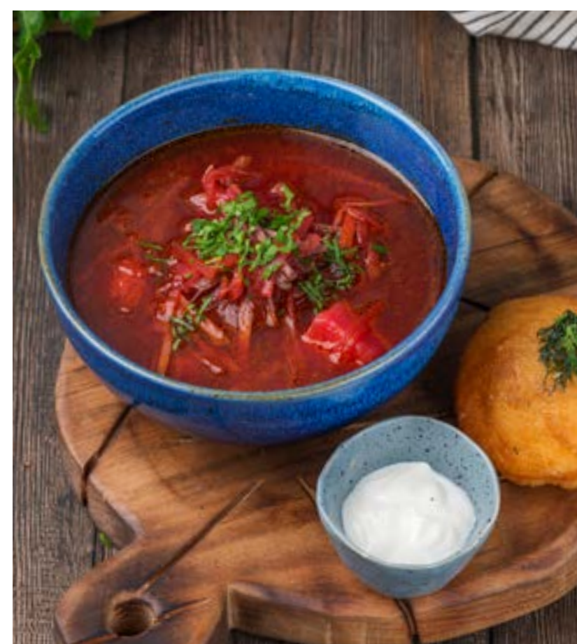
БОРЩ С ЧЕСНОЧНОЙ ПАМПУШКОЙ

Clear beef broth with mini dumplings stuffed with veal and fragrant spices