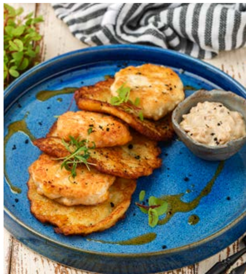
КАРТОФЕЛЬНЫЕ ДРАНИКИ С КУРИНЫМИ ОЛАДЬЯМИ 130/100/50 г 460 ₺