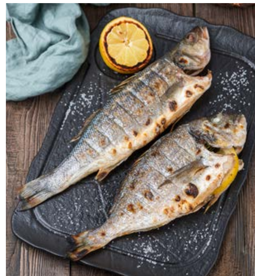
ДОРАДО НА ГРИЛЕ 1 шт./50 г 790 ₺