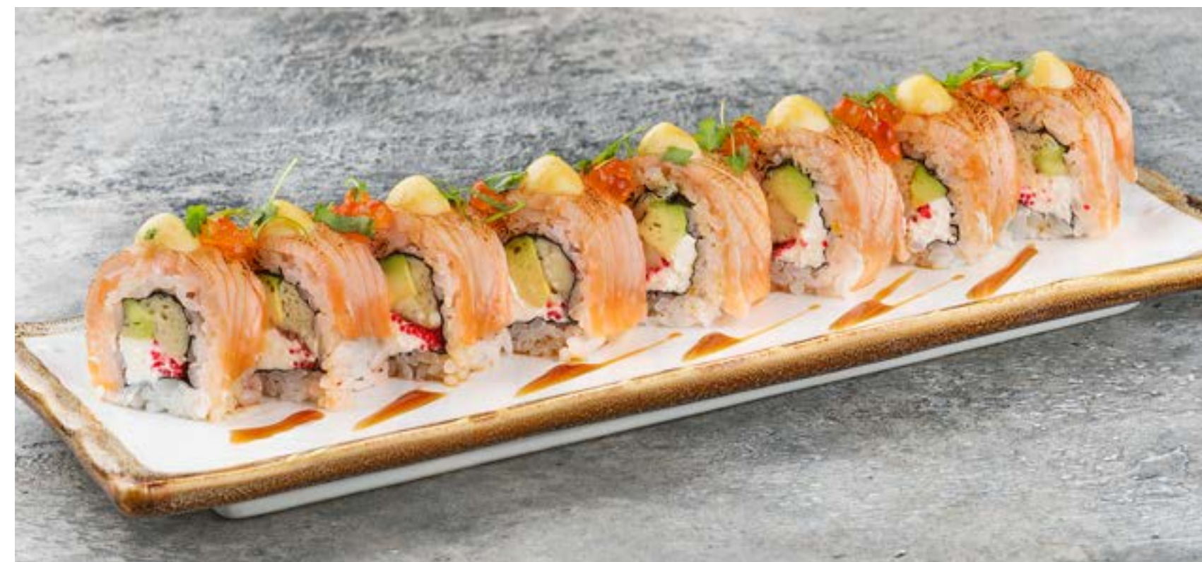
СЛИВОЧНЫЙ РОЛЛ С ЛОСОСЕМ И КРАСНОЙ ИКРОЙ

ROLL WITH SHRIMP IN TEMRURA AND STRAW POTATO