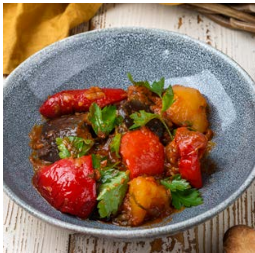
АДЖАПСАНДАЛ 250 г 420 ₺

Тушенные с чесноком и зеленью кусочки баклажана, паприки, картофеля, томатов и лука