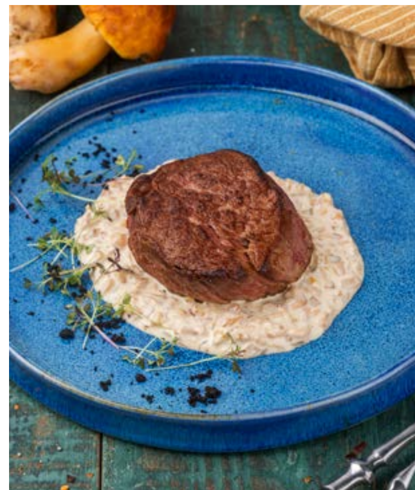
МЕДАЛЬОН ИЗ ТЕЛЯТИНЫ НА ГРИБНОМ СОУСЕ 350 г 990 ₺ VEAL MEDALLION WITH MUSHROOM SAUCE