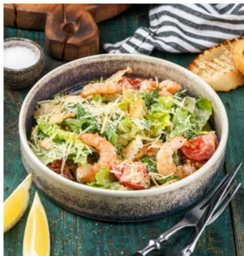
«ЦЕЗАРЬ» С ЦЫПЛЕНКОМ 220 г 490 ₺

SALAD WITH PINK TOMATOES, MATSONI SAUCE AND ADJIKA