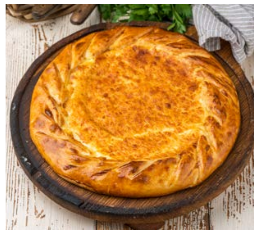
ХАЧАПУРИ ОТ ТЕТИ ЭЛИСО 600 г 630 ₺ Домашний хачапури с начинкой из сыра сулугуни и имеретинского сыра, приготовленный по старинному рецепту KNACHAPURI FROM AUNT ALISO Homemade khachapuri stuffed with suluguni cheese and Imeretian cheese, cooked using an old recipe