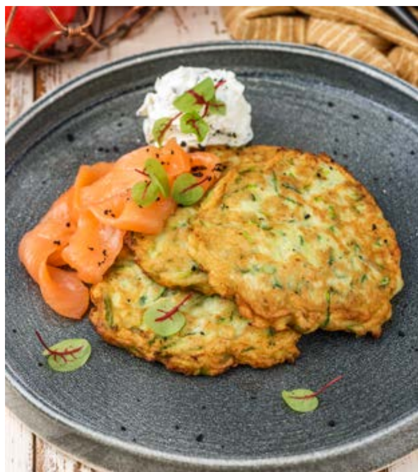
ОЛАДЬИ ИЗ ЦУКИНИ С ЛОСОСЕМ И СЛИВОЧНЫМ КРЕМОМ 140/40/30 г 490 ₺

ZUCCHINI PANCAKES WITH SALMON AND CREAM CHEESE