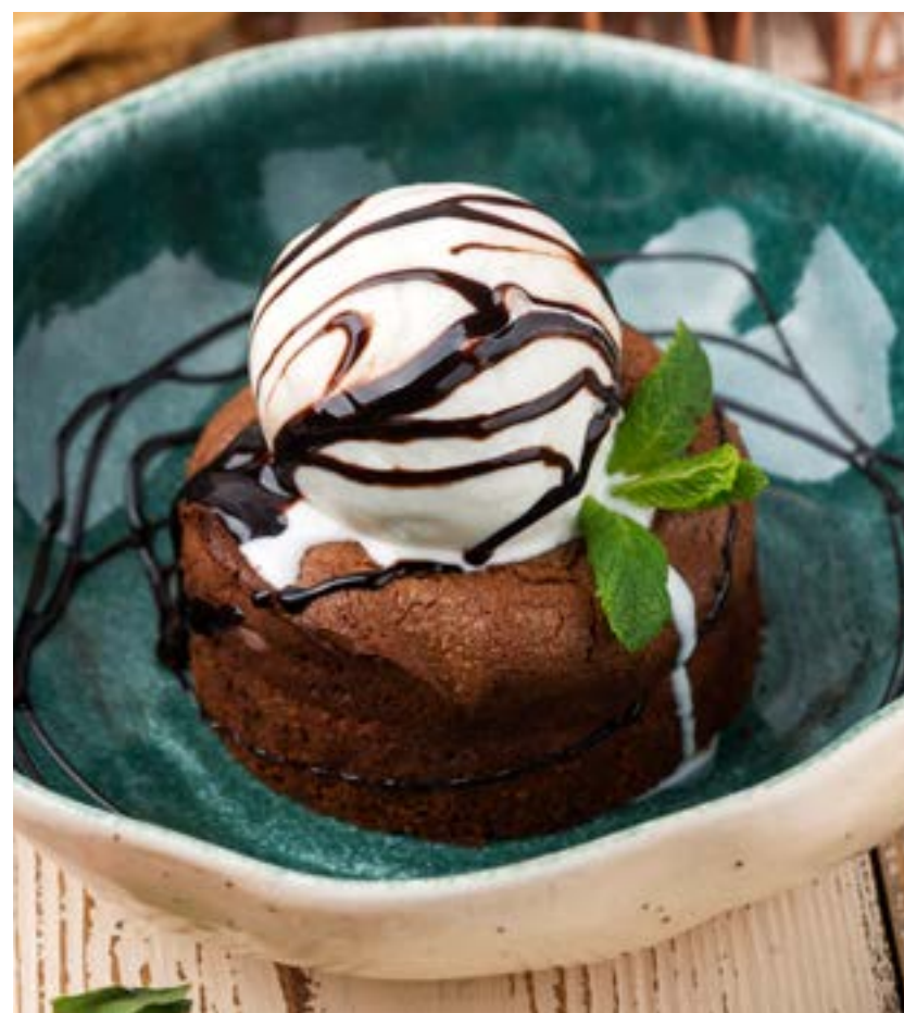
«ШОКОЛАДНАЯ ШКАТУЛКА» С ВАНИЛЬНЫМ МОРОЖЕНЫМ