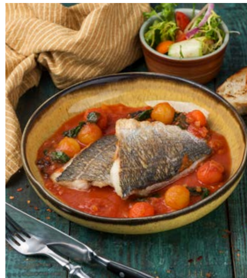
ДОРАДО С ОВОЩАМИ 180 г 720 ₺ DORADO WITH VEGETABLES