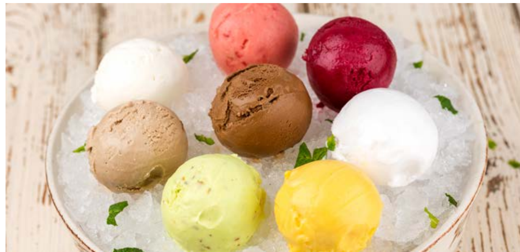
СОРБЕТ В АССОРТИМЕНТЕ

Малиновый / манговый с маракуйей / с черной смородиной / клубничный / кокосовый