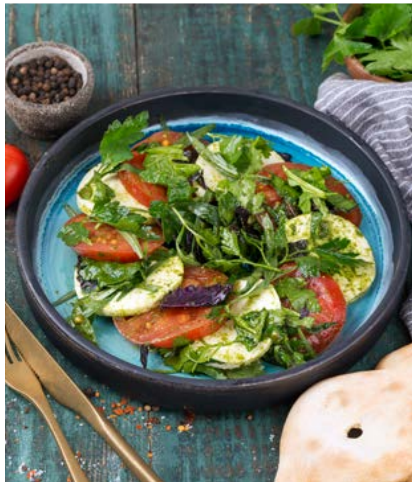
КВЕЛЛИ С ТОМАТАМИ 210 г 440 ₺