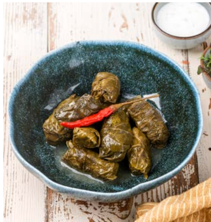
ДОЛМА СО СВИНИНОЙ/ГОВЯДИНОЙ 170/30 г 420 ₺

ZUCCHINI PANCAKES WITH SALMON AND CREAM CHEESE