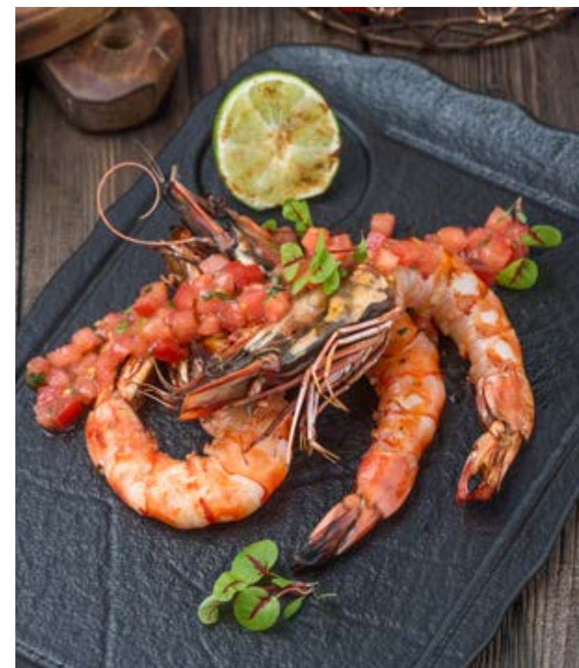
КОРОЛЕВСКИЕ КРЕВЕТКИ НА ГРИЛЕ С ТОМАТНОЙ САЛЬСОЙ 230 г 1650 ₺