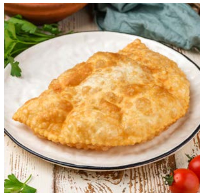
ЧЕБУРЕК С СЫРОМ 170 г 280 ₺