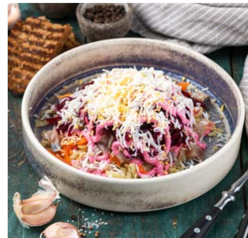
«СЕЛЬДЬ ПОД ШУБОЙ»