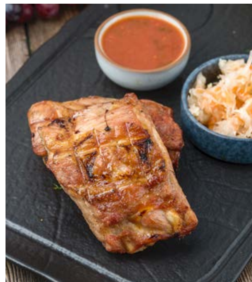
СВИННЫЕ РЕБРА С КВАШЕНОЙ КАПУСТОЙ 250/50/30 г 590 ₺