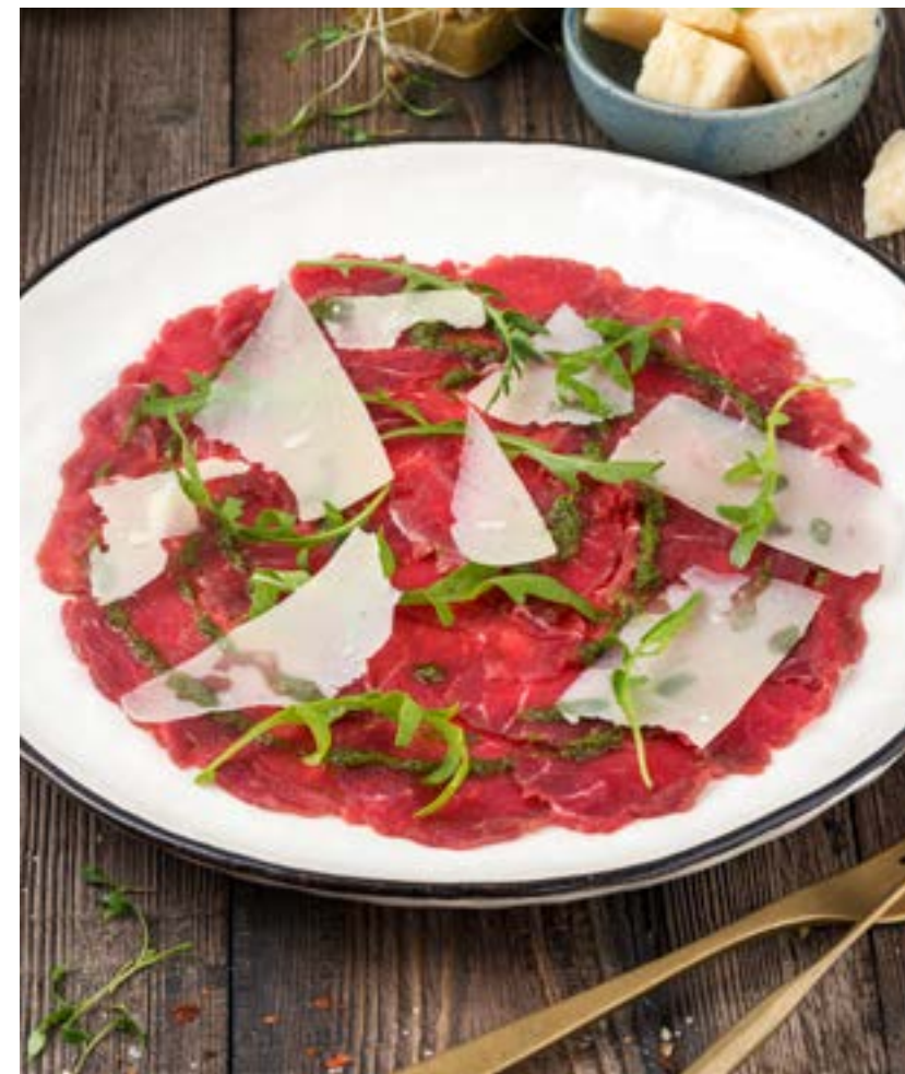
КАРПАЧО С ГОВЯДИНОЙ 110 г 590 ₺ BEEF CARPACCIO