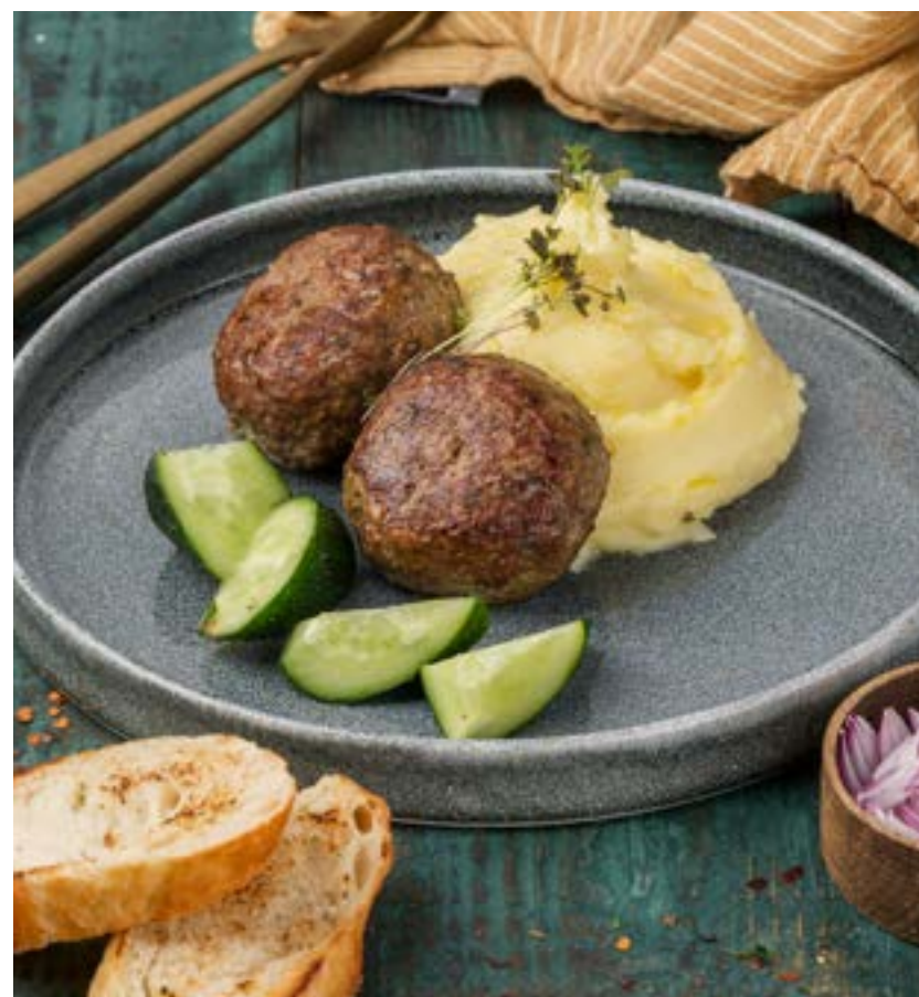
ДОМАШНИЕ КОТЛЕТЫ ОТ ПЕТРОВНЫ 180/200/40 г 490 ₺ HOMESTYLE MEAT PATTIES BY PETROVNA