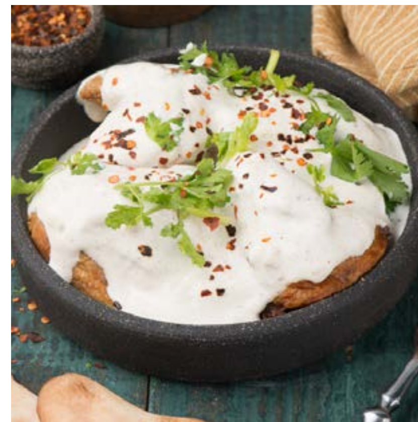
ЧКМЕРУЛИ 1 шт./150 г 760 ₺

Цыпленок, запеченный в сметанно-чесночном соусе, с добавлением пряных специй