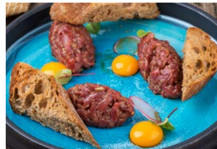
ТАРТАР ИЗ ГОВЯДИНЫ 150 г 560 ₺ BEEF TARTARE