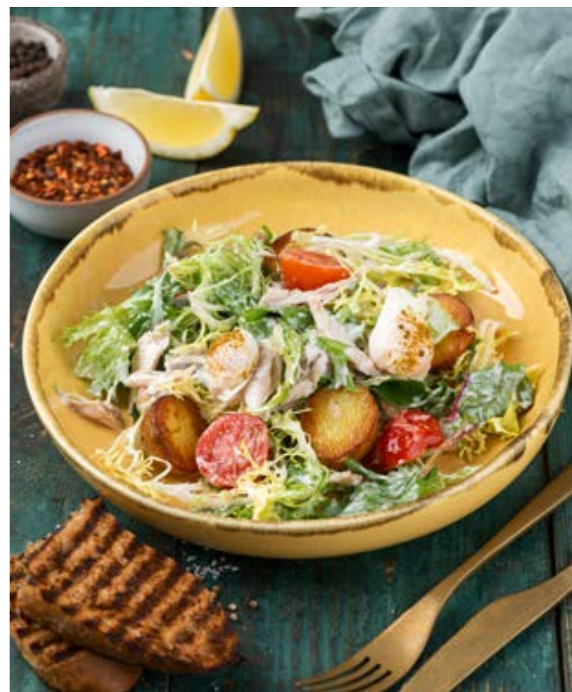
САЛАТ СО СКУМБРИЕЙ