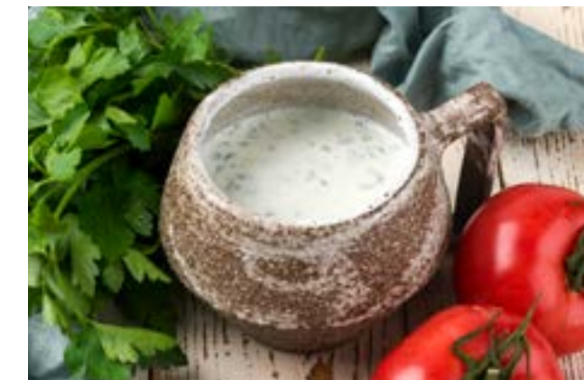
АЙРАНИ ОТ НАНИ 250 мл 160 ₺ AYRANI FROM NANNY