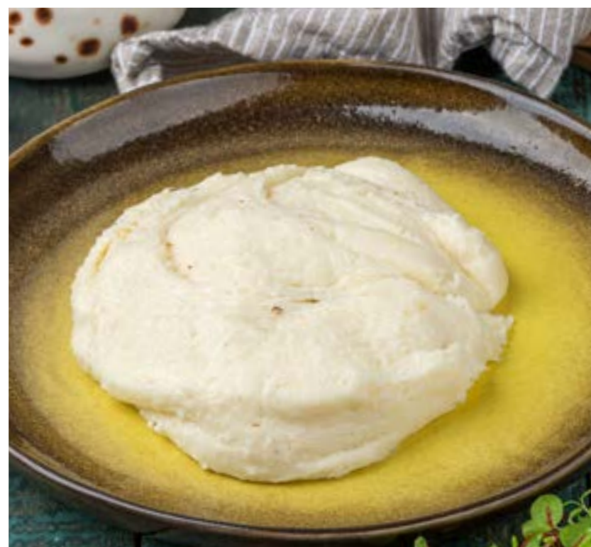
ЭЛАРДЖИ 400/200 г 450 ₺

Традиционное грузинское блюдо из круто заваренной кукурузной крупы с замешанным сыром сулугуни. Подается с мацони