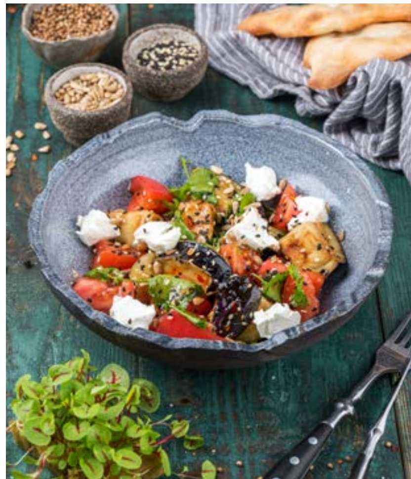
САЛАТ С ХРУСТЯЩИМИ БАКЛАЖАНАМИ 260 г 480 ₺