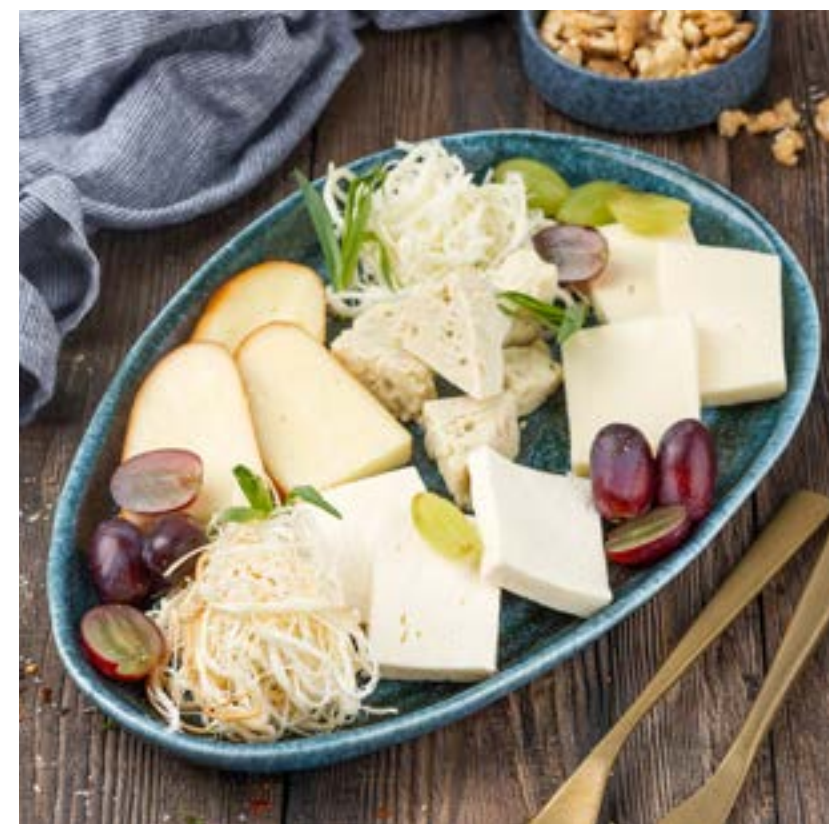
АССОРТИ ДОМАШНИХ СЫРОВ 240/50/5 г 560 ₺ Имеретинский сыр, сыр сулугуни, копченый сыр сулугуни, молочный чечил, копченый сыр чечил, сыр гуда HOMEMADE CHEESE PLATTER Imeretian cheese, suluguni cheese, smoked suluguni cheese, milky chechil cheese, smoked chechil cheese, guda cheese