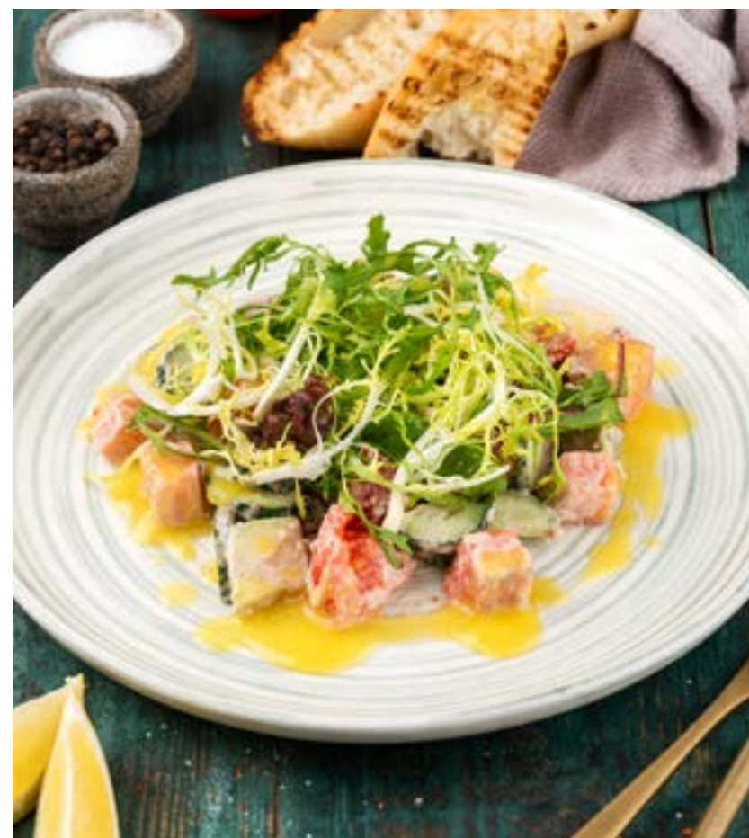
САЛАТ С КОПЧЕНЫМ ЛОСОCEM

Warm salad with baked duck in spicy sauce with fresh herbs and goat cheese, dressed with berry sauce