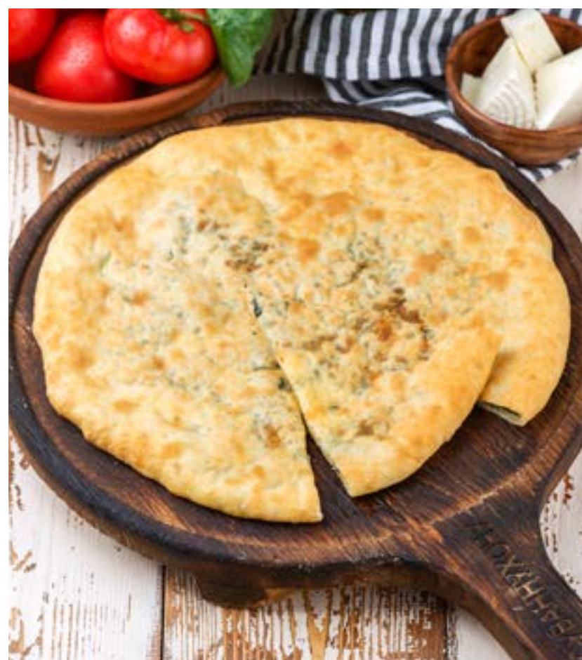
ХАЧАПУРИ СО ШПИНАТОМ 400 г 480 ₺ KHACHAPURI WITH SPINACH