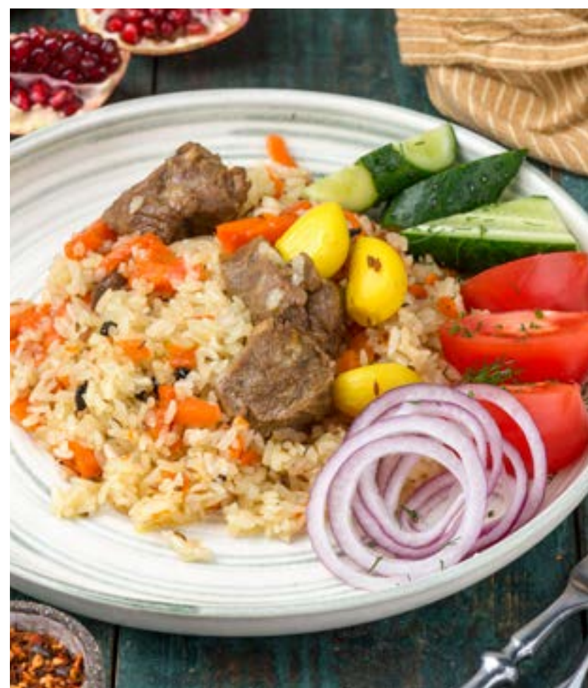
ПЛОВ С БАРАНИНОЙ 350/30/30/30 г 540 ₺

Chicken baked in a creamy garlic sauce with spices