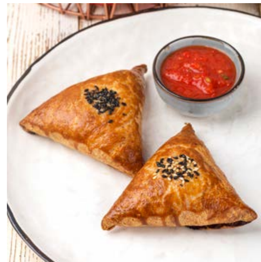
САМСА С БАРАНИНОЙ 170/30 г 290 ₺