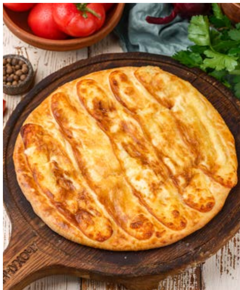
ХАЧАПУРИ С КОПЧЕНЫМ СЫРОМ СУЛУГУНИ 490 г 480 ₺ KHACHAPURI WITH SMOKED SULUGUNI CHEESE