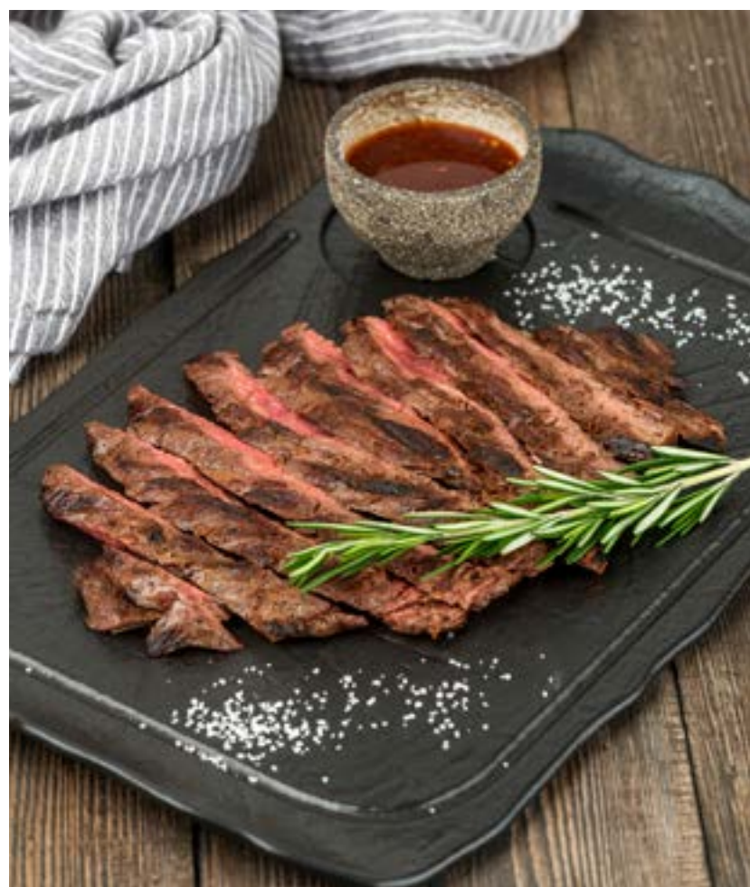
СТЕЙК МАЧЕТЕ MACHETE STEAK