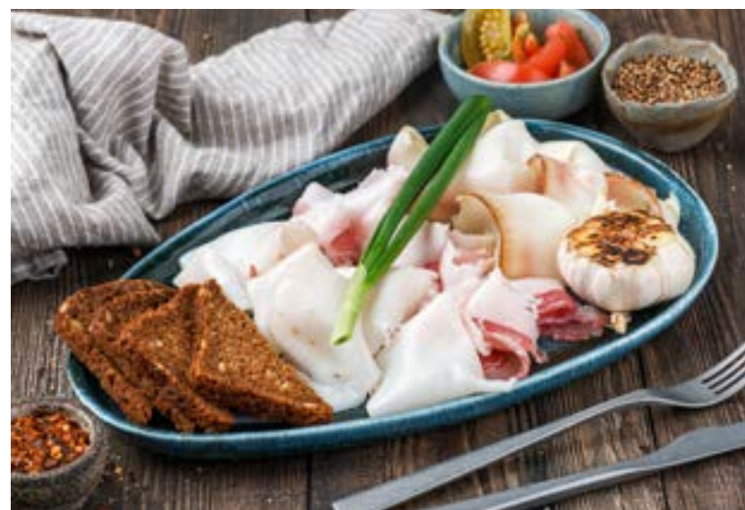
АССОРТИ ИЗ САЛА 250 г 520 ₺ LARD PLATTER