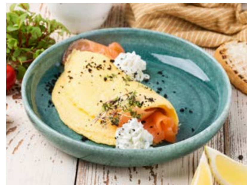
ОМЛЕТ С ЛОСОСЕМ ФИРМЕННОГО ПОСОЛА И СЫРНЫМ КРЕМОМ 190/40/30 г 390 ₺ OMELET WITH CHEF'S SALTED SALMON AND CREAM CHEESE