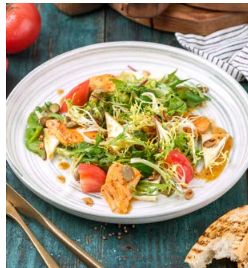
ТЕПЛЫЙ САЛАТ С ЛОСОCEM И СЫРОМ СУЛУГУНИ

WARM SALAD WITH CHICKEN AND SMOKED SULUGUNI CHEESE