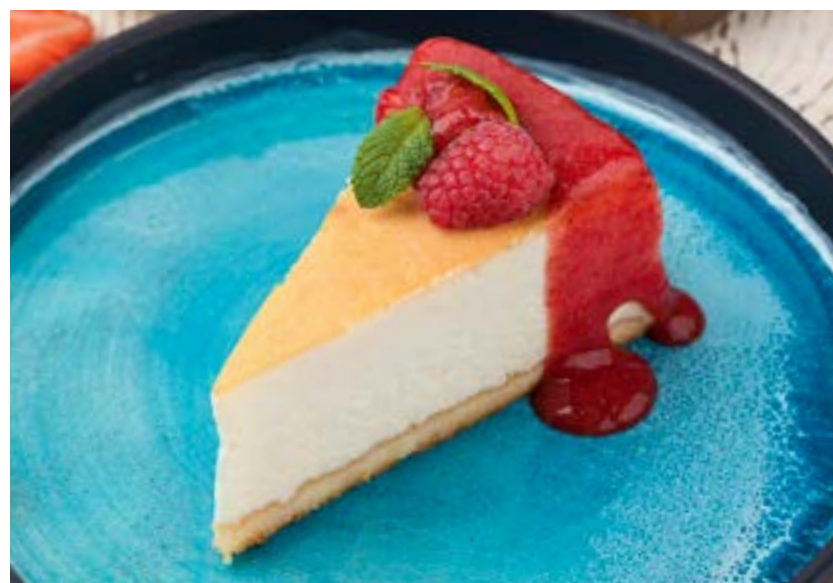
ЧИЗКЕЙК С КЛУБНИЧНЫМ СОУСОМ

Soft yogurt dessert on thin sponge cake with mango and passion fruit soufflé