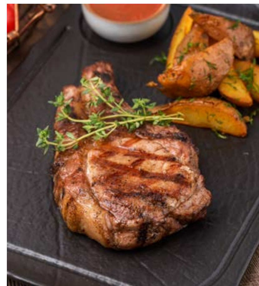
СВИННАЯ КОРЕЙКА С КАРТОФЕЛЕМ АЙДАХО 170/130/40 г 790 ₺