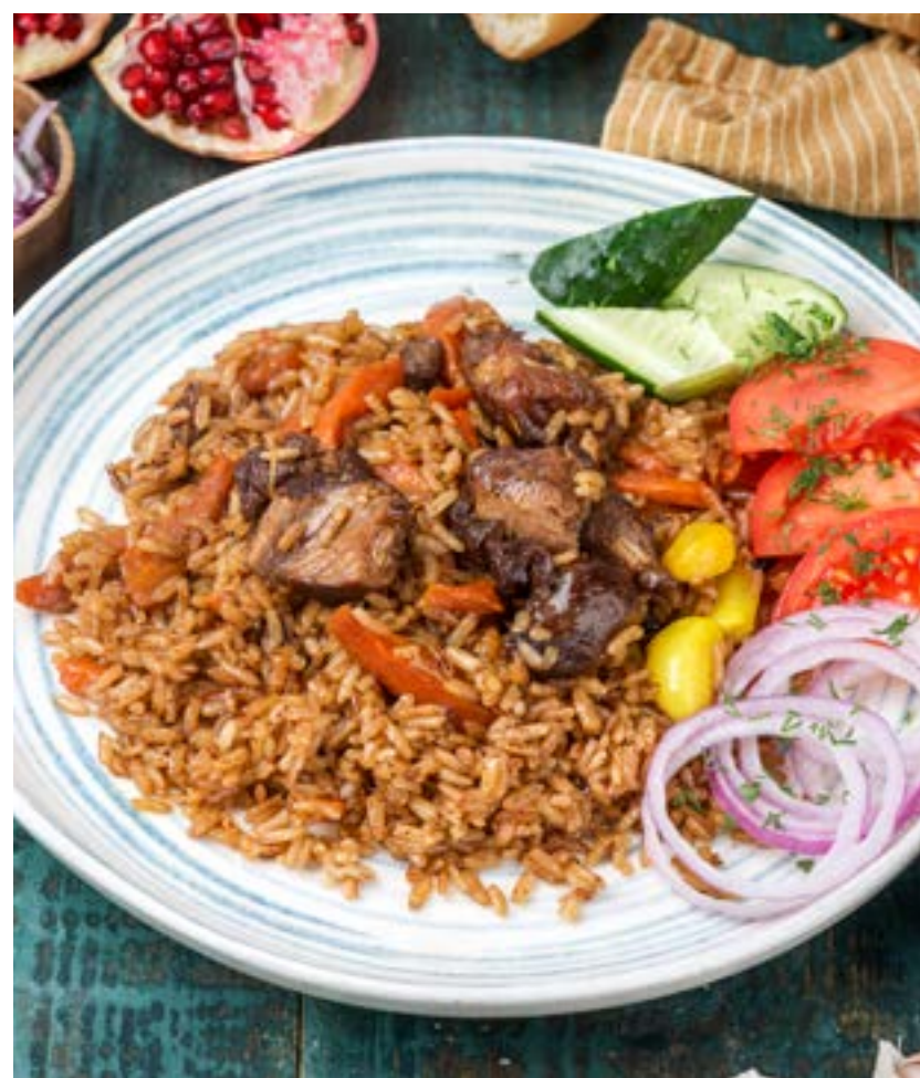
ПЛОВ «ЧАЙХАНСКИЙ» 350/30/30/30 г 590 ₺