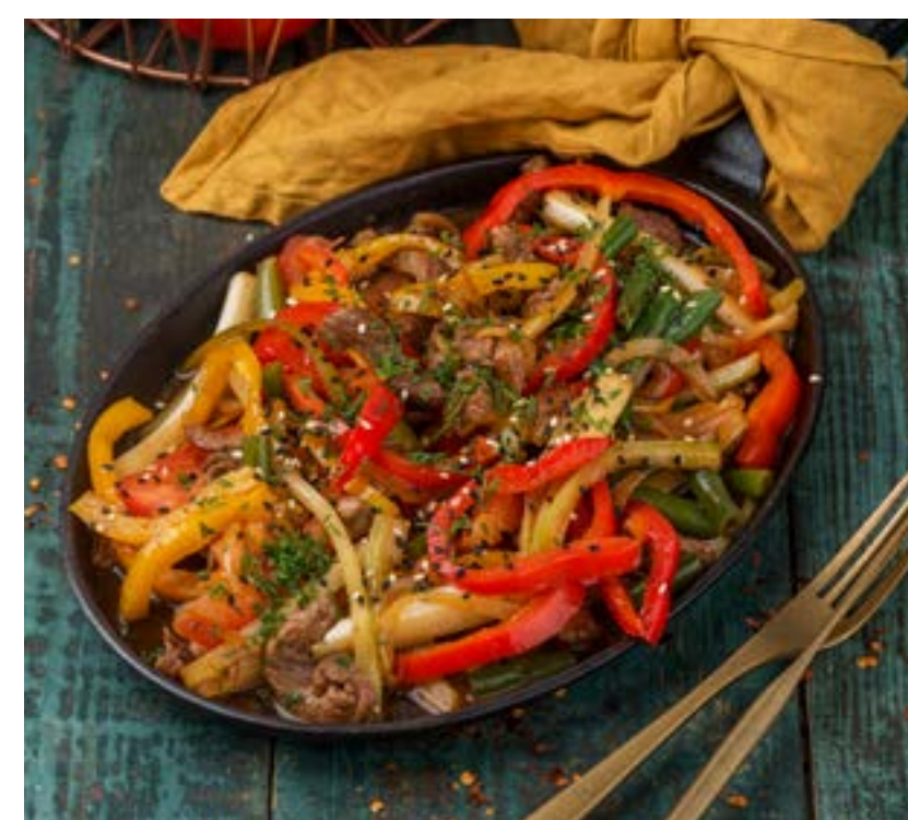
КОВУРМА ПО-ФЕРГАНСКИ 350 г 740 ₺

Traditional Georgian dish of thickly boiled cornmeal with suluguni cheese