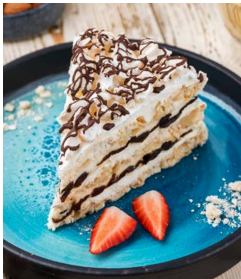
«ГРАФСКИЕ РАЗВАЛИНЫ» С ЧЕРНОСЛИВОМ

Vanilla / chocolate / creme brulee / pistachio