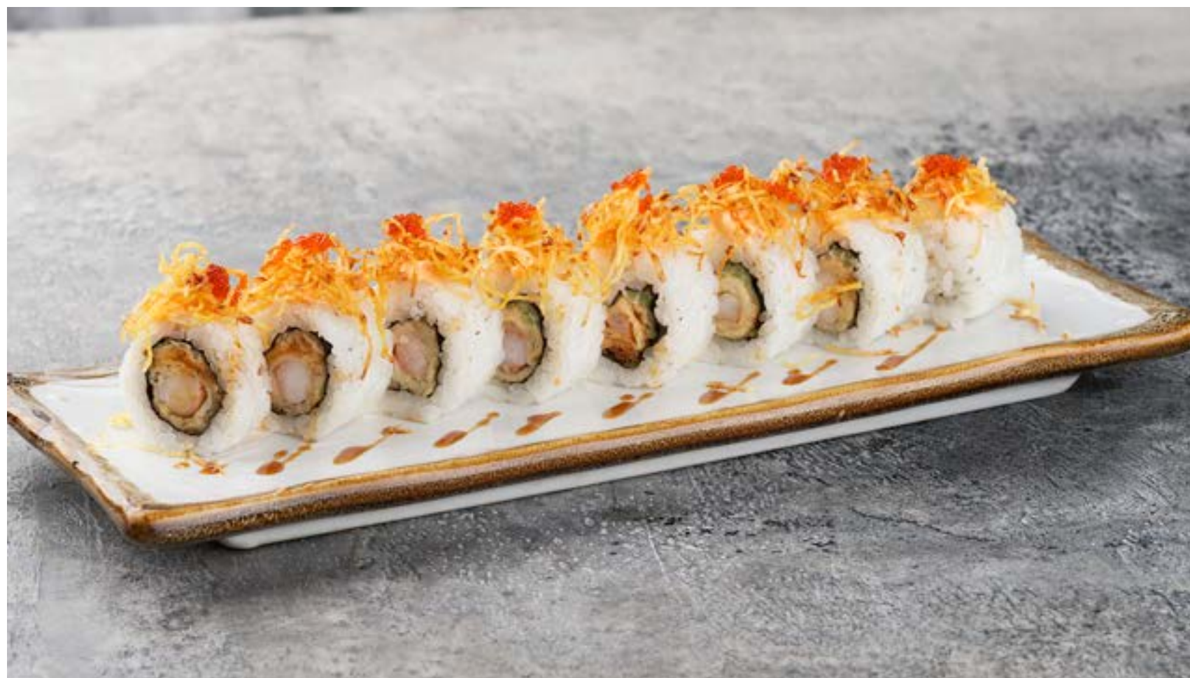
РОЛЛ С КРЕВЕТКОЙ В ТЕМПУРЕ С КАРТОФЕЛЕМ ПАЙ