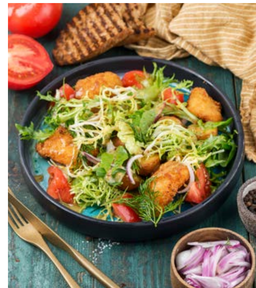
САЛАТ С ПЕЧЕНЫМ КАРТОФЕЛЕМ И ТРЕСКОЙ