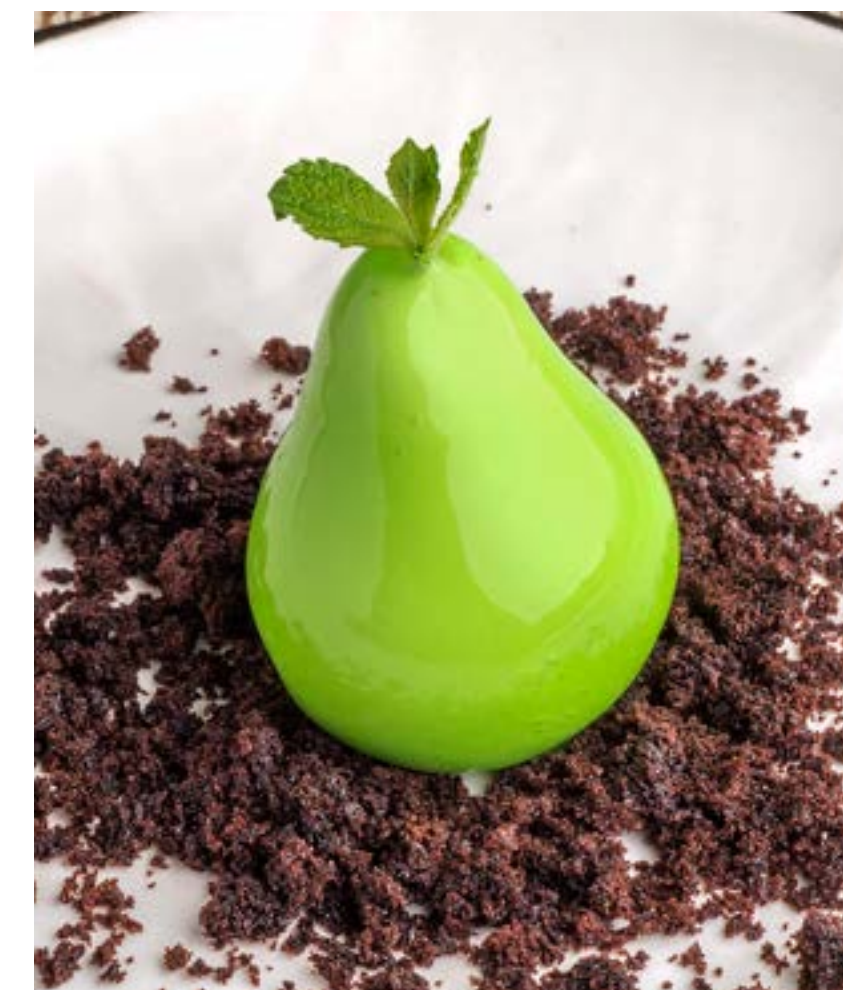
ГРУША С КАРАМЕЛЬНЫМ ТРЮФЕЛЕМ