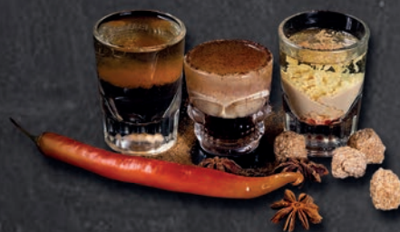
РЫЖАЯ СОБАКА, Б-52, ОПУХОЛЬ МОЗГА