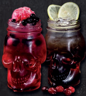
ЛОНГ АЙЛЕНД И ОШИБКА МИКСОЛОГА