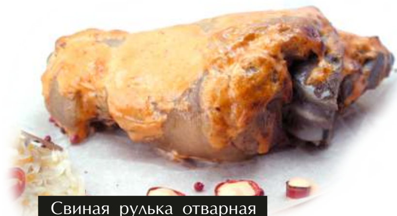
Свиная рулька отварная с квашеной капустой

Сочный говяжий стейк подается с морковным муссом и овощами гриль: цукини, болгарский перец, баклажан и вишнево – брусничным соусом с пряными специями: тимьян и розмарин. Особенно хорош стейк с красным вином!