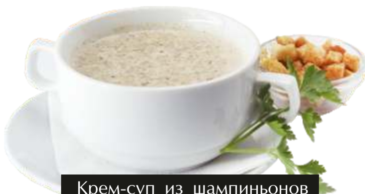
Крем-суп из шампиньонов

Пицца 30см/490гр 400руб Чикаго 20см/250гр 215руб Соус Помадоро, пеперони, маслины, копченая курица, колбаски, перец Халапеньо, сыр Моцарелла.