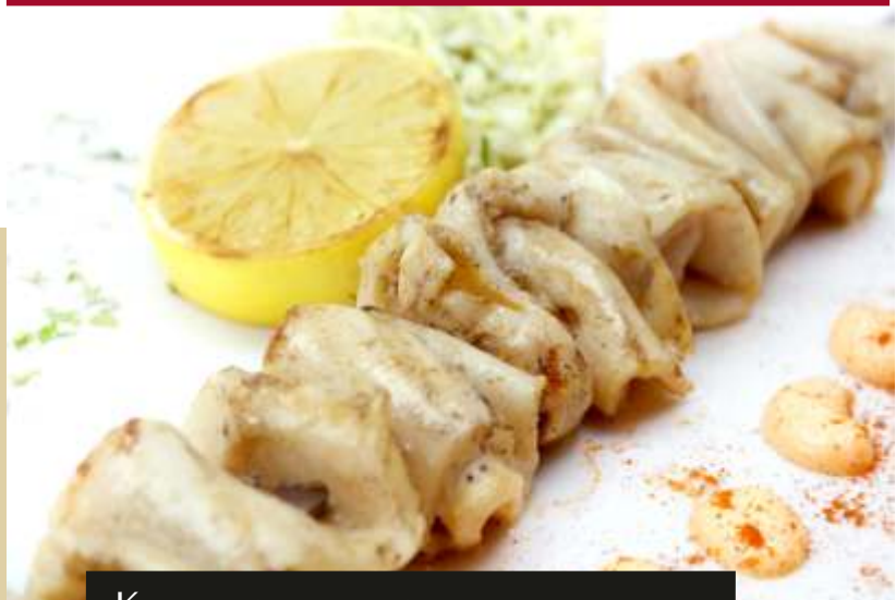
Кальмары на гриле с салатом