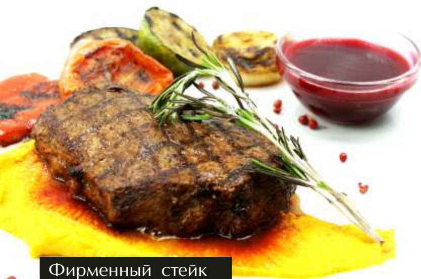
Фирменный стейк New Yorker