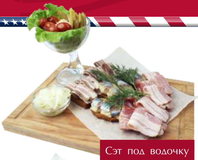
Сэт под водочку