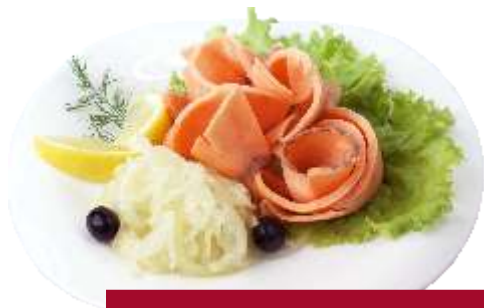
Строганина из семги