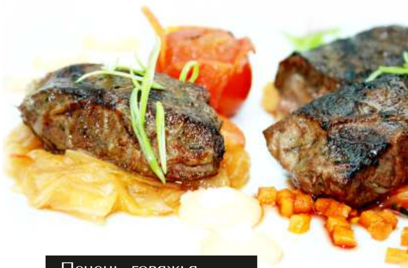
Печень говяжья с пряными овощами

Запеченный рулет из свиного уха в кисло – сладком соусе Сэн СоЙ. Подается с гарниром из квашеной капусты, перцем Чили, петрушкой и лавровым листом.