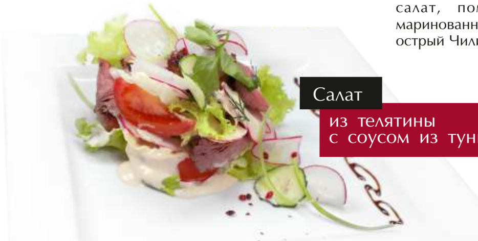
Салат из телятины с соусом из тунца