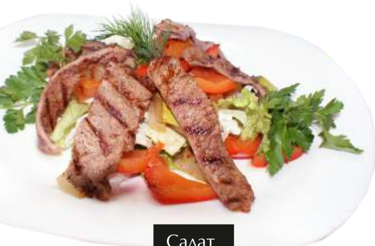
Салат теплый гриль

Салат с кальмарами 200руб 130гр Кальмары жаренные на гриле, микс салат, помидорки Черри, огурец, лук маринованный под оливково-соевым соусом и острый Чили.