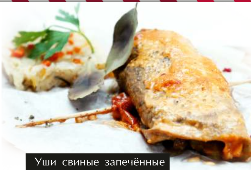
Уши свиные запечённые с гарниром из капусты

Острые крылья на гриле с соусом Барбекю 215руб 210/30/50гр