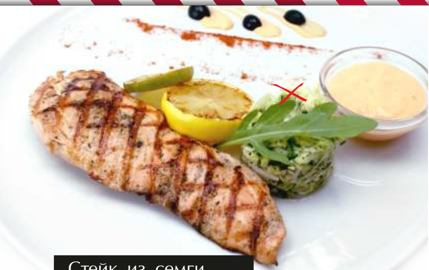
Стейк из семги

Скумбрия маринованная в аджике и жареная на гриле. Подается с салатом из свежих огурцов со сметаной.